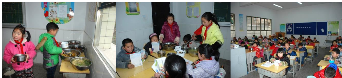
图 14 就餐情况组图 (有序就餐)