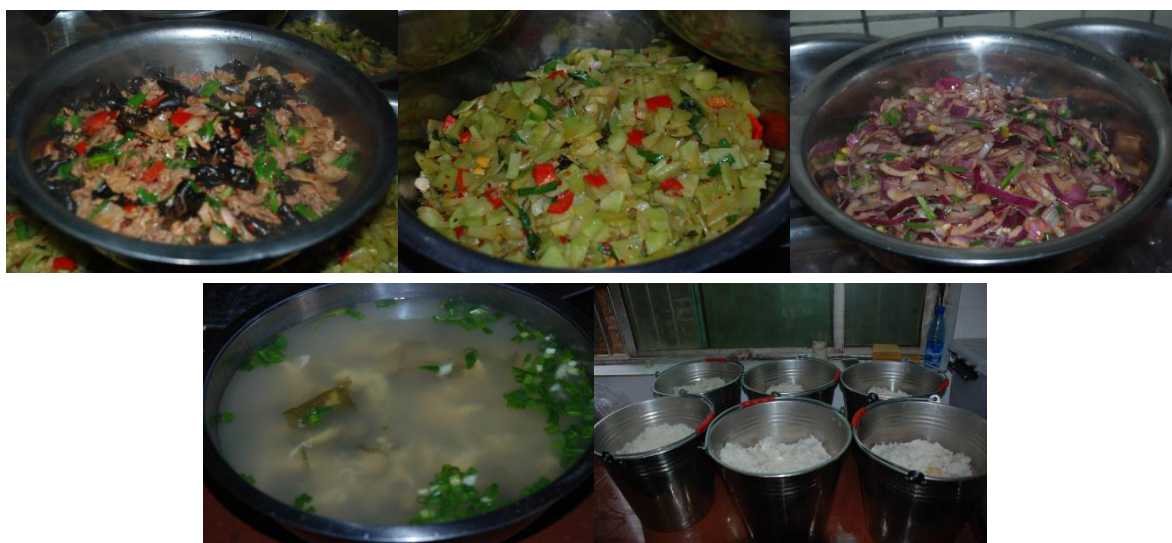
图 10 学校午餐食品组图