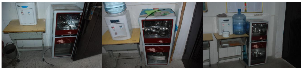
图8 小学部消毒柜未正常使用