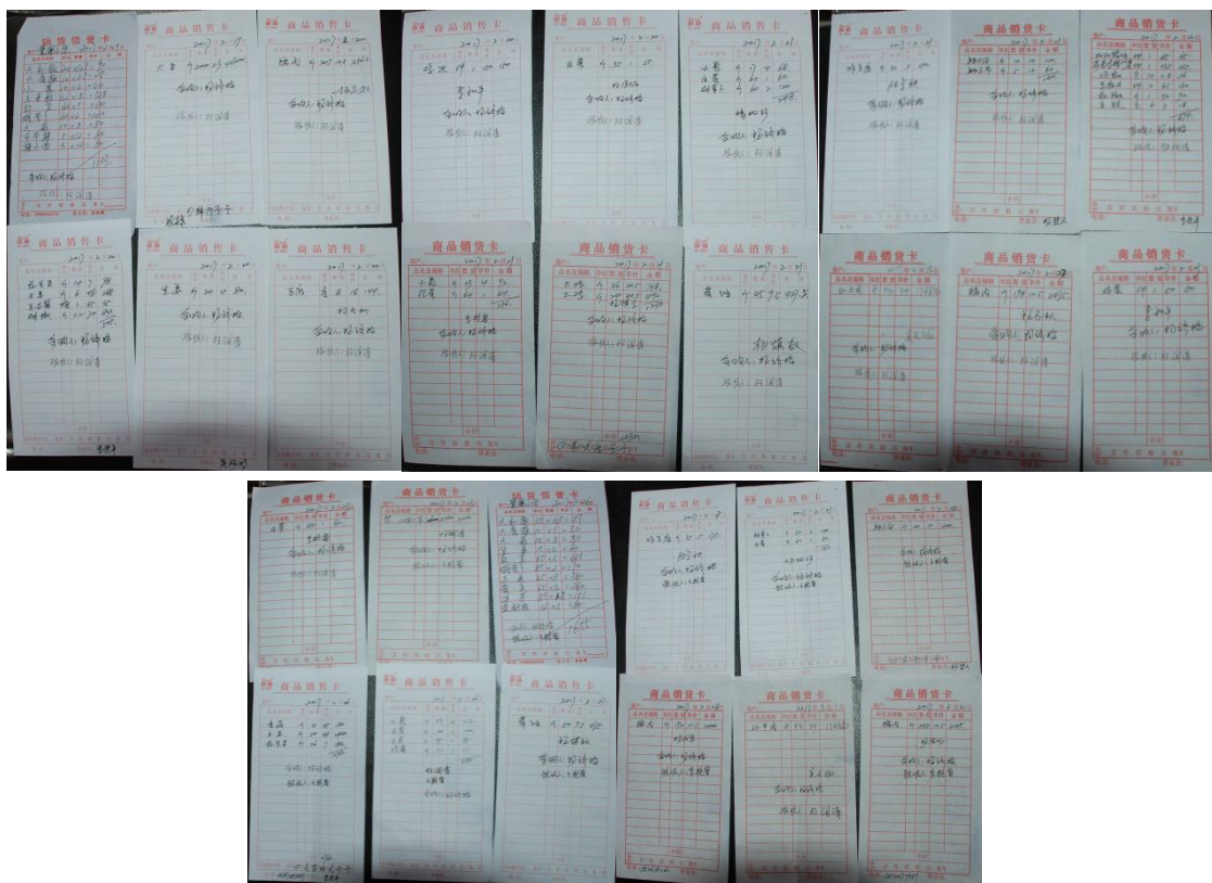
图 18 原始凭证组图