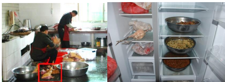
图 7 猪肉直接置于地面上、熟食未密封冷藏