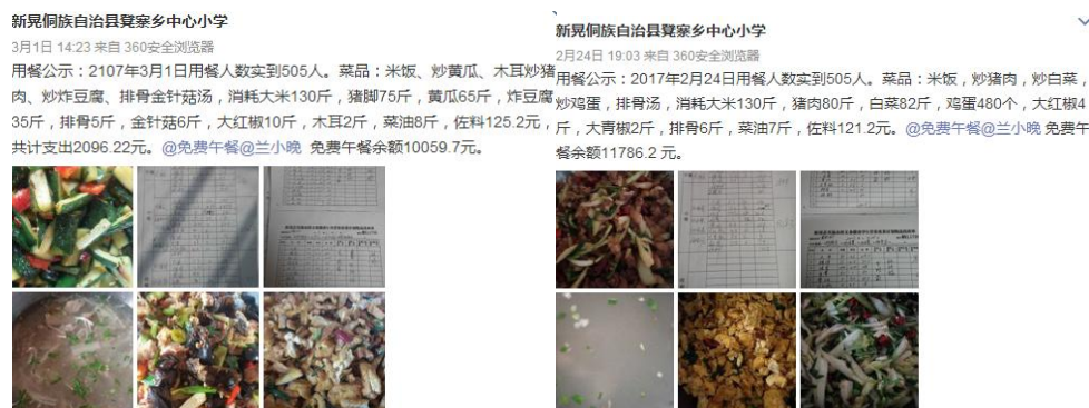
图 11 学校菜品留样记录及微博公示截图