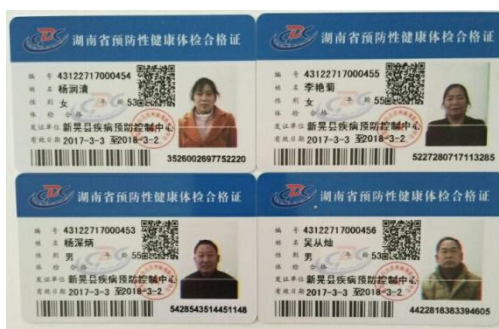
图 12 厨师健康证在有效期内