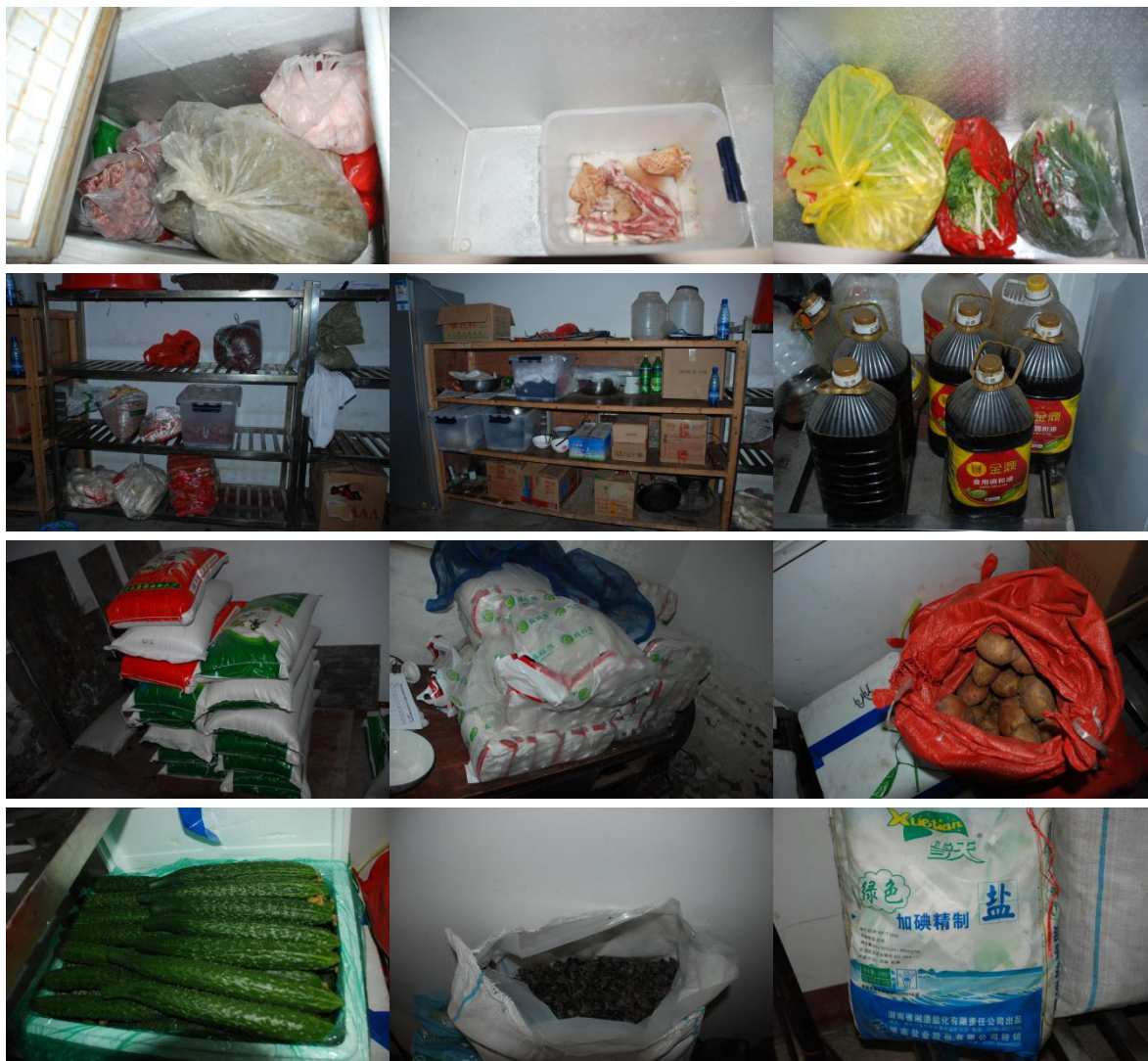
图 6 食材储存情况组图