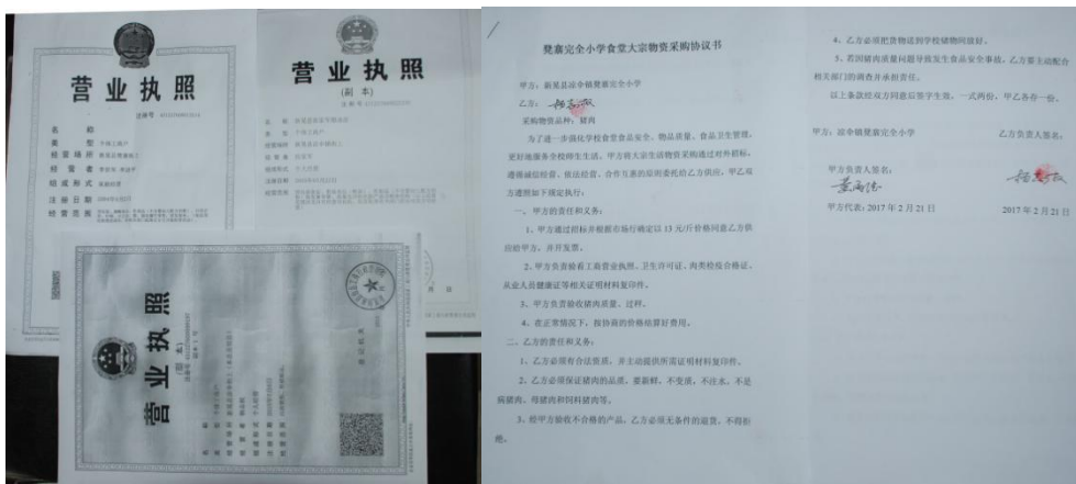
图 20 供应商档案/协议组图