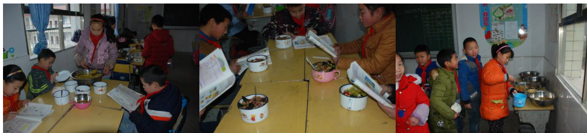
图9 学生餐具为自带、非统一保管