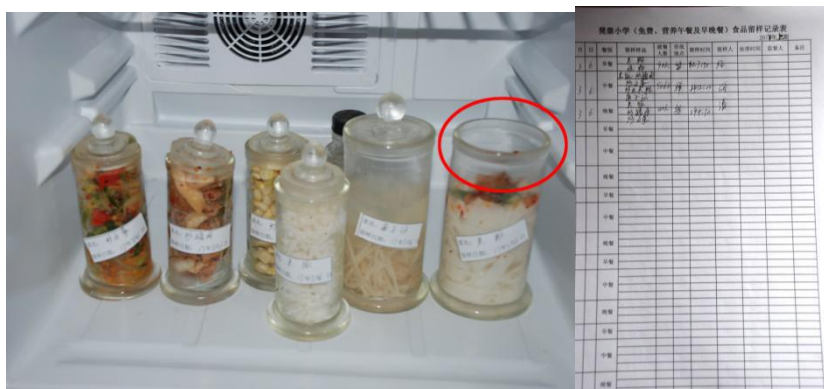
图 13 食品留样组图 (有留样没有密封)