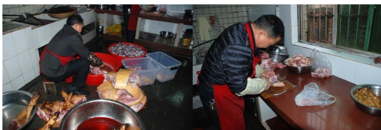
图 5 厨师未戴工作帽、围裙欠干净