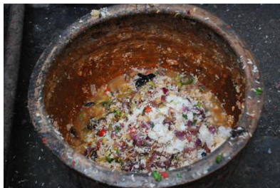
图 15 餐后剩饭菜图 (在正常范围)

新晃侗族自治县晃寨乡中心小学 3月6日 8:00 来自 360安全浏览器 用餐公示: 2017年3月3日用餐人数实到505人。菜品: 米饭、炒猪肉、炒玉米粒、炒泡菜、金针菇汤、消耗大米130斤, 猪肉70斤, 泡菜77斤, 玉米粒45斤, 芋、炒黄瓜。主要食材消耗: 大米130斤、排骨70斤、洋芋85斤、黄瓜67斤、玉大青椒10斤, 菜油8斤, 金针菇3斤, 佐料52元, 共计支出1784元。@免费午餐@兰小晚 免费午餐余额 8942.96元。 新晃侗族自治县晃寨乡中心小学 3月13日 10:50 来自 360安全浏览器 用餐公示: 2017年3月8日实到514人, 实到514人, 菜单: 排骨炖玉米棒、烧洋芋、炒黄瓜。主要食材消耗: 大米130斤、排骨70斤、洋芋85斤、黄瓜67斤、玉米棒36斤, 菜油8斤、大红椒10斤、佐料105.22元, 共计支出1943.72元。@免费午餐@兰小晚 免费午餐余额72133.82元。