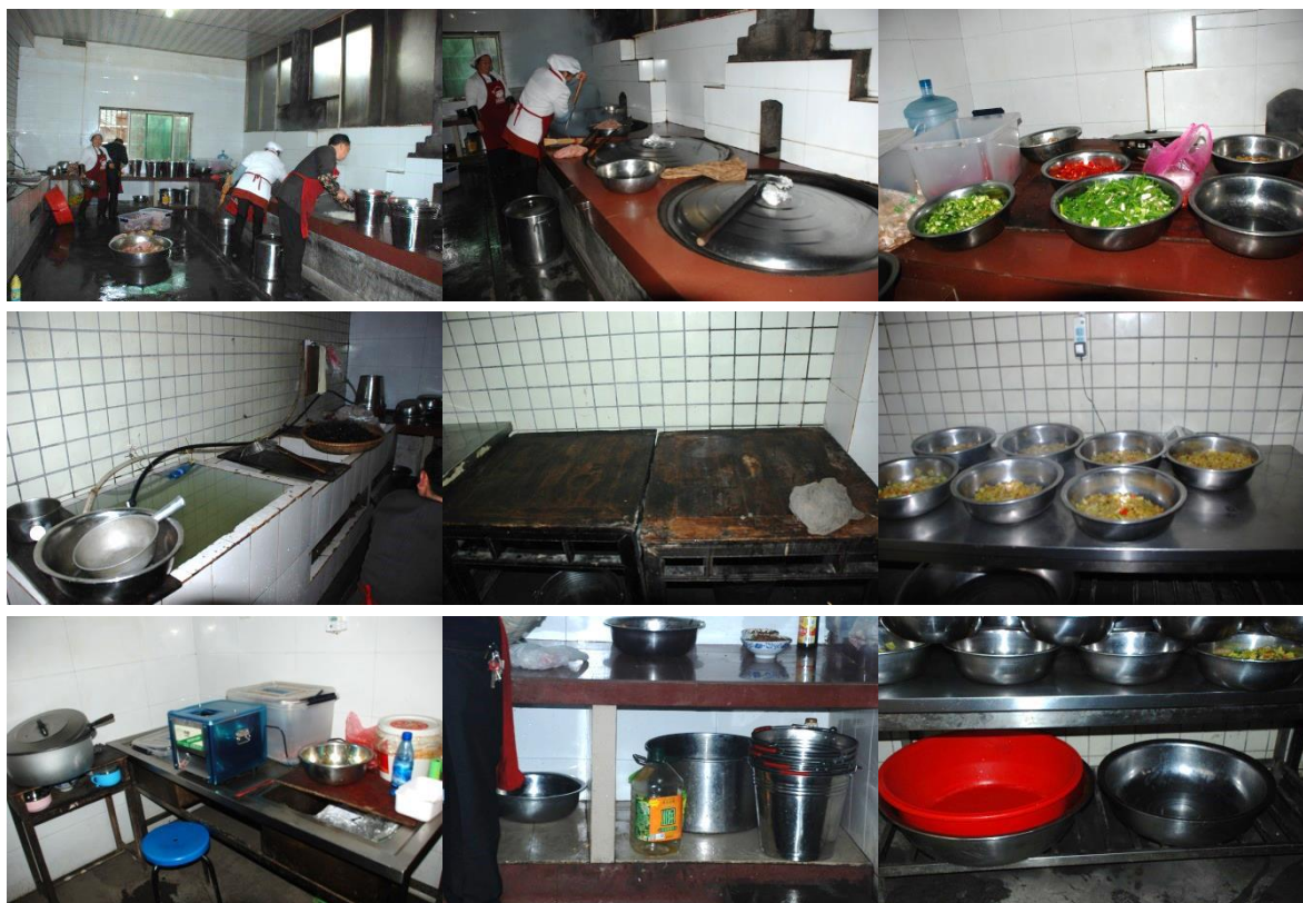
图 4 厨房、厨师情况组图