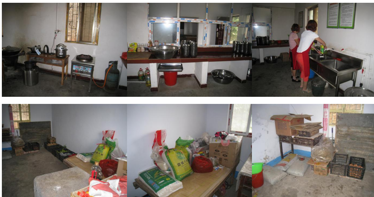
图 2 厨师、厨房卫生、食材储存情况组图