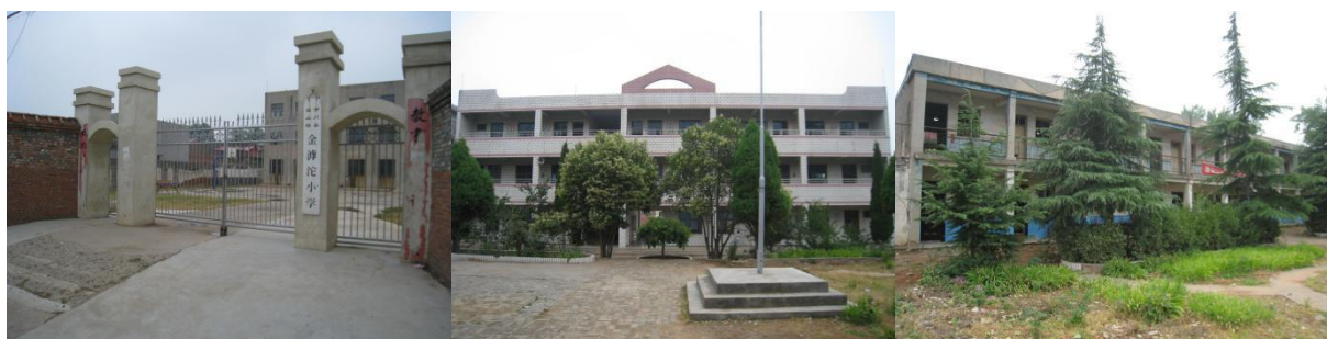
图 1 学校情况组图