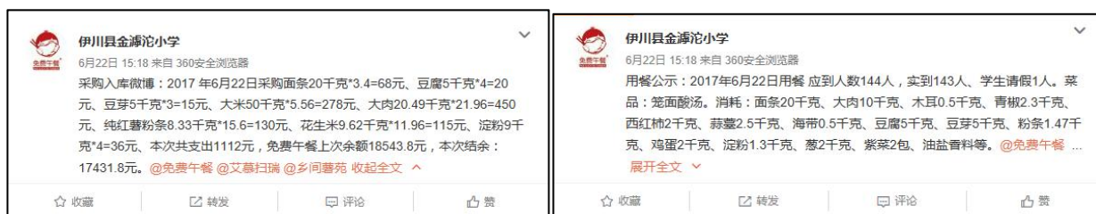
图 4 学校微博公示截图