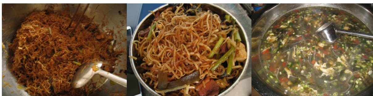
图 3 学校午餐食品情况组图