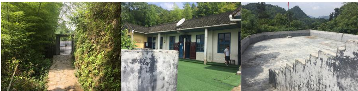
图 2 学校情况组图