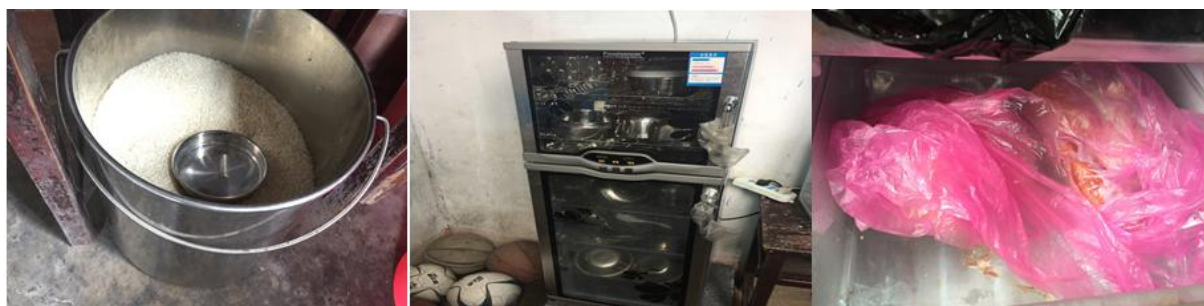
图3 厨师、厨房卫生情况组图