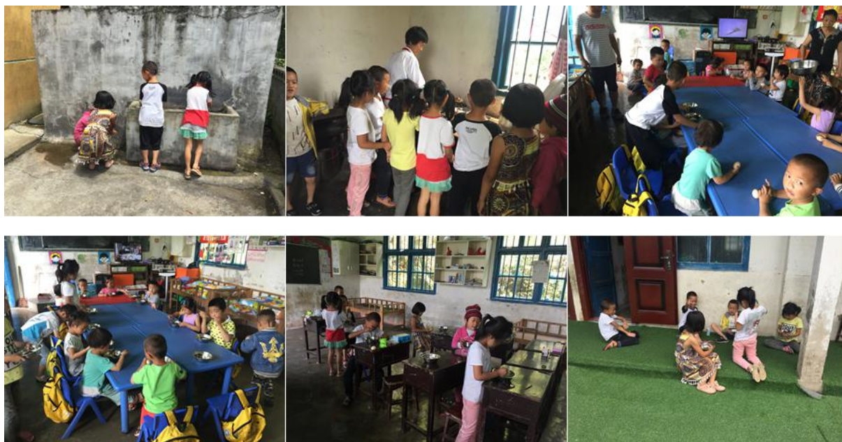
图 7 就餐情况组图