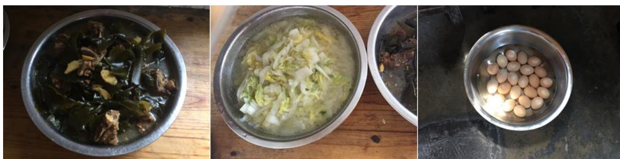
图 4 学校午餐食品情况组图