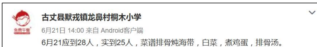
图 5 学校微博公示截图