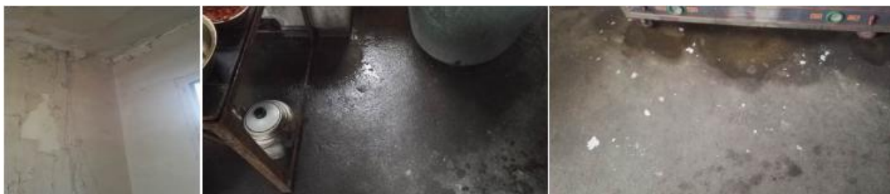
图 4 厨房墙面、地面卫生情况组图