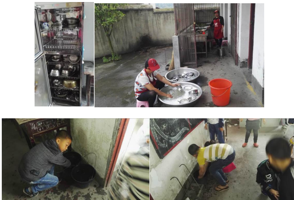
图 6 用餐卫生情况组图