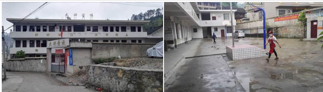
图 2 学校情况组图