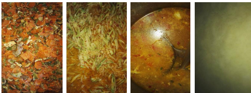
图 7 学校午餐菜品情况组图