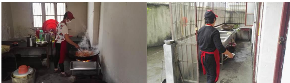
图 3 厨师卫生情况组图