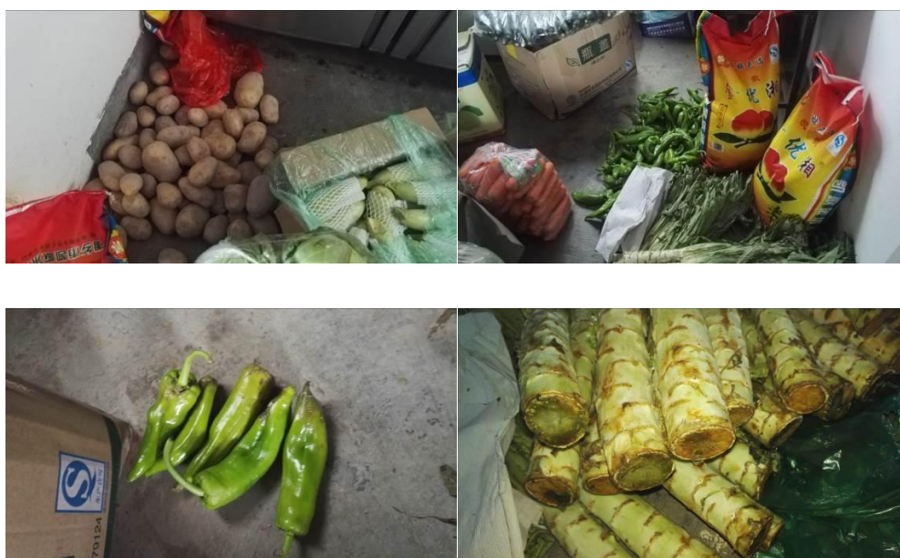
图 5 食材储存情况组图