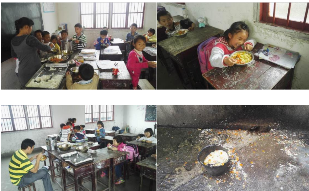
图 11 就餐情况组图