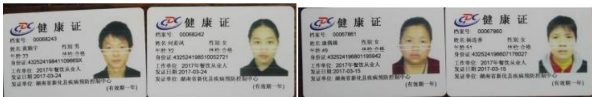
图 9 厨师健康证图