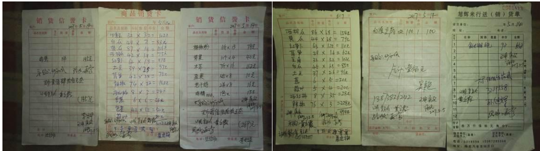
图 12 原始凭证组图