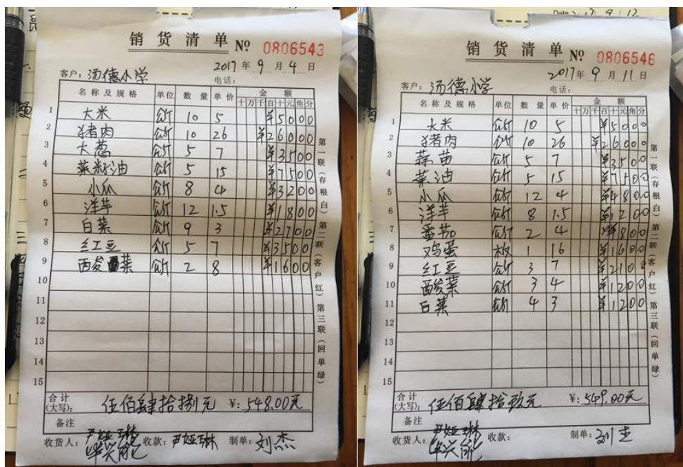
图 9 原始采购单据组图

学校每次采购一周左右的食材, 由校长及另外两位老师共同采购, 采购地点是乌东德镇, 采购完校长开车运回学校。