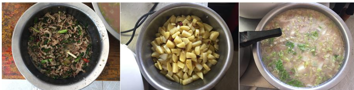
图 4 学校午餐食品情况组图