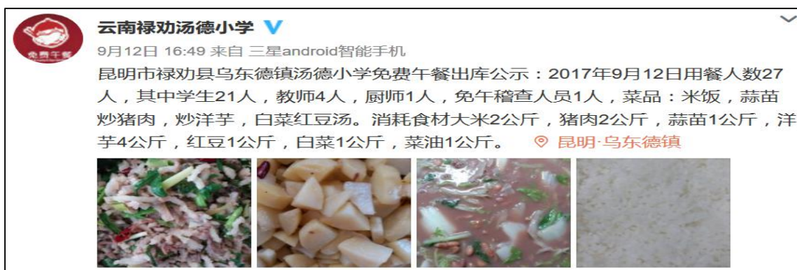
图 5 学校微博公示截图