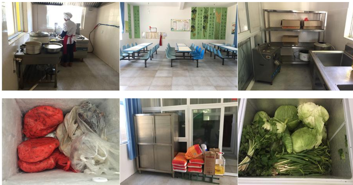
图3 厨师、厨房卫生及储藏间情况组图