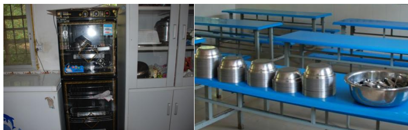
图 6 学生餐具消毒情况图（学生餐具正常消毒）