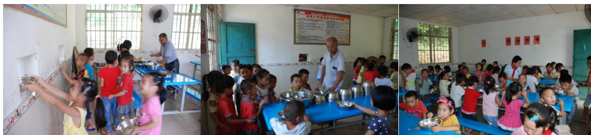
图 11 就餐情况组图（排队有序就餐）