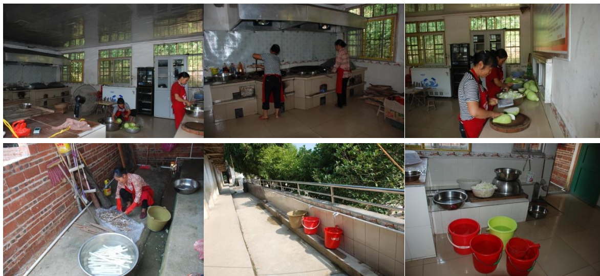
图 4 厨房、厨师卫生情况组图