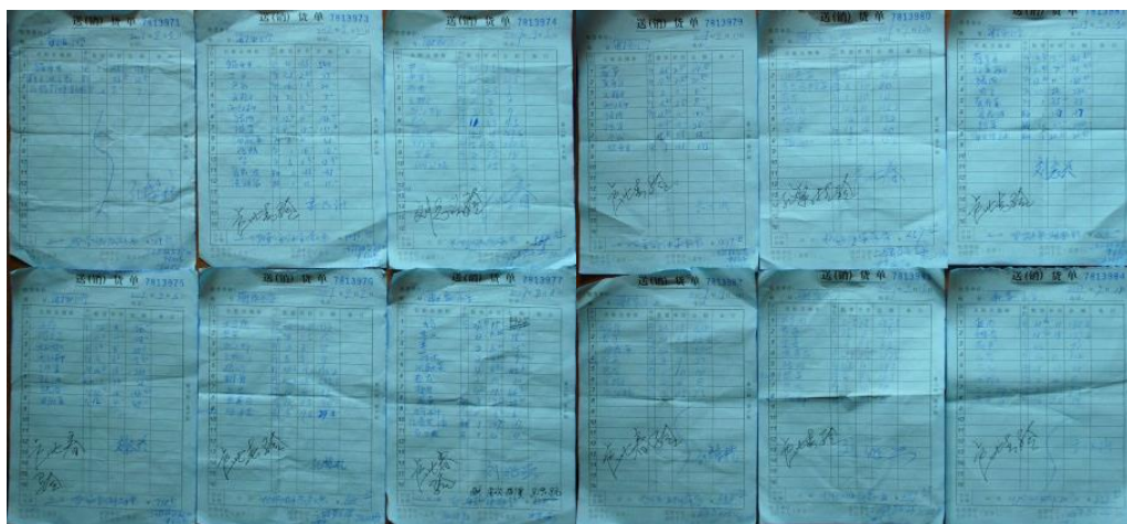
图 12 原始凭证组图