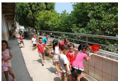
图 7 学生餐前洗手情况组图（大部分学生餐前没有洗手）