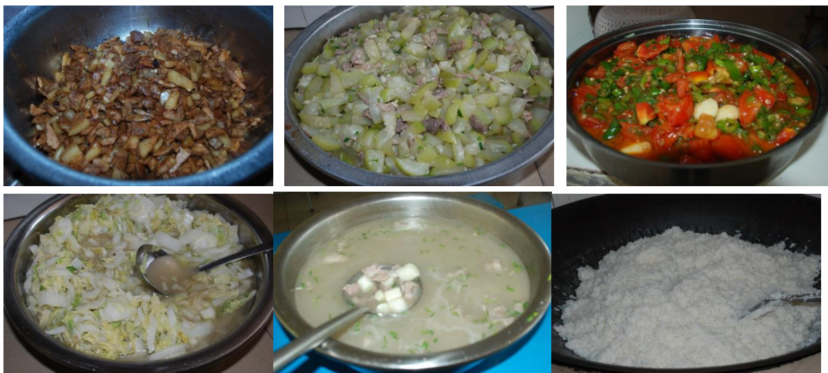
图 8 学校午餐食品情况组图（调查当天食品丰富充足，无异味、无异物、口感良好） （菜品：红烧肉片，瘦肉煮葫芦，西红柿炒元椒，炒黄芽白，排骨山药葱花汤，主食：米饭）