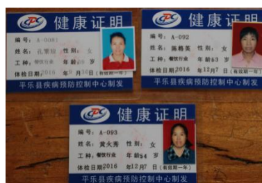
图 9 厨师健康证图（在有效期内）