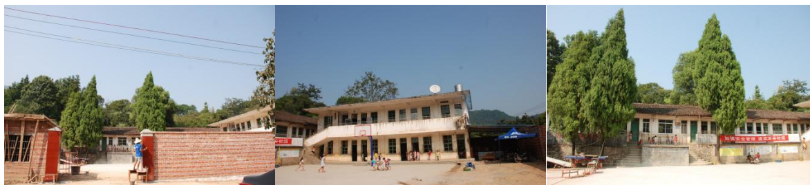
图 1 学校外观环境组图