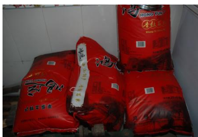
图 5 食材储存情况组图