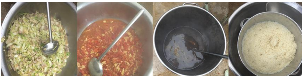
图 5 学校午餐食品情况图