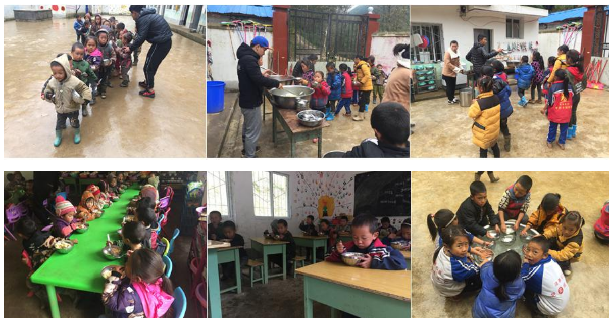
图 10 就餐情况组图