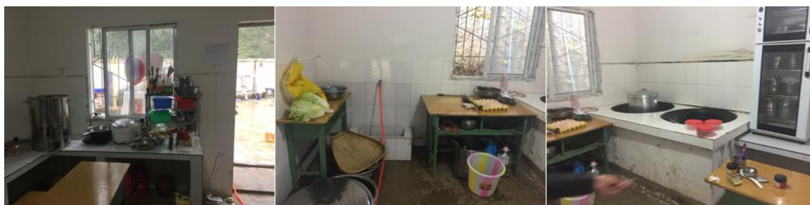
图 4 厨师、厨房卫生组图