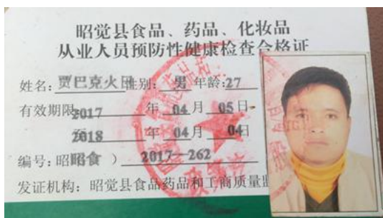
图 8 厨师健康证图