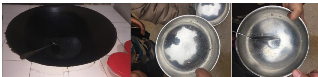
图 6 炒菜锅图