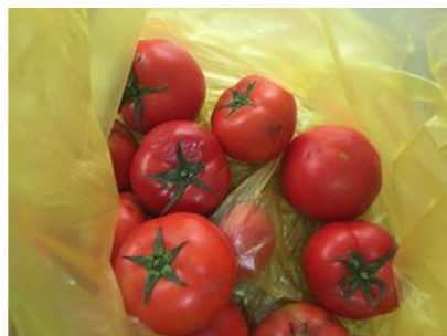
图 3 腐烂的西红柿图

经综合评估, 库依乡以子村小学免费午餐项目执行最终评分百分制总分 63.4 分。