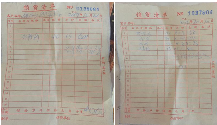
图 11 原始采购单组图