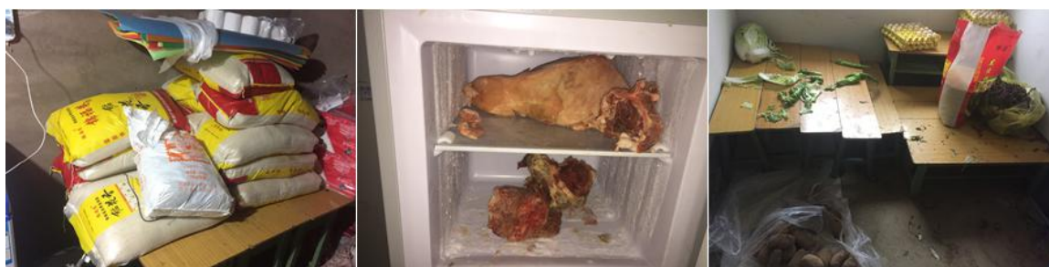
图 5 储藏间组图