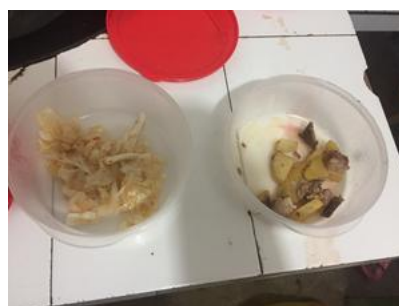
图 9 学校留样情况图