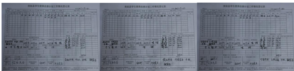
图 12 入、出库账组图（账目只登记到 9 月 18 日）