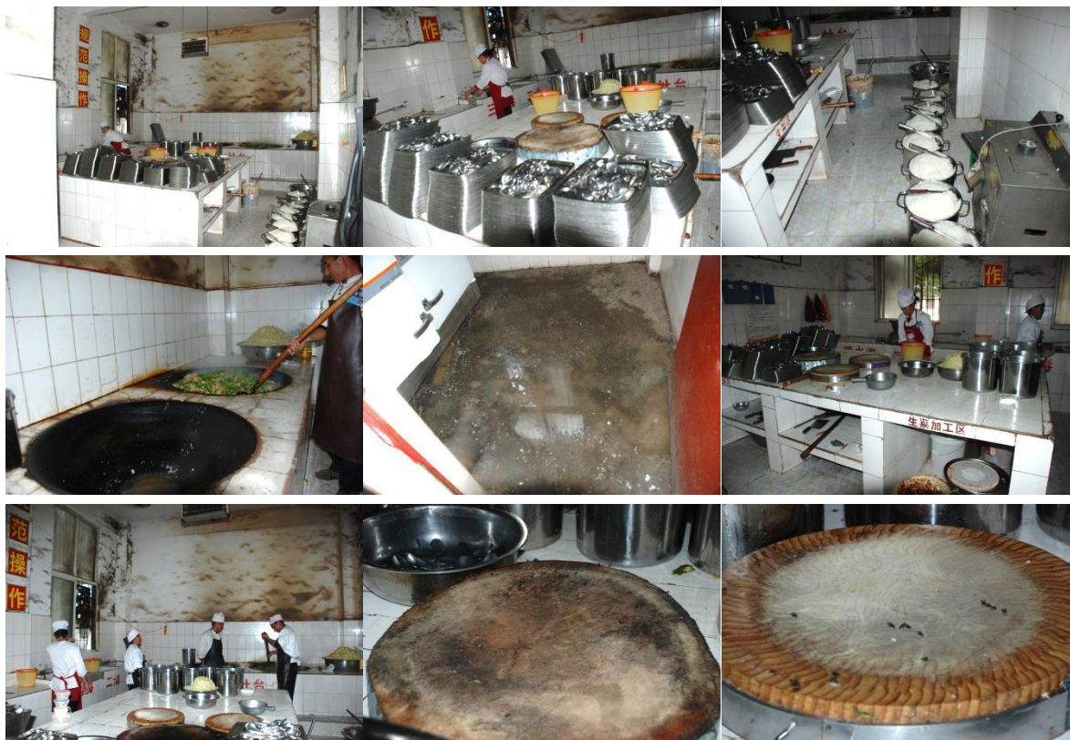
图3 厨房、厨师卫生情况组图