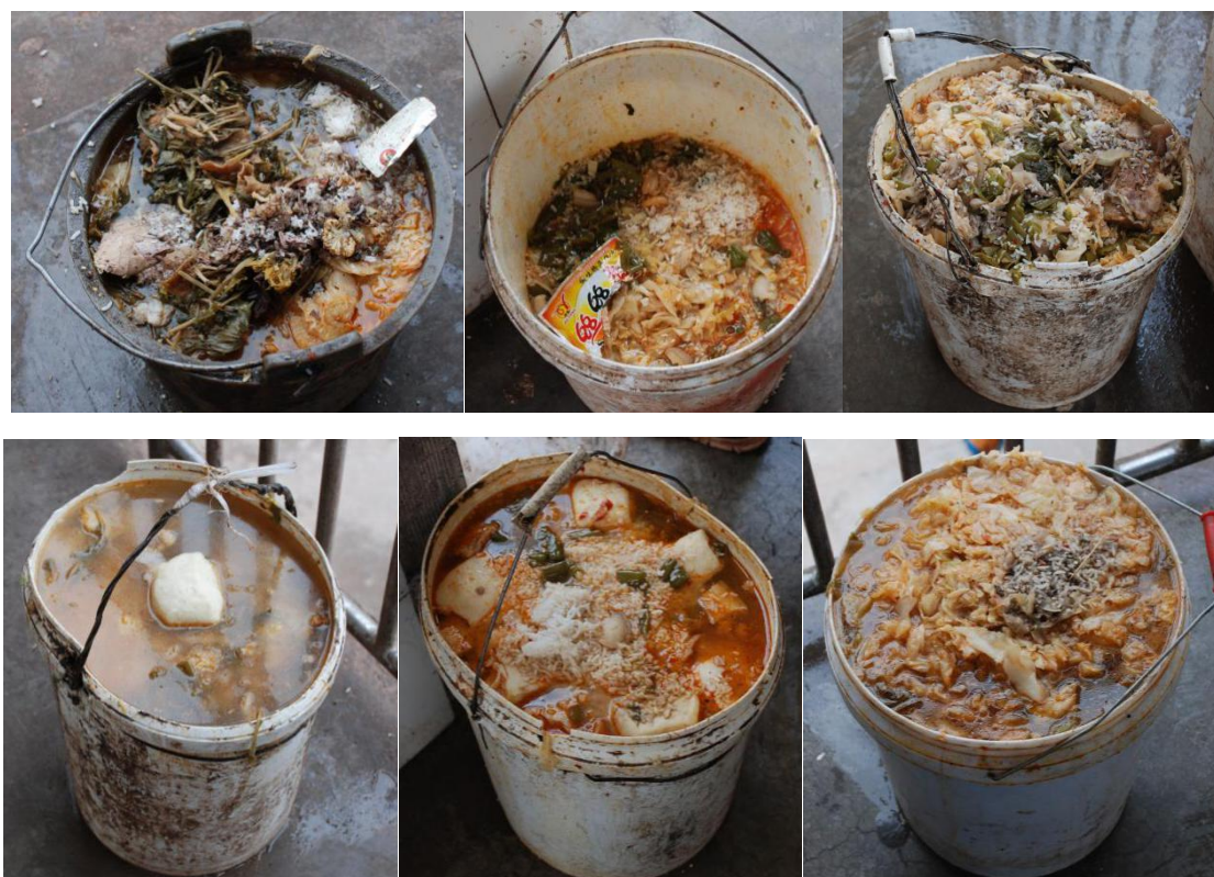
图 10 餐余图（头天晚餐及当天早、午餐的餐余，浪费严重）