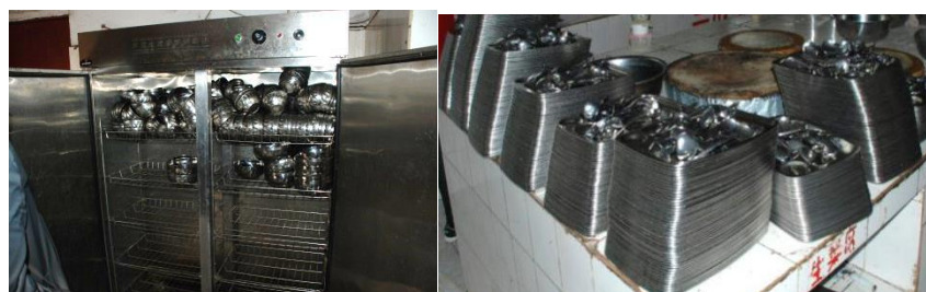
图5 学生餐具消毒情况图