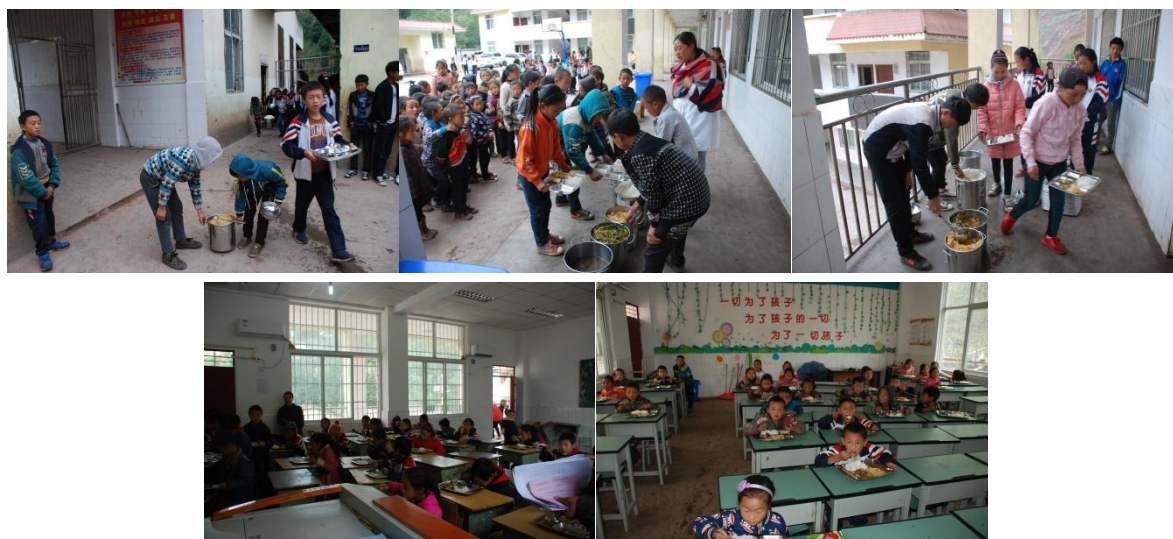
图 9 就餐情况组图（分班有序就餐）