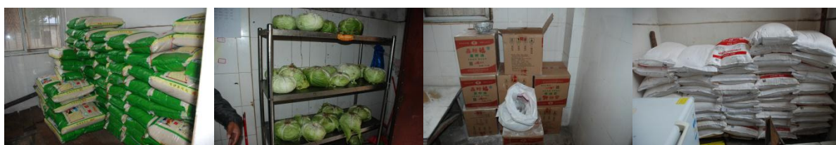
图4 食材储存情况图