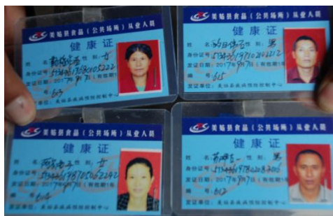
图 7 厨师健康证图 (在有效期内)