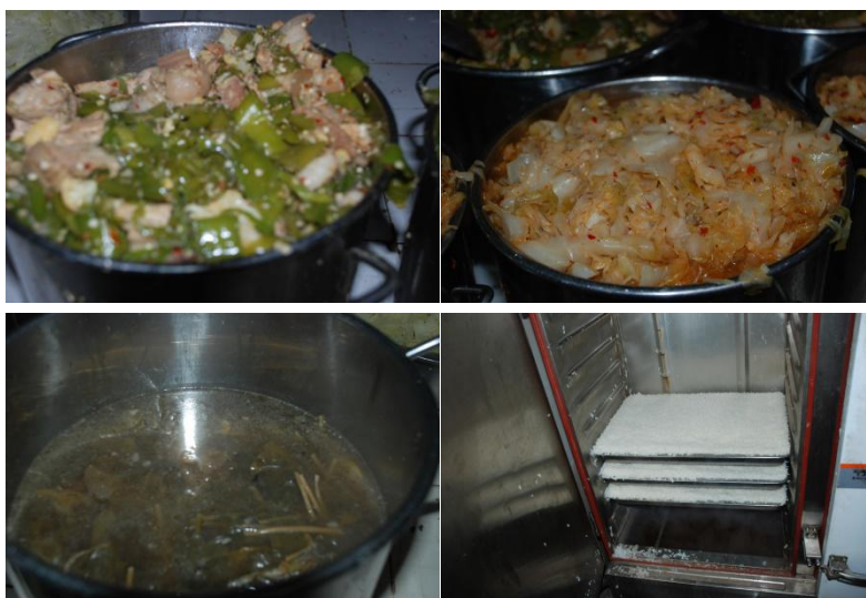
图6 学校午餐食品情况组图(调查当天食品充足,无异味、无异物、口感一般) (调查当天食品:青椒炒肉,炒包菜,酸菜汤,主食:米饭)