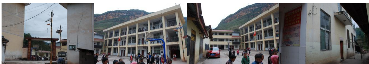
图 1 学校外观环境组图