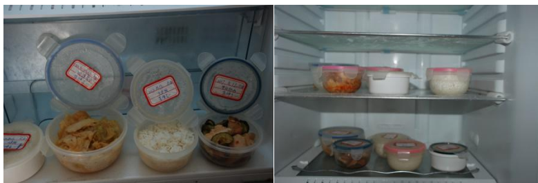
图 8 食品留样组图 (留样不合规范)