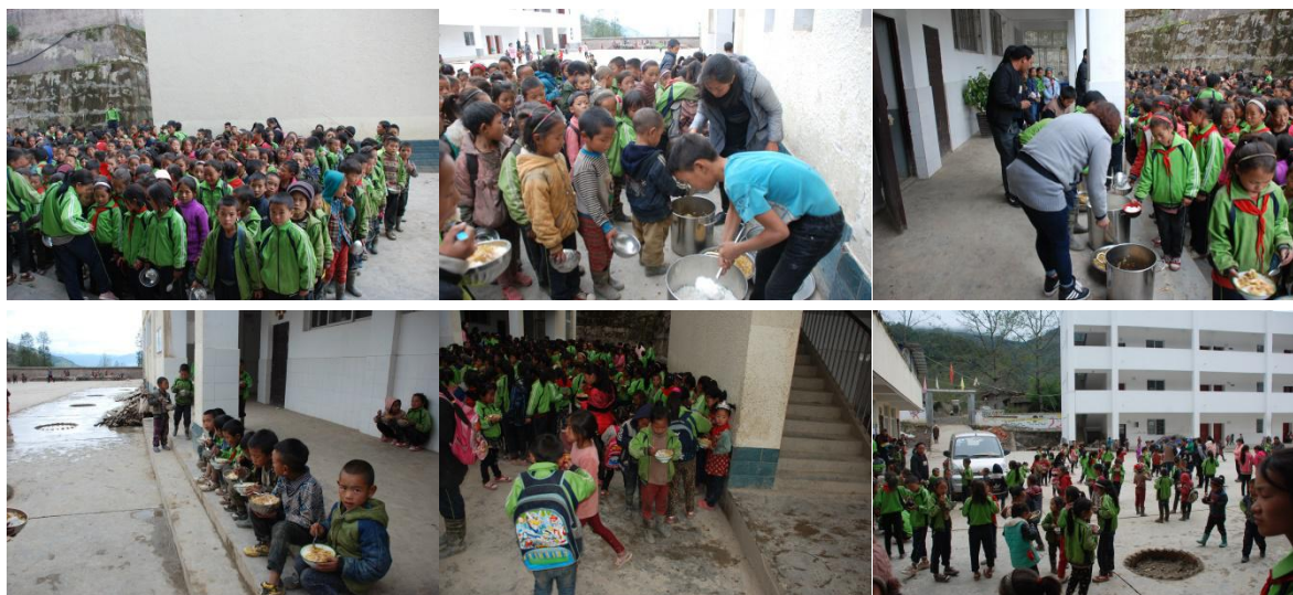
图 10 就餐情况组图 (分班有序就餐)