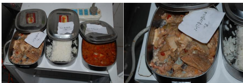
图 9 食品留样组图 (留样不合规)