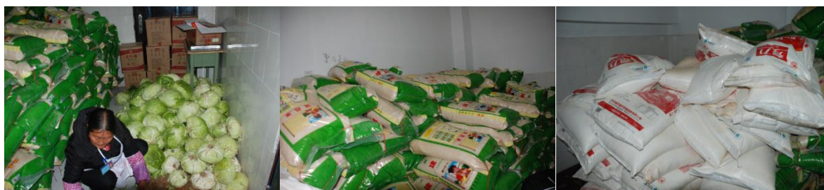
图 5 食材储存情况图