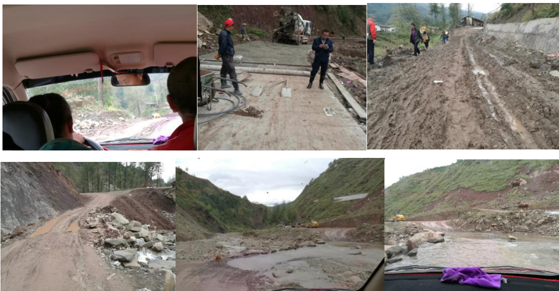
图 1 去往学校的路况非常复杂（分段修路）