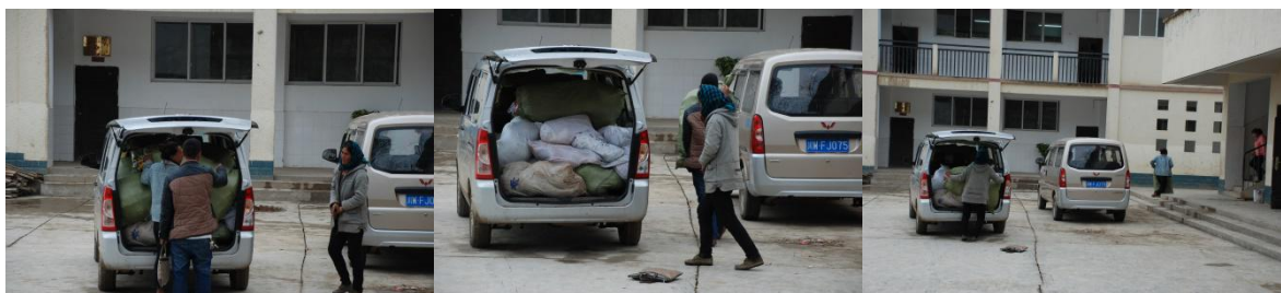
图 13 采购食材回校, 搬运到库