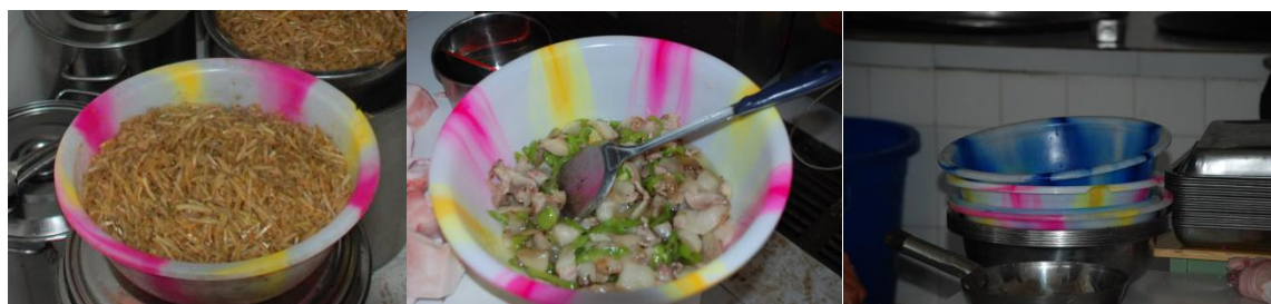
图 16 公用不锈钢菜盆不够, 还有塑料菜盆