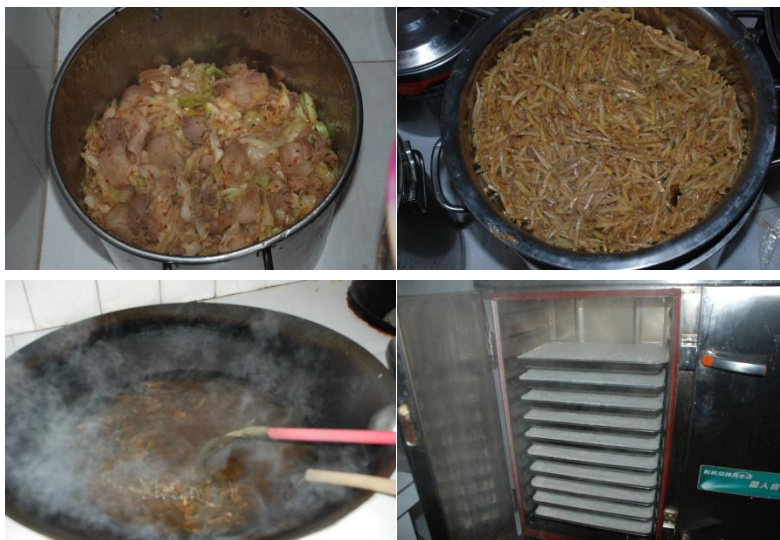
图 7 学校午餐食品情况组图 (调查当天食品充足, 无异味、无异物、口感一般) (调查当天食品: 包菜炒肉, 炒土豆丝, 酸菜汤, 主食: 米饭)