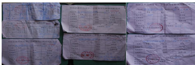
图 14 原始凭证组图