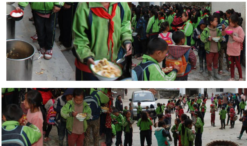
图 17 学生餐具不统一情况图