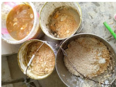
图 12 餐余图 (有明显浪费)