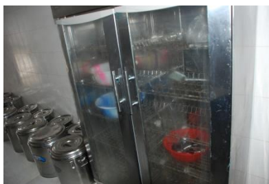
图 6 炊具消毒情况图 (学生餐具由学生自行管理, 没有消毒)