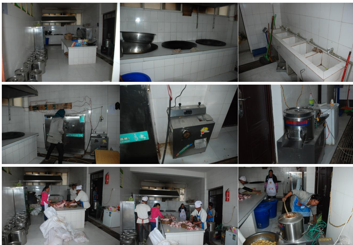
图 4 厨房、厨师卫生情况组图