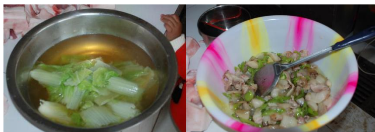
图 11 部分老师另外做菜菜品组图