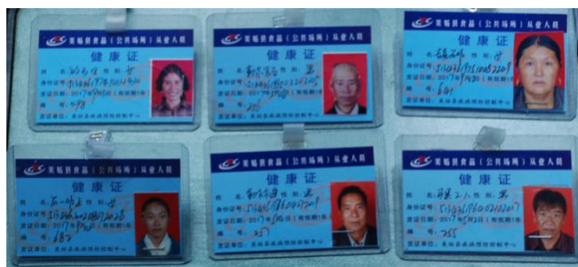
图 8 厨师健康证图 (在有效期内)