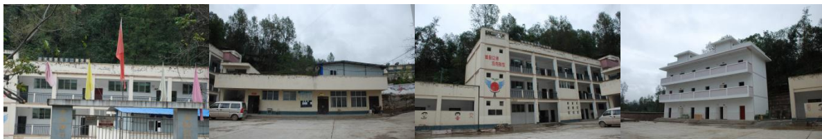
图 2 学校外观环境组图

一村一幼幼儿有两个班已搬进学校两周了，教育局已下达本学期九、十月份牛奶及饼干的指标，所以幼儿暂时没有在校用餐。据校方称因修路交通不便，教育局至今未把牛奶及饼干发放给幼儿用餐，午餐时，幼儿只能眼睁睁的饿着肚子看着哥哥姐姐吃饭。