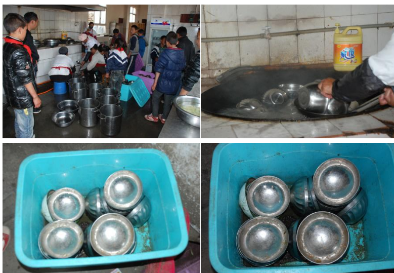
图 4 消毒情况图