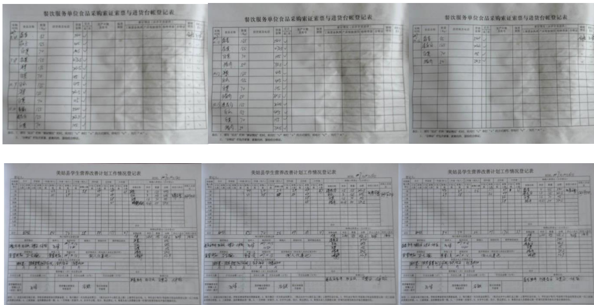
图 11 入库、出库账组图