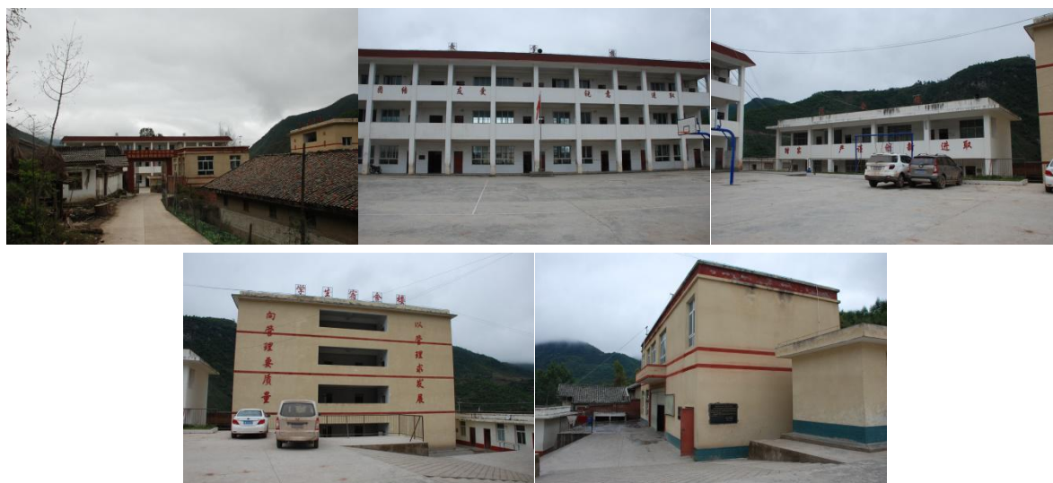
图 1 学校外观环境组图