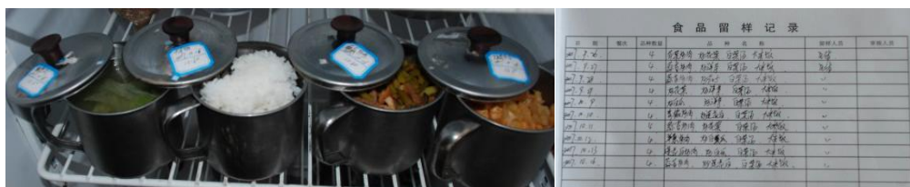
图7 食品留样组图 (留样合规范)