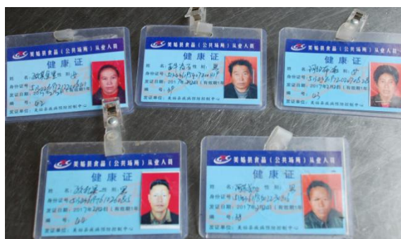
图6 厨师健康证图 (在有效期内)