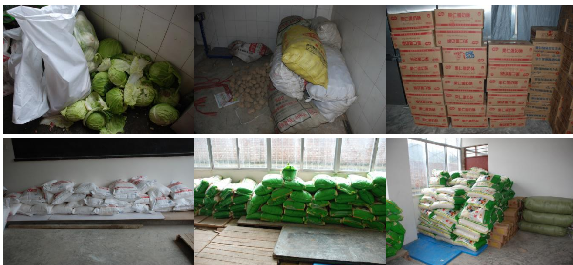
图 3 食材储存情况图