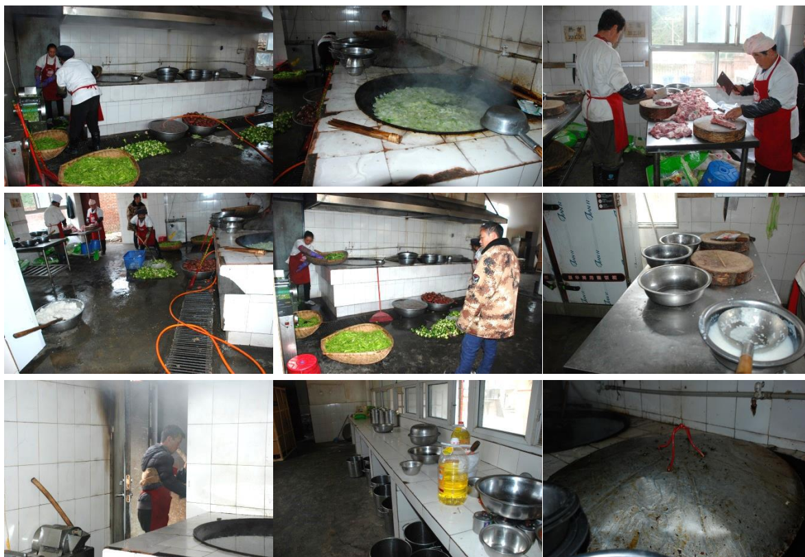
图 2 厨房、厨师卫生情况组图 (厨房卫生情况很差)