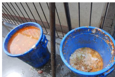
图9 餐余图 (在正常范围)