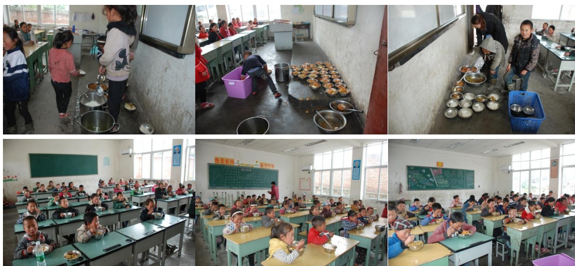
图8 就餐情况组图 (分班有序就餐)