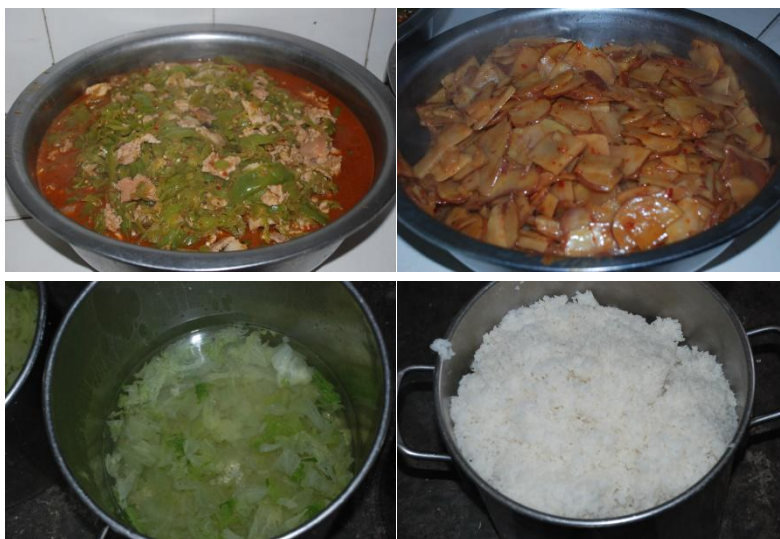
图 5 学校午餐食品情况组图 (调查当天食品充足, 无异味、无异物、口感一般)