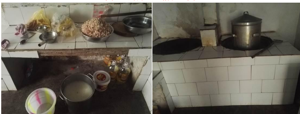
图 4 厨房卫生情况组图一