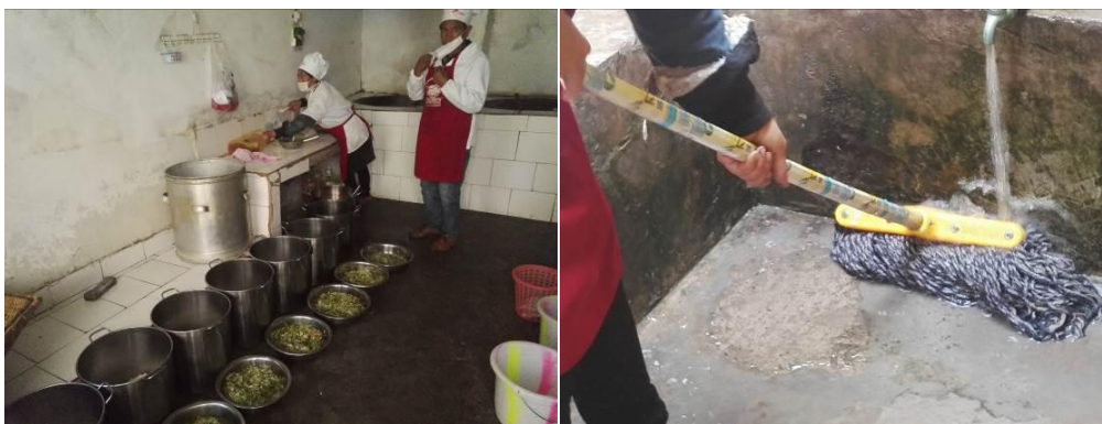
图 3 厨师卫生情况组图