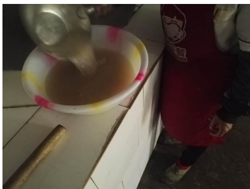
图 5 厨房卫生情况组图二