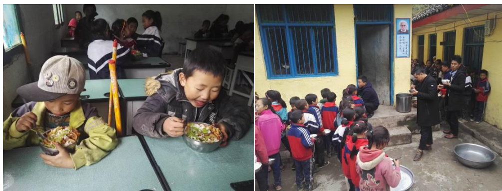
图 13 就餐情况组图