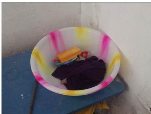
图 8 餐前学生洗手图