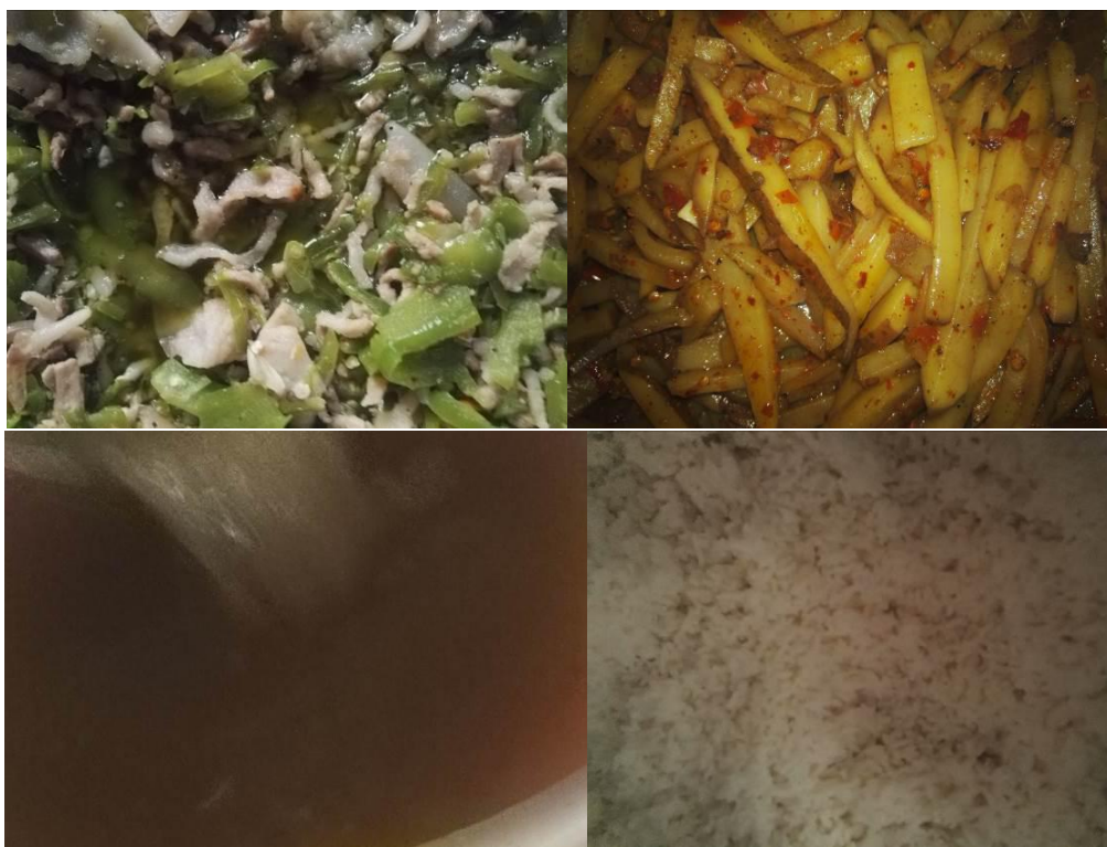
图 9 学校午餐菜品情况组图