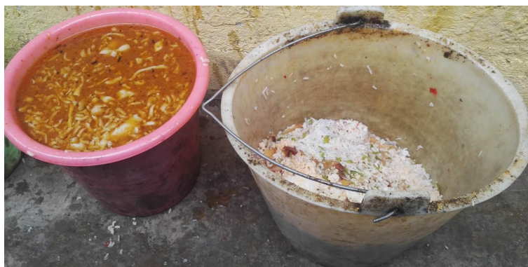
图 14 剩菜剩饭组图