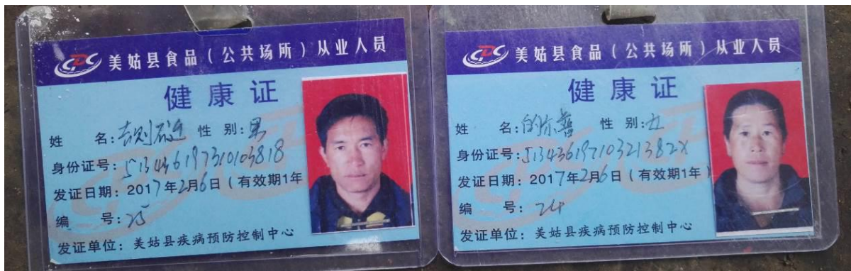
图 11 厨师健康证组图