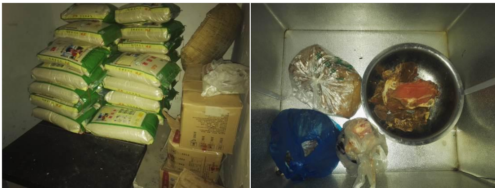
图 6 食材储存情况组图