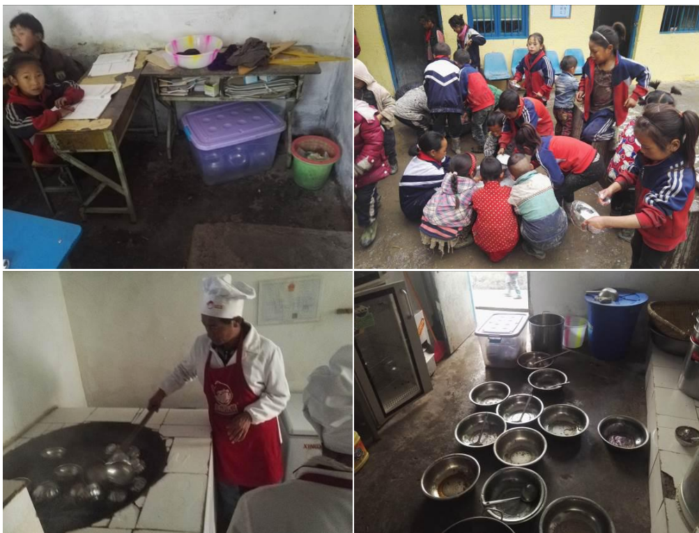
图 7 用餐卫生情况组图