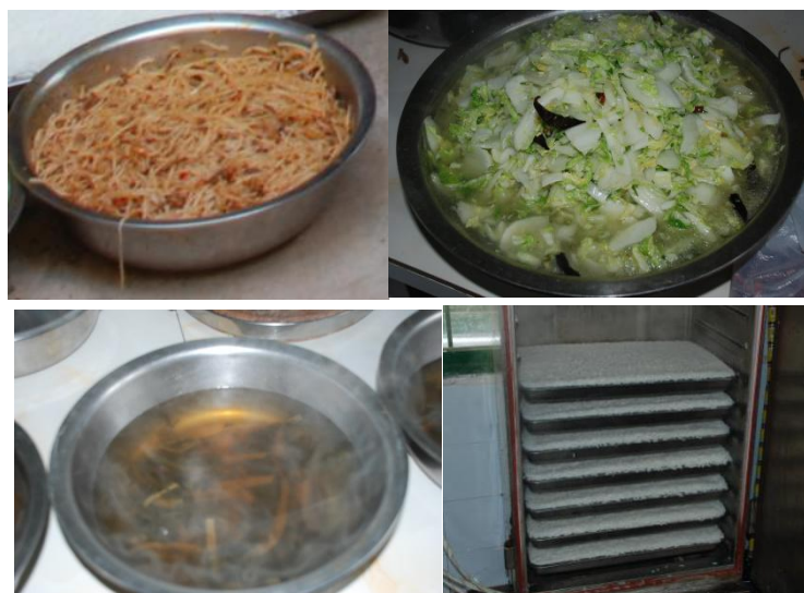
图 6 学校午餐食品情况组图 (调查当天食品充足, 无异味、无异物、口感一般) (调查当天食品: 粉丝炒肉, 炒白菜, 酸菜汤, 主食: 米饭)