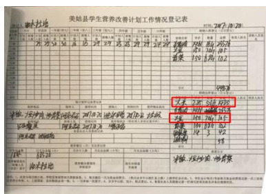
图3 调查当天学校的入、出库账图