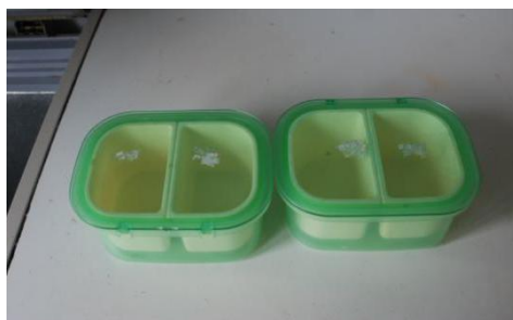
图 8 食品留样图（没有做留样）