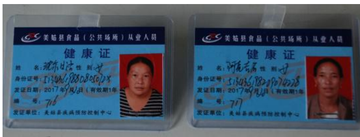
图 7 厨师健康证图（在有效期内）