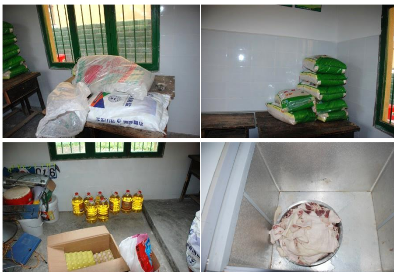
图 5 食材储存情况图