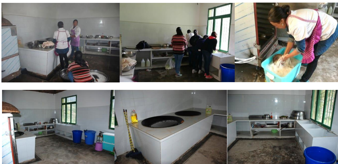
图4 厨房、厨师卫生情况组图