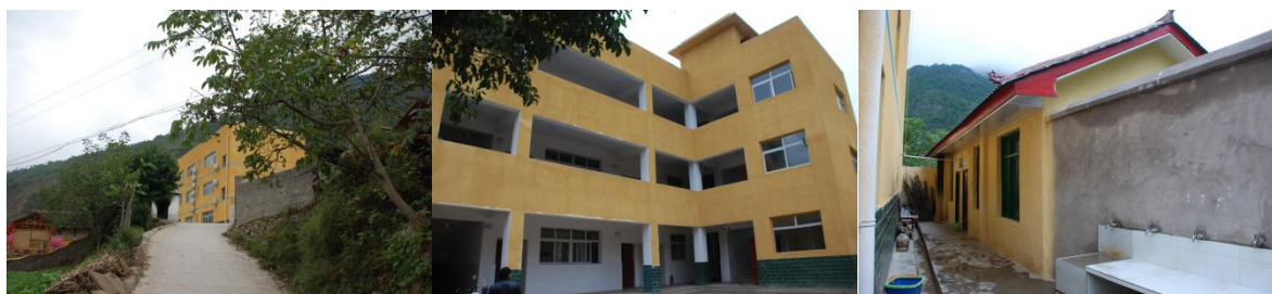
图 1 学校外观环境组图