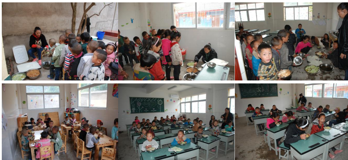
图 9 就餐情况组图（分班有序就餐）