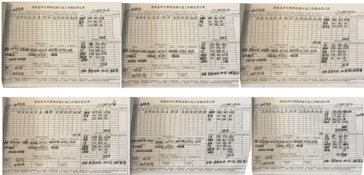
图 12 入、出库账组图