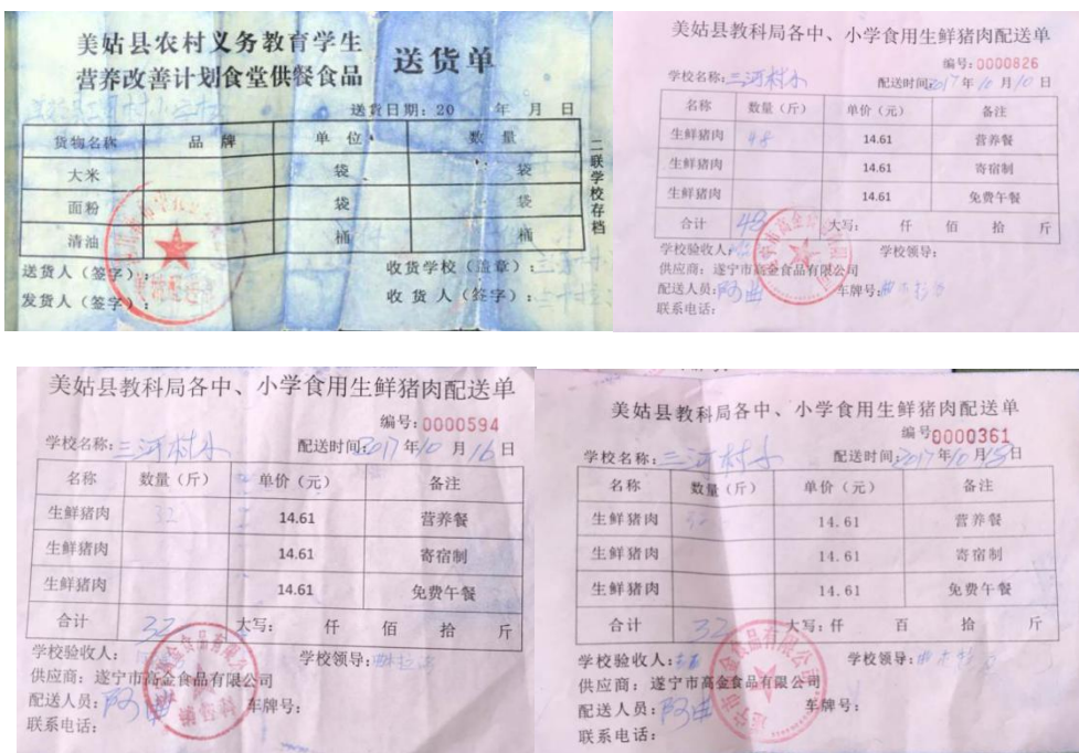
图 11 原始凭证组图