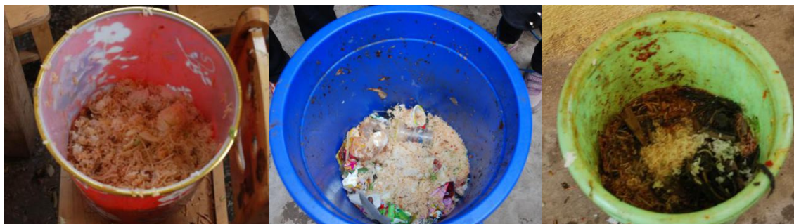
图 10 餐余图（在正常范围）