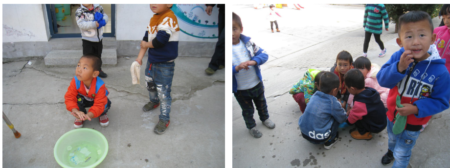
图 3 学生餐前洗手情况组图