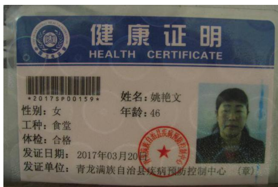
图 7 厨师健康证图