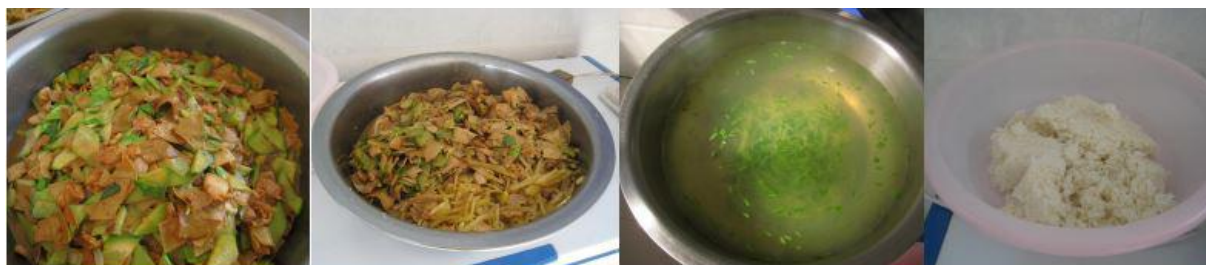
图 5 学校午餐食品情况组图