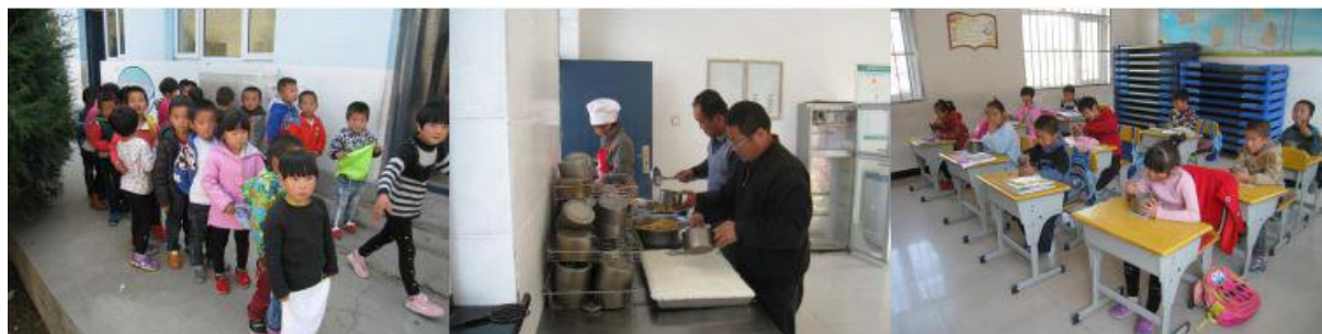
图 9 餐前排队、分餐和用餐情况组图