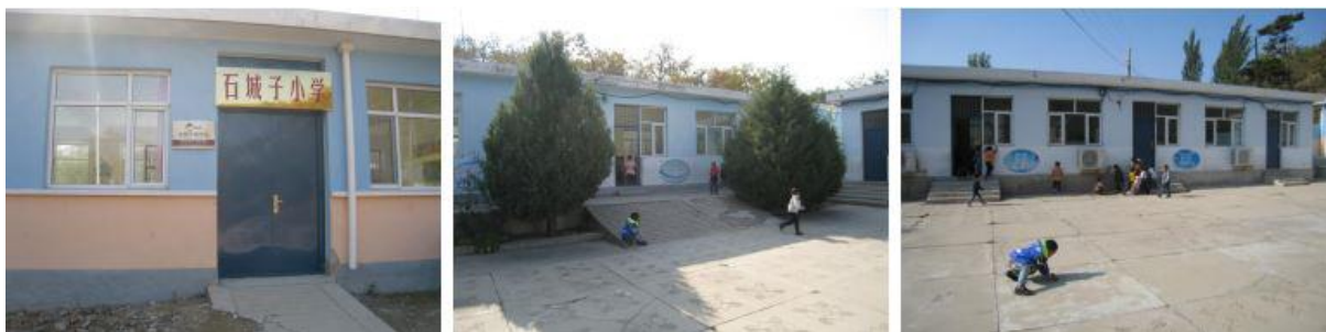
图 1 学校情况组图