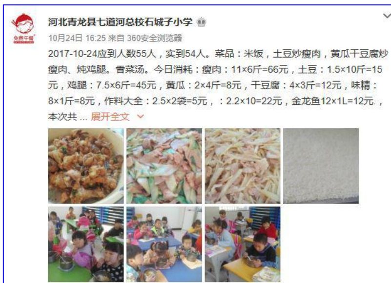
图 6 学校微博公示截图