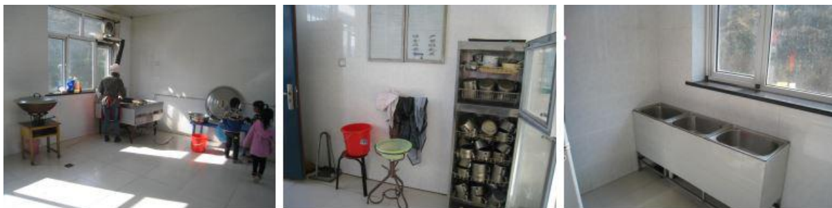
图 2 厨师、厨房卫生情况组图