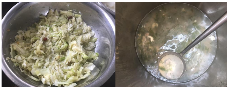
图9 稽核当日学校午餐菜品组图