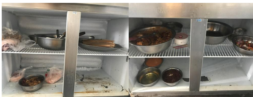
图 6 冷藏冷冻设备内部情况组图