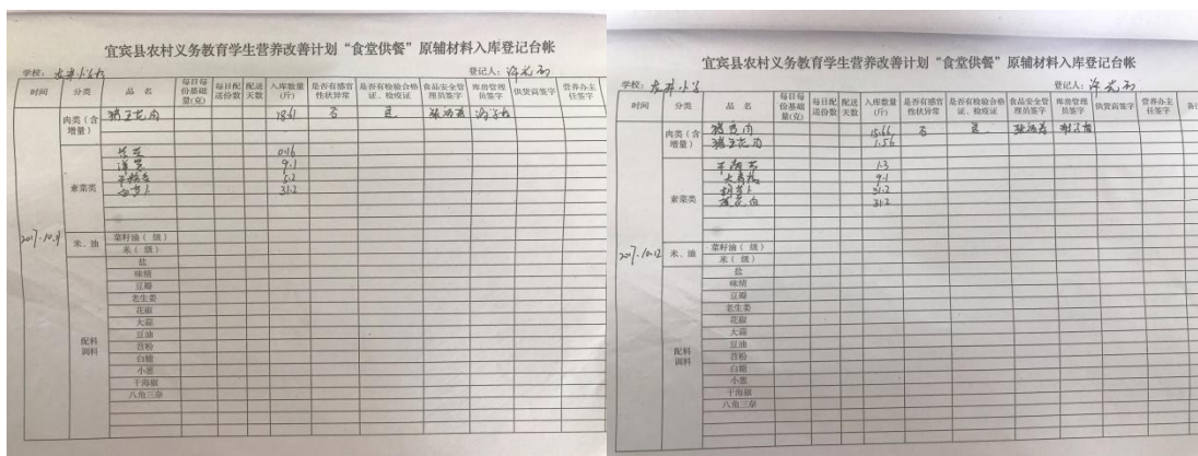
图 15 入库记录组图