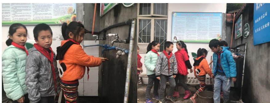
图 8 学生餐前洗手组图