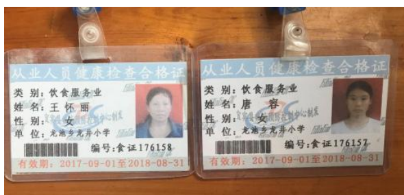
图 10 炊事员健康证图