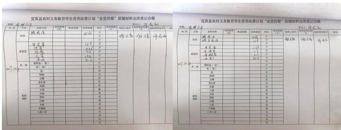
图 16 出库记录组图