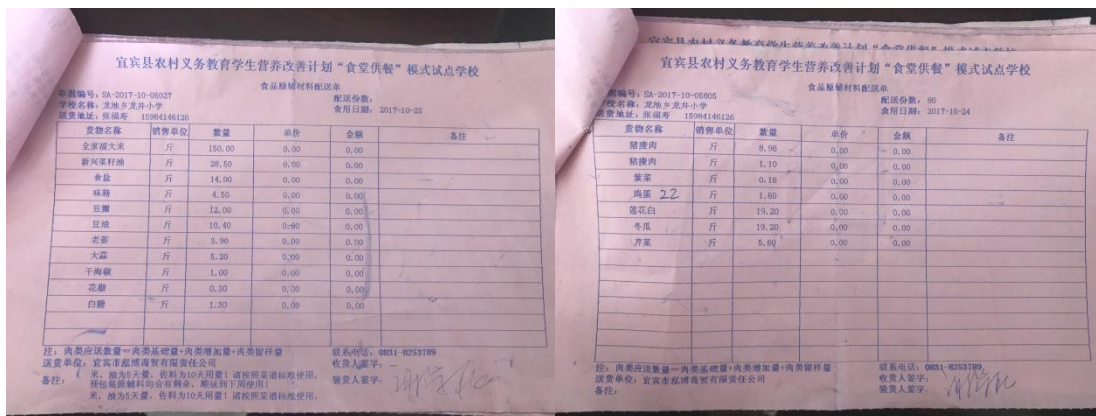
图 14 食材配送票据凭证组图