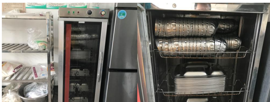
图 7 学生餐具卫生状况组图