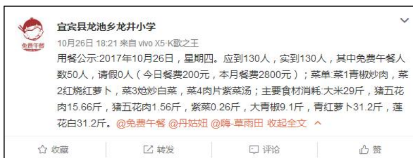
图 13 稽核当日学校微博公示截图