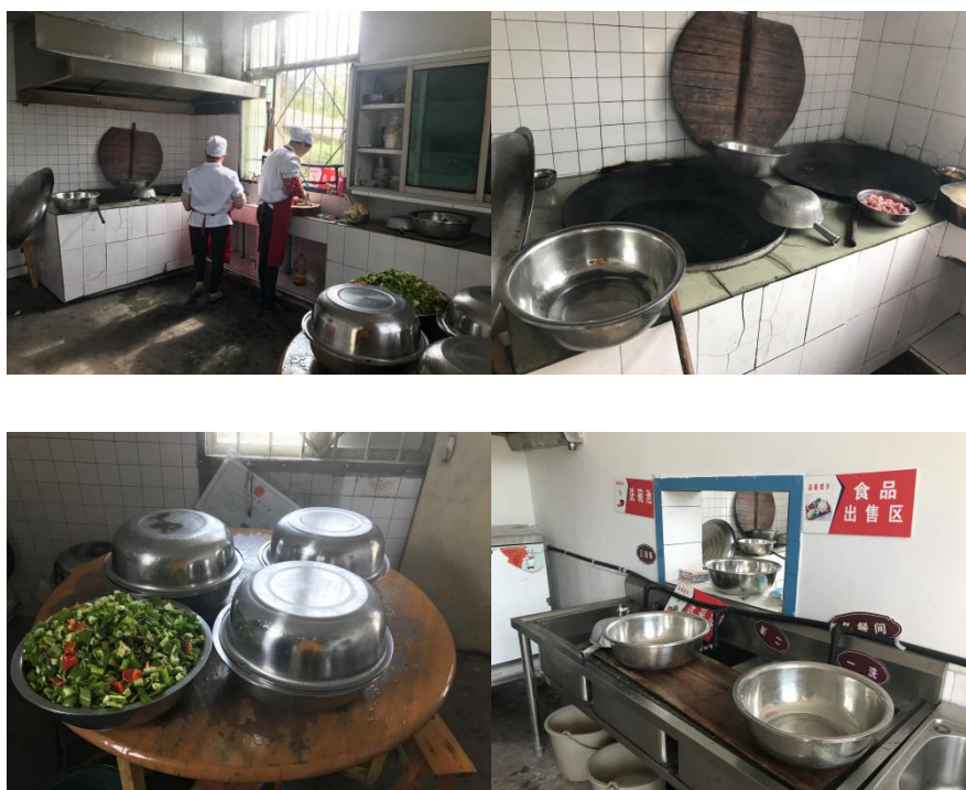
图 4 厨房整体及局部环境卫生情况组图