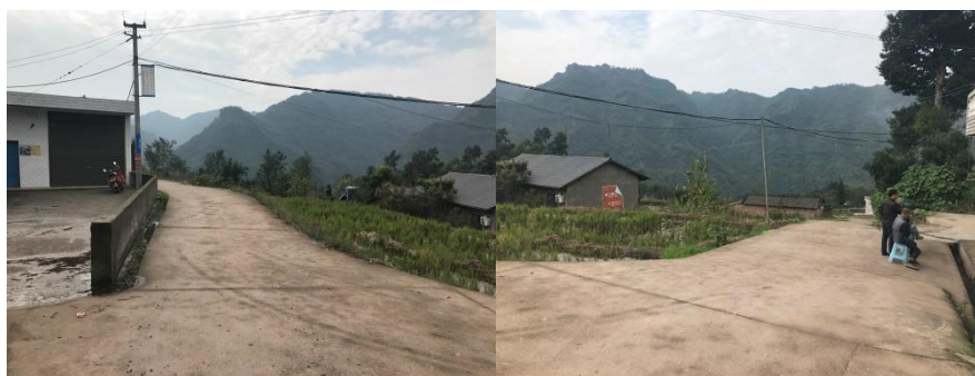
图 1 龙井小学周边路况组图

线路提示: 自宜宾市区(翠屏区)前往龙井小学可在西门客运站乘坐前往蕨溪镇的客运班车抵达蕨溪镇, 再换乘摩托车或包车前往龙井小学, 全程约3小时。自宜宾市区至蕨溪镇至龙池乡龙井小学路况良好, 交通相对方便。