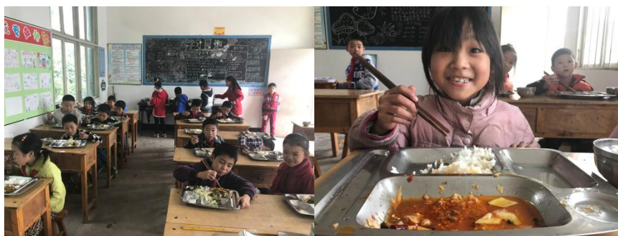
图 12 就餐情况组图