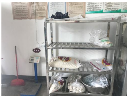
图 5 库存食材储藏情况组图