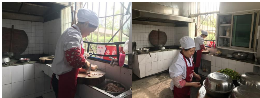
图 3 厨师着装情况组图