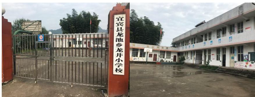
图 2 学校大门及校园环境组图