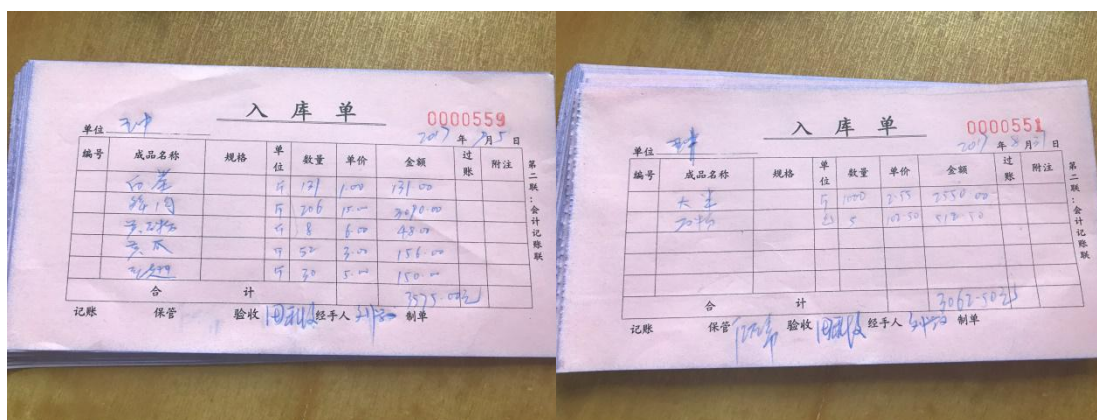
图 14 入库记录组图