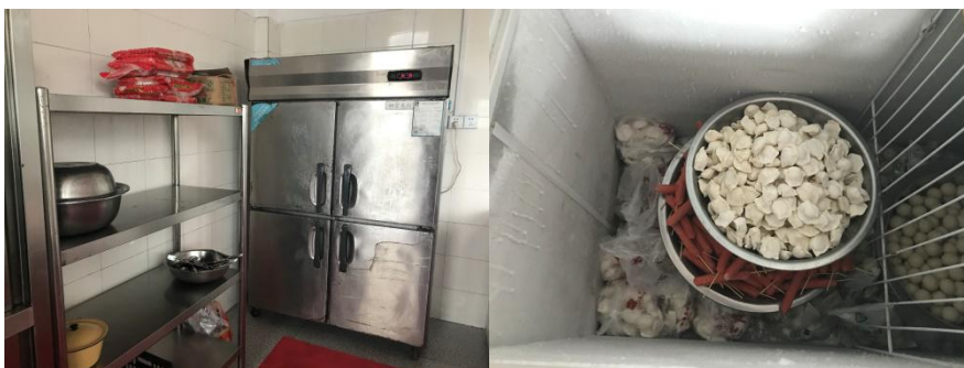
图 6 冷藏冷冻设备内部情况组图