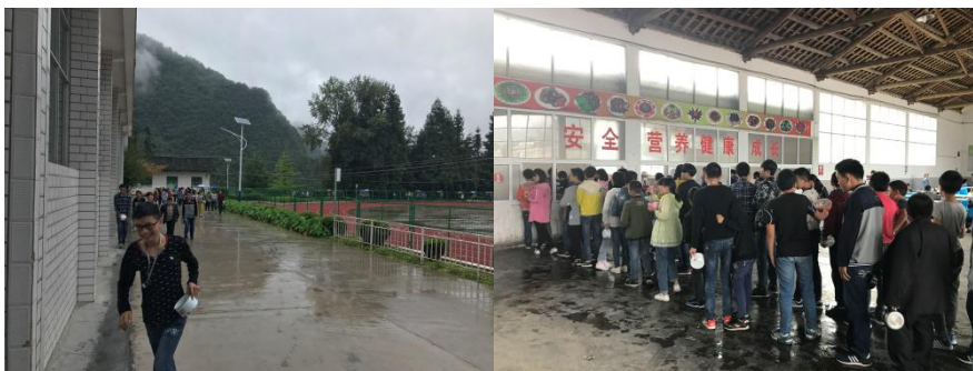
图 7 学生自带餐具就餐情况组图