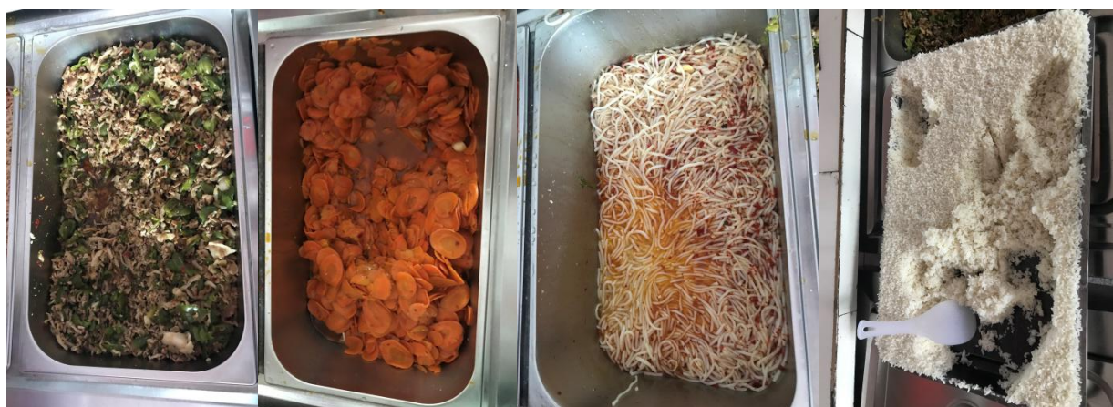
图 8 稽核当日学校午餐食品组图