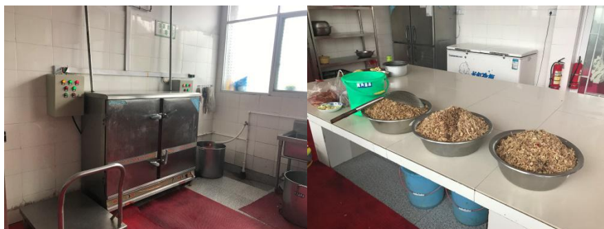
图4 厨房整体环境卫生