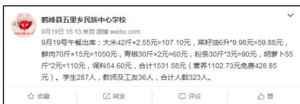
图 12 稽核当日学校微博用餐公示截图