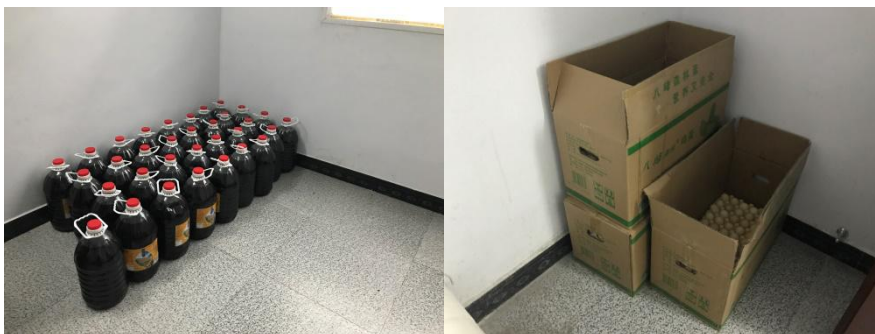
图 5 库存食材储藏情况组图