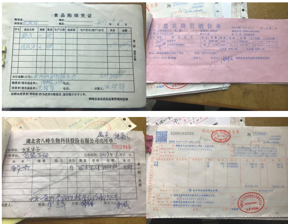
图 13 票据凭证组图