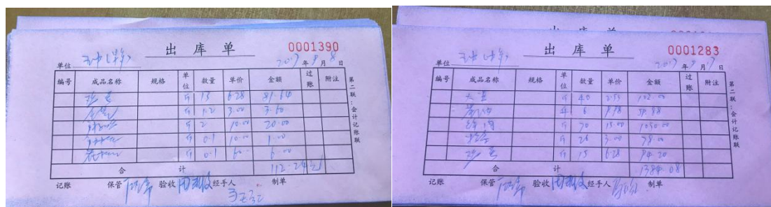
图 15 出库记录组图