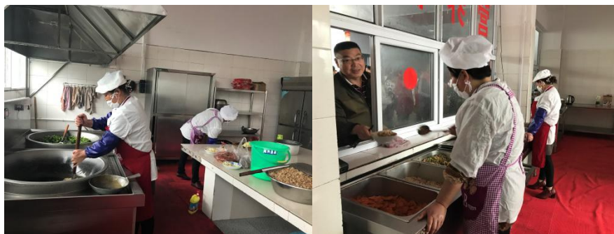
图3 厨师着装情况组图