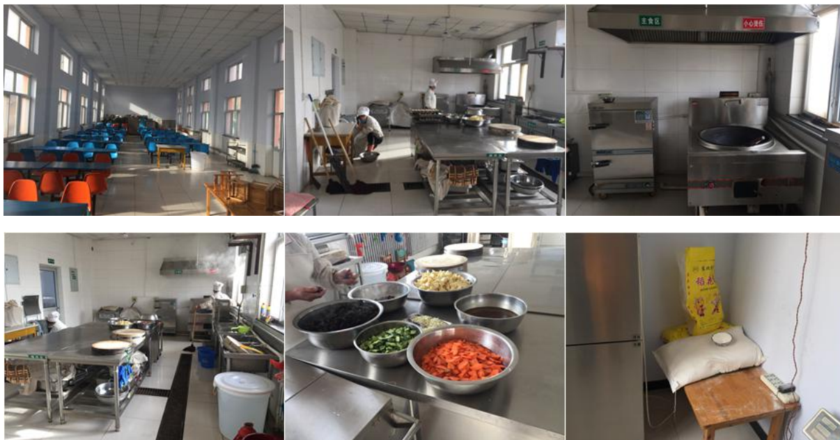
图 I-2 餐厅、厨房、厨师卫生、食材储存情况组图