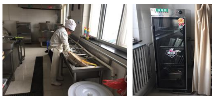
图III-3 就餐卫生情况组图（从左到右依次为餐具清洗、餐具消毒）