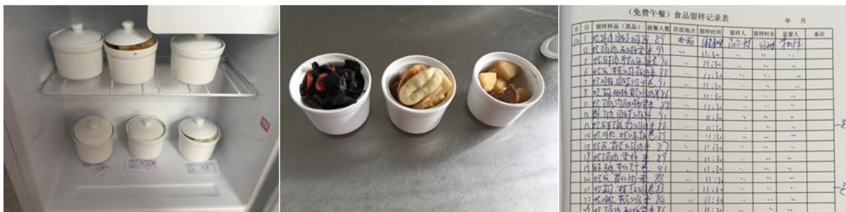
图 I-3 食品留样情况组图