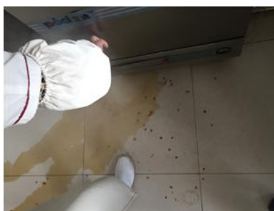
图 I-4 蒸饭车内溢出的水情况图