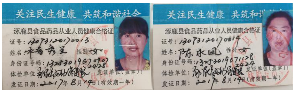
图 I-1 厨师健康证组图