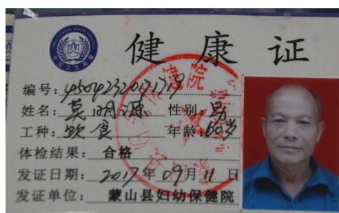
图 I -1 厨师健康证图