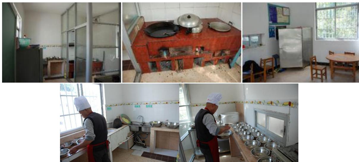
图 I -2 厨房厨师卫生情况组图