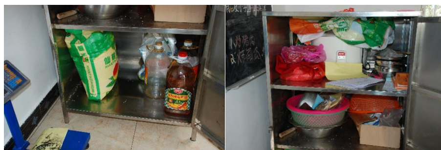
图 I -3 食材储存情况组图