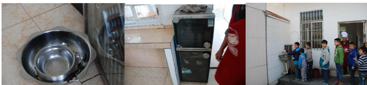
图III-3 用餐卫生情况组图