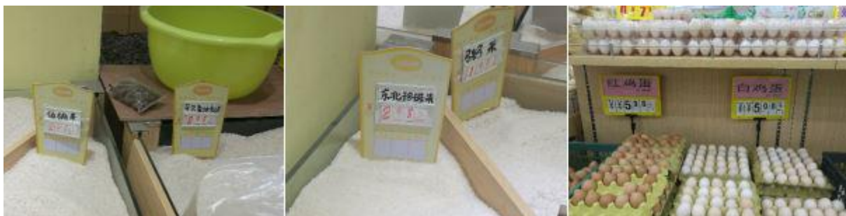
图 2 蒙山县城超市部分商品价格