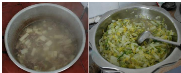
图III-1 稽核当天食品情况组图