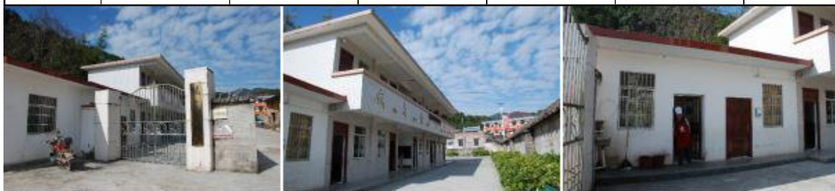
图 1 学校情况组图