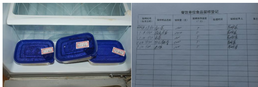
图 I -4 食品留样情况组图