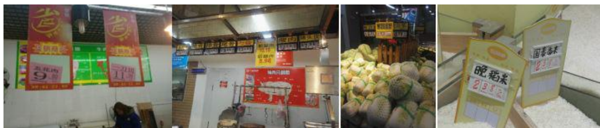
图 2 蒙山县城超市部分商品价格

该校配送公司配送的部分食材远高于当地超市零售价，另扣 20 分：县城超市的猪肉 8.98—11 元/斤，大白菜为 0.98 元/斤，晚稻米 2.38 元/斤，而统一配送给学校的猪肉价格为 14 元/斤，大白菜为 2.2 元/斤，晚籼米（二级）为 3.1 元/斤……。（见图 2、图 II-1）