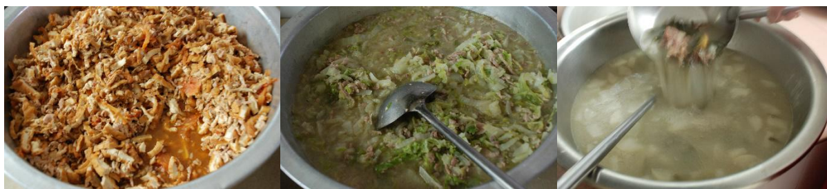
图III-1 稽核当天食品情况组图