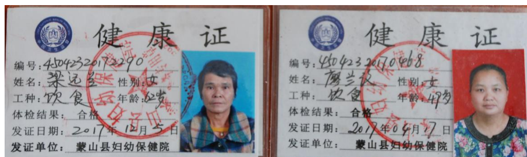
图 I-1 厨师健康证图