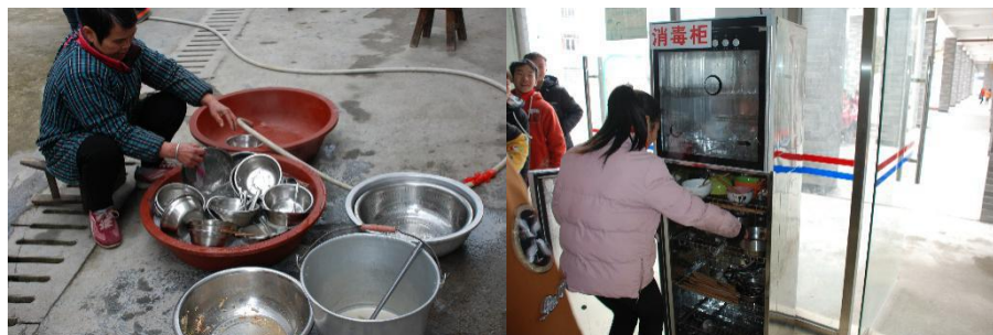
图III-3 用餐卫生情况组图