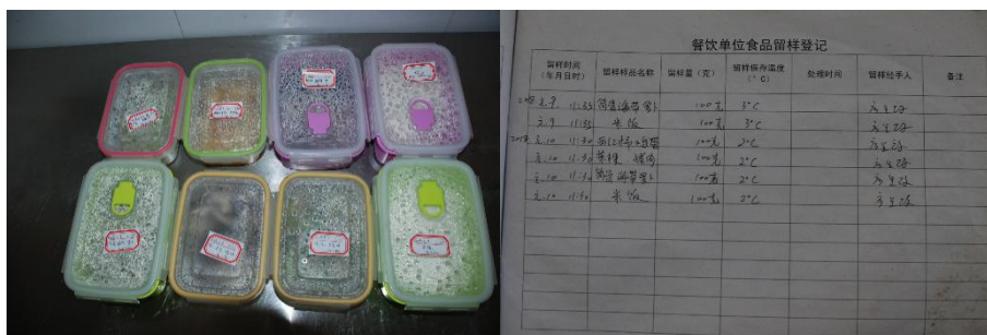
图 I -3 食品留样情况组图