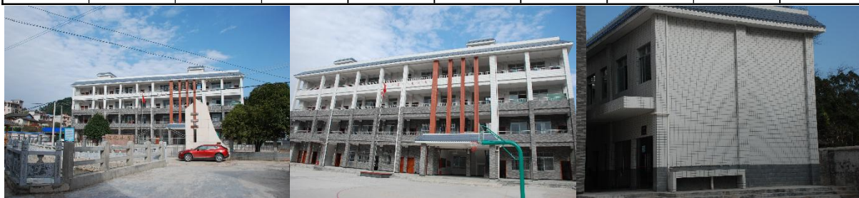
图 1 学校情况组图