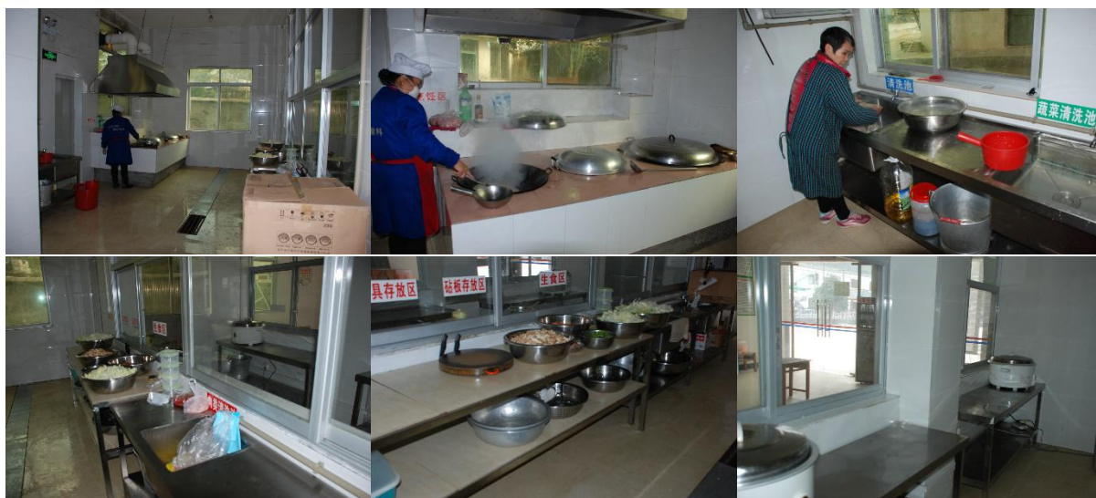
图 I -2 厨房厨师卫生情况组图