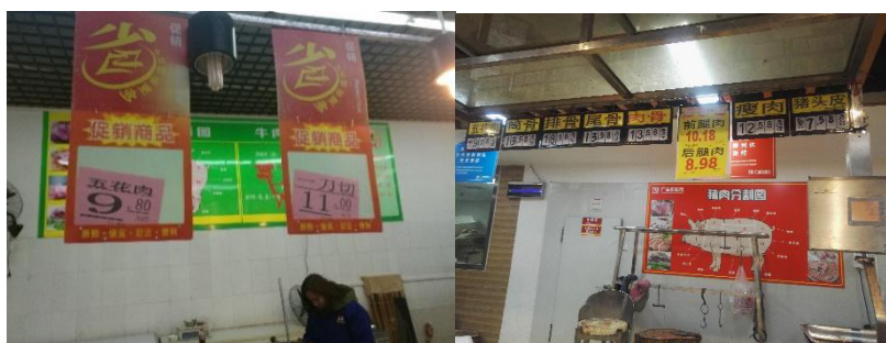
图 2 蒙山县城两超市猪肉价格情况图

该校猪肉采购价格远高于当地超市零售价：学校猪肉采购价为 13 元/斤，蒙山县城超市猪肉价 8.98—11 元/斤，学校采购价格比超市高出 2—4 元。（见图 2、图 II-1）