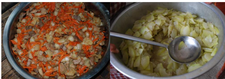
图III-1 稽核当天食品情况组图