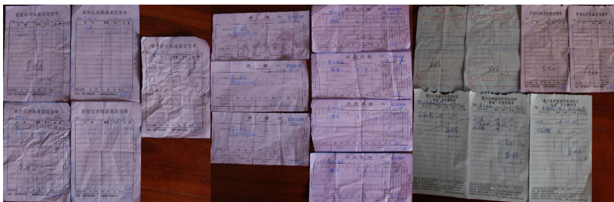
图 II-1 原始凭证组图