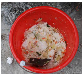
图III-4 餐后厨余图（另外还有大半桶在拍照前被倒掉了）