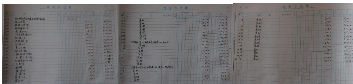
图 II-2 现金流水账组图