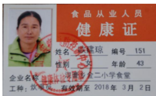
图 I-1 厨师健康证图