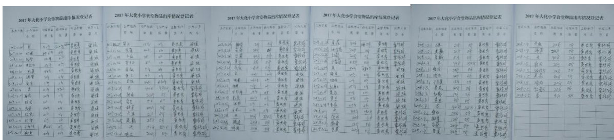
图 II-3 出库登记组图