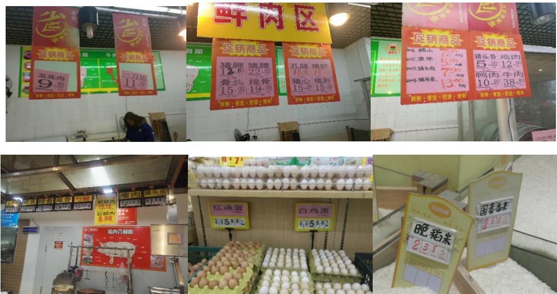
图 2 蒙山县两超市部分物价情况图

该校部分食材采购价格高于当地超市零售价，另扣 20 分：当地超市的猪肉才 9—11 元/斤，排骨为 18.18—19 元/斤，晚稻米 2.38 元/斤，而统一配送给学校的猪肉价格为 15 元/斤，排骨为 23 元/斤，晚籼米（二级）为 3.1 元/斤。（见图 2、图 II-1）