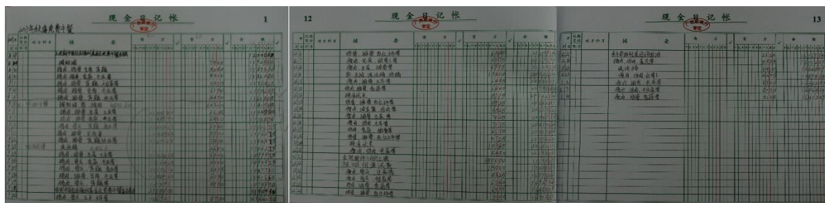
图 II-4 现流水账组图