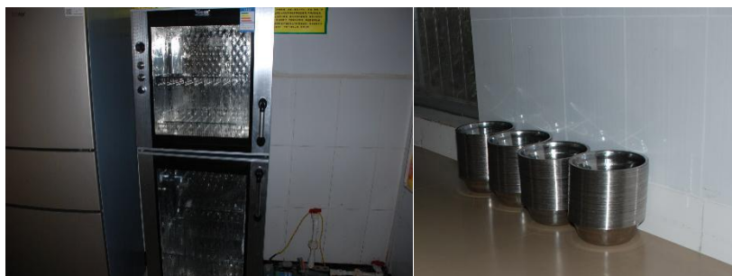
图III-3 用餐卫生情况组图