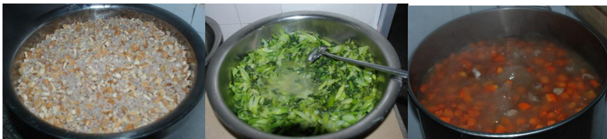
图III-1 稽核当天食品情况组图