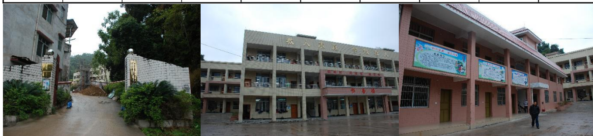
图 1 学校情况组图