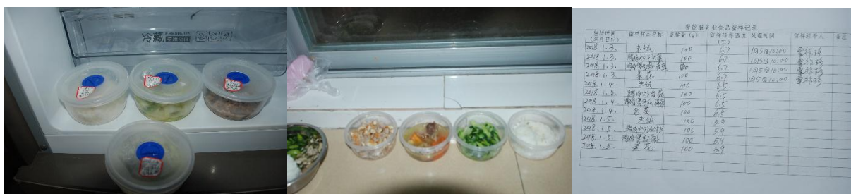
图 I-3 食品留样情况组图