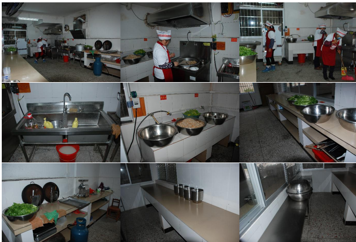
图 I-2 厨房厨师卫生情况组图