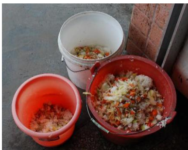
图III-4 餐后厨余情况图