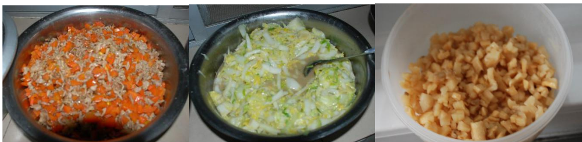
图III-1 稽核当天食品情况组图