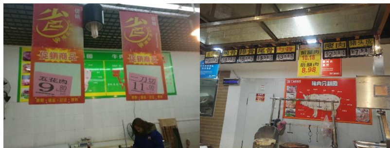
图 2 蒙山县城两超市猪肉价格情况图