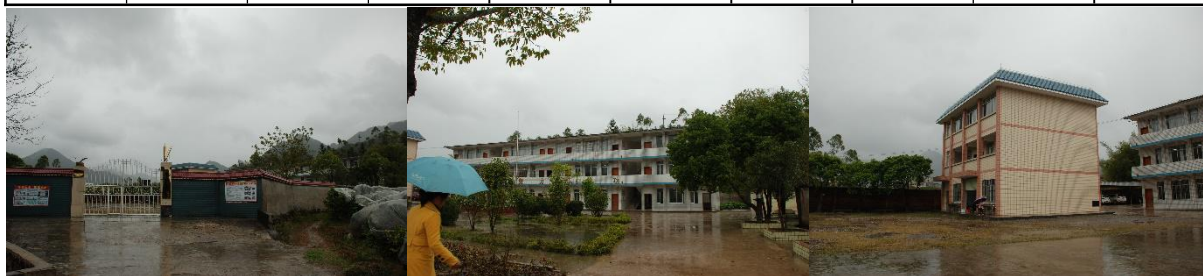
图 1 学校情况组图