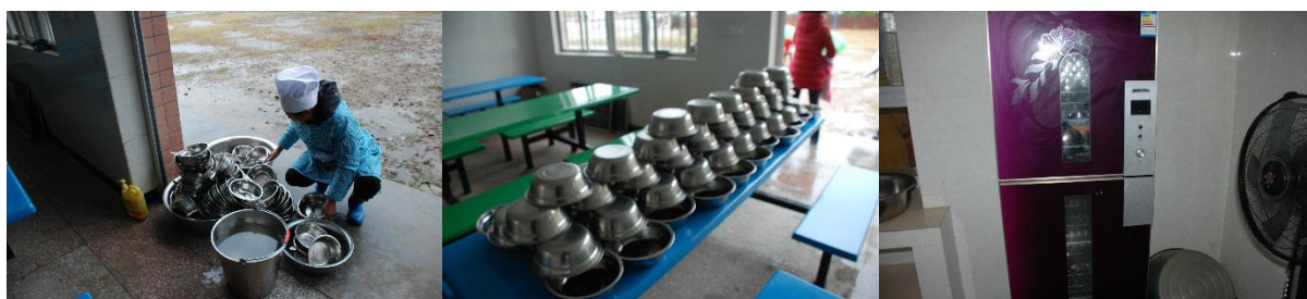
图III-3 用餐卫生情况组图