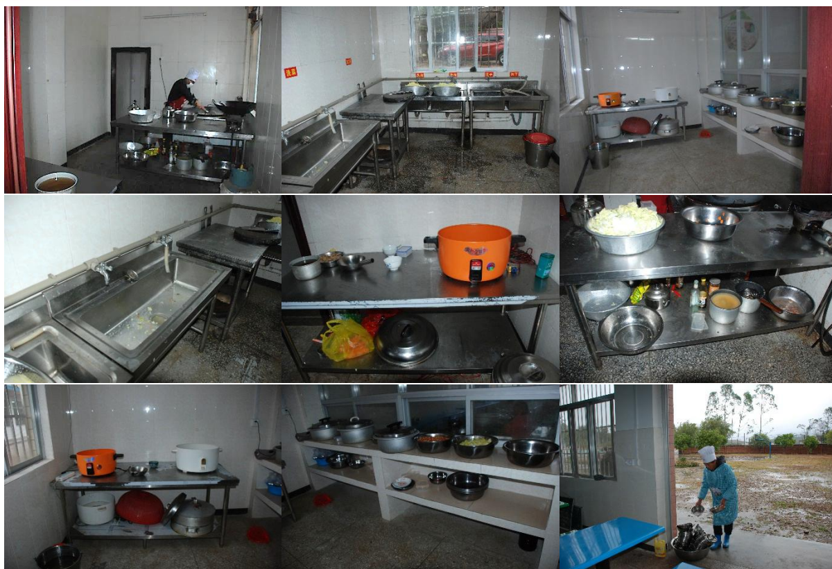
图 I -2 厨房厨师卫生情况组图