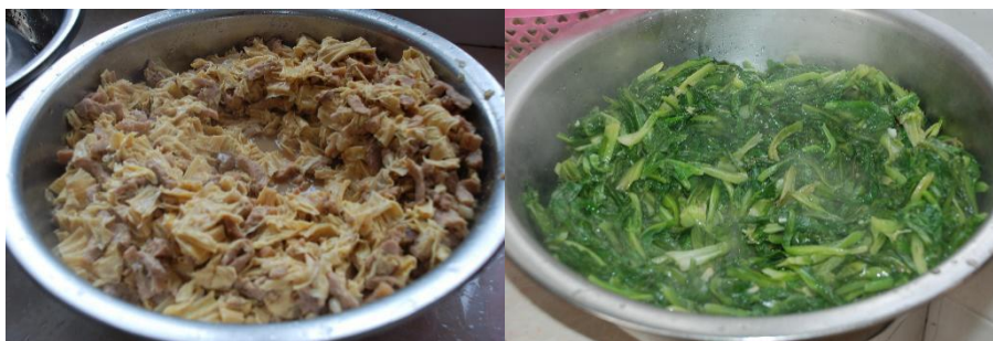
图III-1 稽核当天食品情况组图