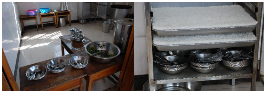
图III-3 用餐卫生情况组图