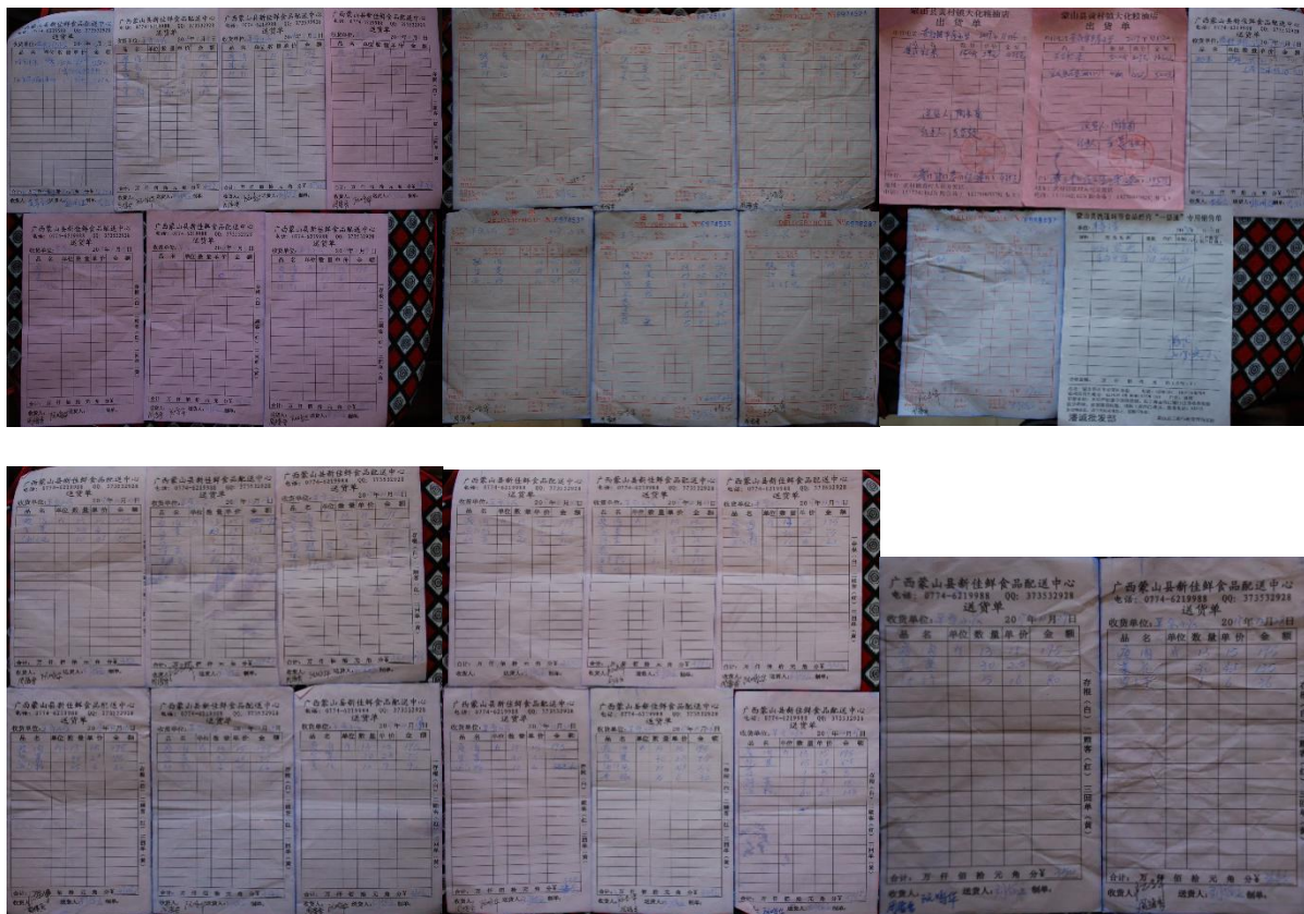
图 II-1 原始凭证组图