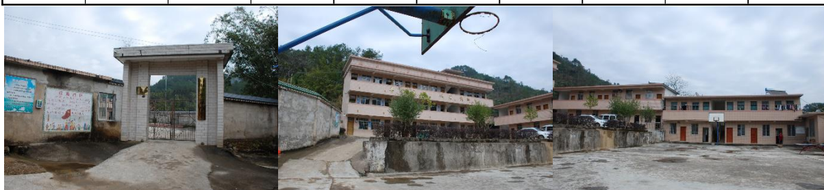
图 1 学校情况组图