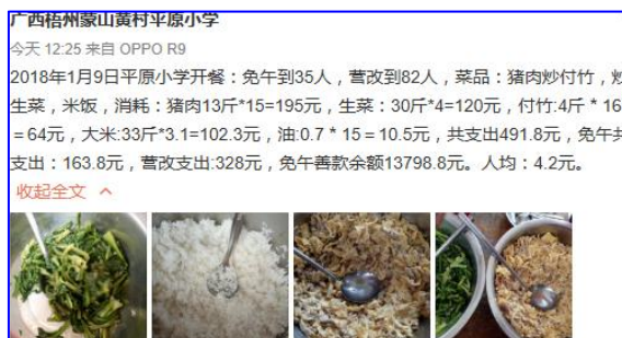
图IV-1 稽核当日微博截图