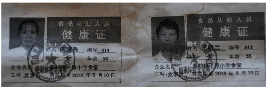
图 I -1 厨师健康证组图