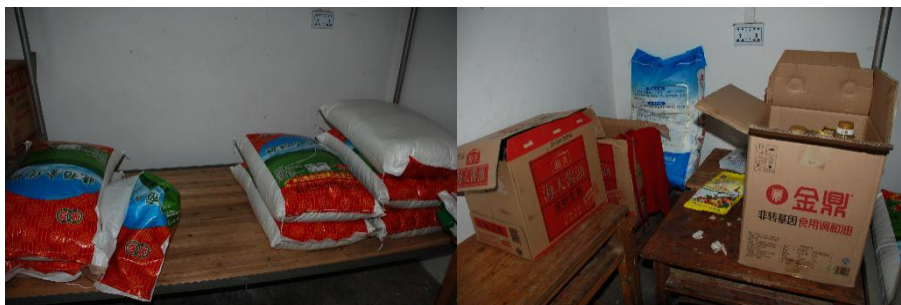
图 I -3 食材储存情况组图