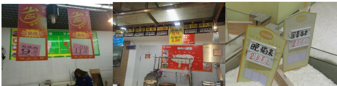
图 2 蒙山县城超市猪肉及大米价格