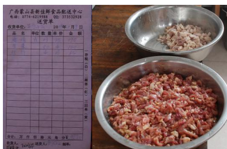
图 3 学校出示配送公司元月 9 日的原始凭证及猪肉