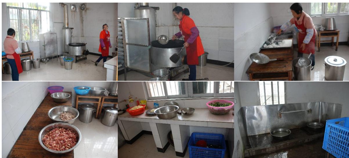
图 I -2 厨房厨师卫生情况组图