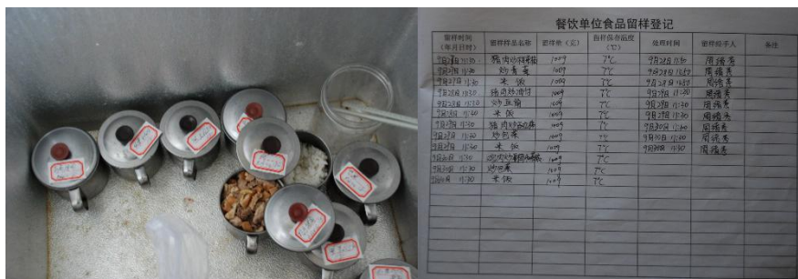
图 I -4 食品留样情况组图