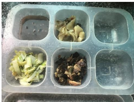
图 I -5 食品留样情况组图