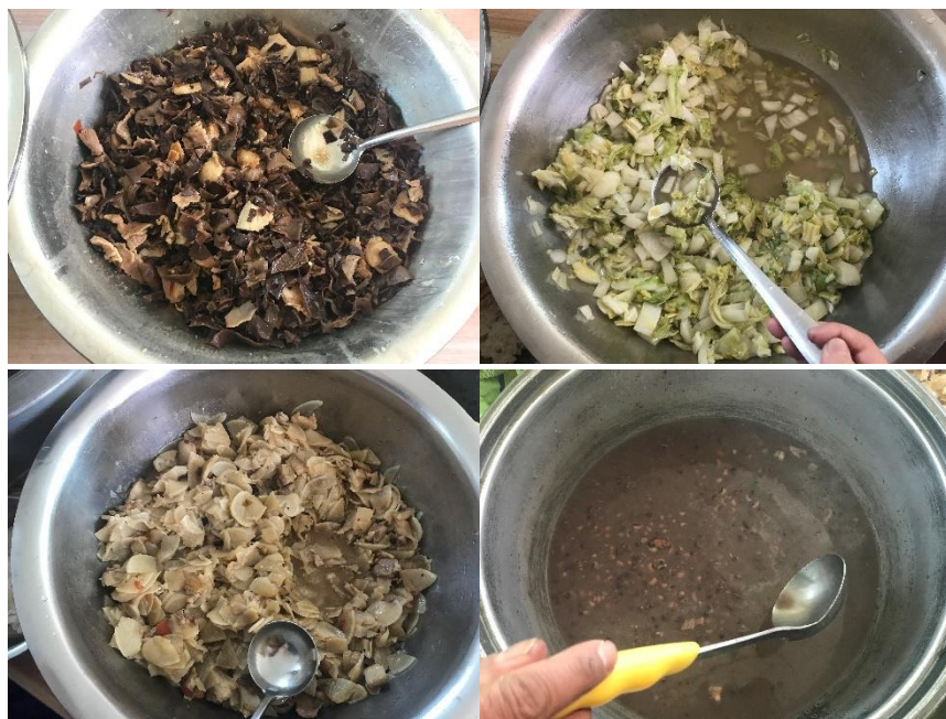
图Ⅲ-1 稽核当日菜品情况组图