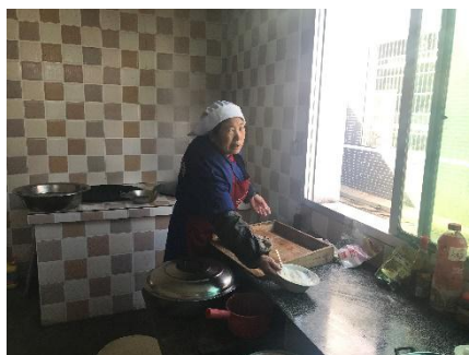
图 I -3 厨师卫生情况组图