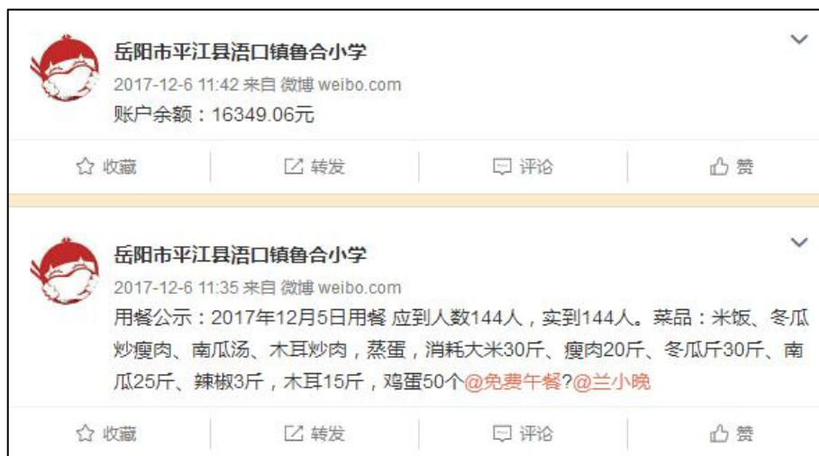
图IV-1 该校微博最后更新内容截图

本节各分项考核全部得0分，原因是该校微博已停止更新长达一个月以上，且已更新内容严重延迟。