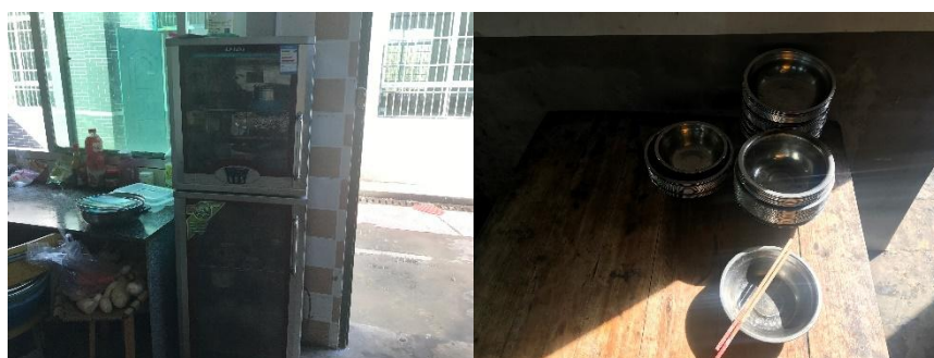
图Ⅲ-3 就餐卫生情况组图