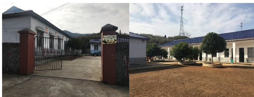
图 2 学校大门及校园环境组图