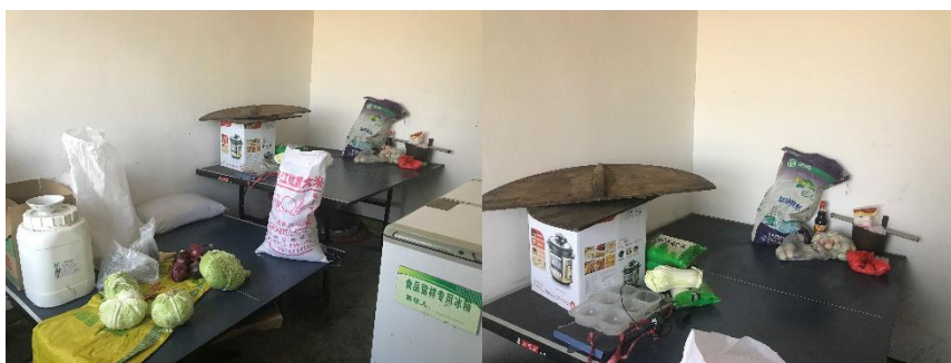
图 I -4 食材储存情况组图