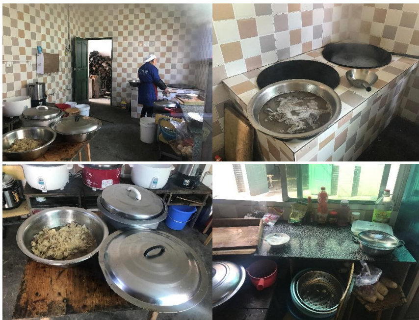
图 I -2 厨房卫生情况组图