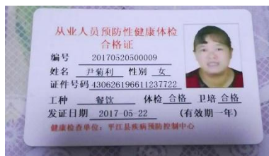
图 I -1 厨师健康证图