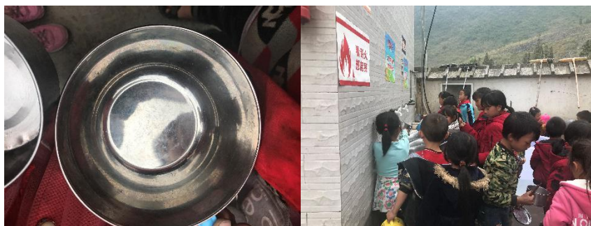
图III-3 就餐卫生情况组图