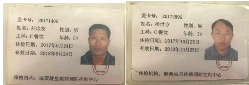
图 I -1 厨师健康证组图