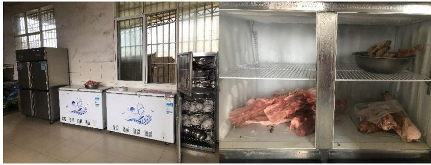
图 I-4 食材储存情况组图