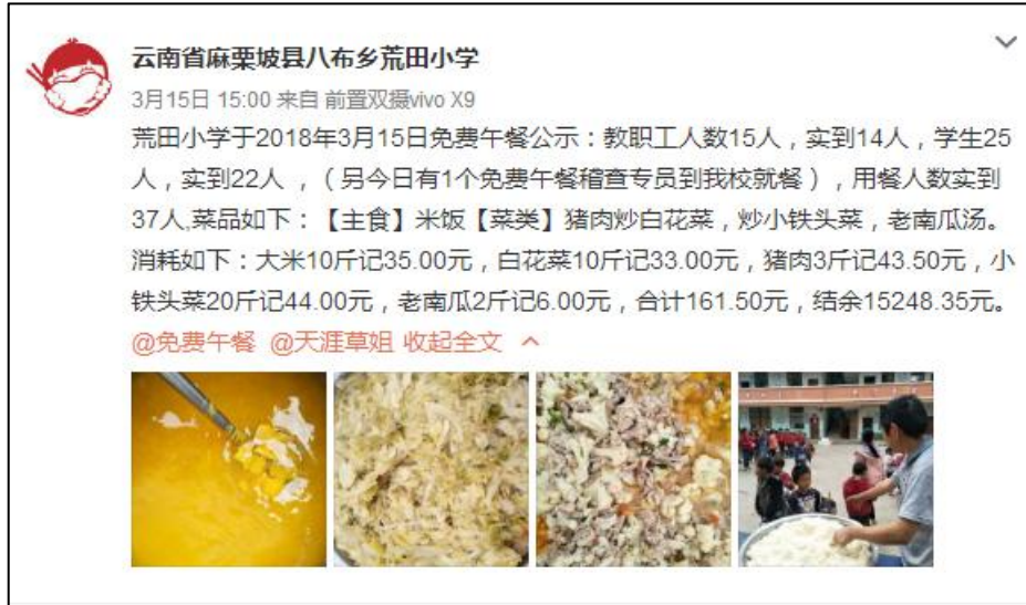
图IV-1 稽核当日该校微博截图

3、“荤菜率及人均分布量”得0分，原因是该校微博未发布午餐食材整体消耗情况，导致无法评估荤菜人均分布量。