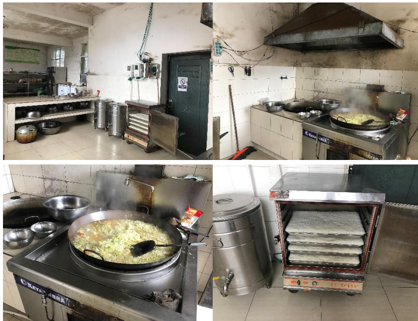
图 I -2 厨房卫生情况组图