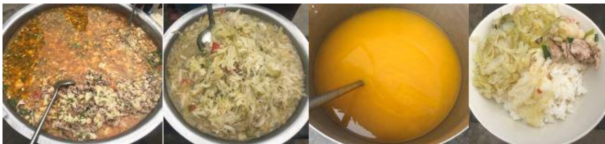
图III-1 稽核当日菜品情况组图