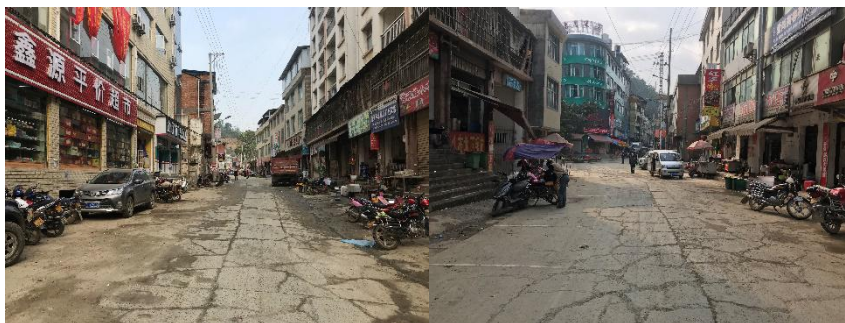
图 1 八步乡街景组图

交通说明：前往荒田村小学可在麻栗坡县汽车站乘坐董干、新寨方向的客运班车抵达八步乡后换乘摩托车或包车，约 35 分钟便可抵达荒田村小学门口。麻栗坡汽车站至八步乡的客运班车约 1 小时 1 班，交通方便；八步乡至荒田小学日常无营运车辆，需包车或者选择乘坐摩托车前往。