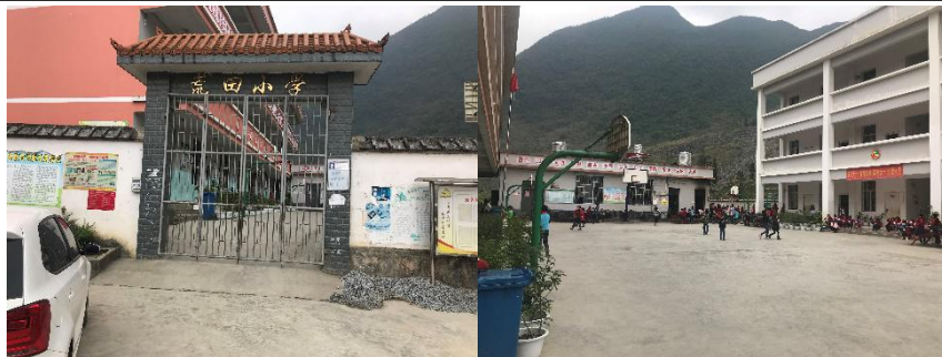
图 2 学校大门及校园环境组图