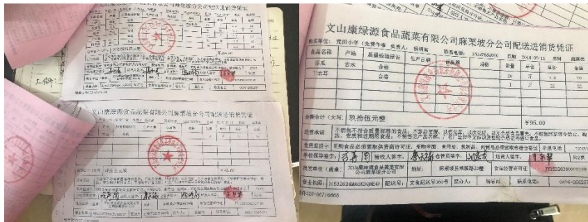
图 II-1 原始采购凭证组图