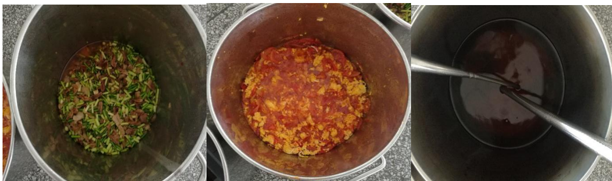
图III-1 稽核当天菜品情况组图