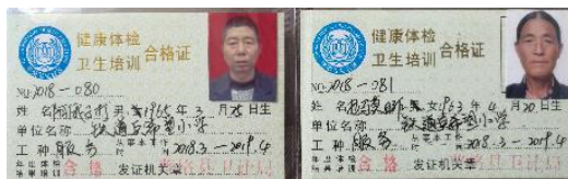
图 I-1 厨师健康证组图