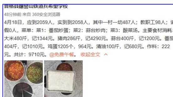
图IV-1 稽核当日微博截图

(1) 用餐人数及日期扣分原因是学校用餐人数与稽核专员当天在学校现场获取的人数不一样。