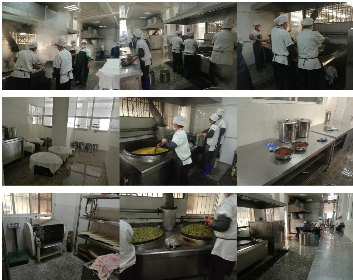
图 I-2 厨师、厨房卫生情况组图