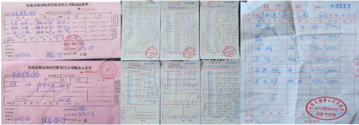
图 II-1 原始凭证组图