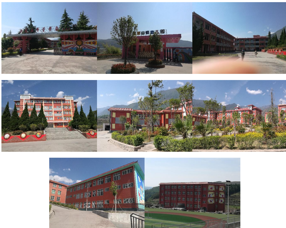
图 1 学校外观环境情况组图