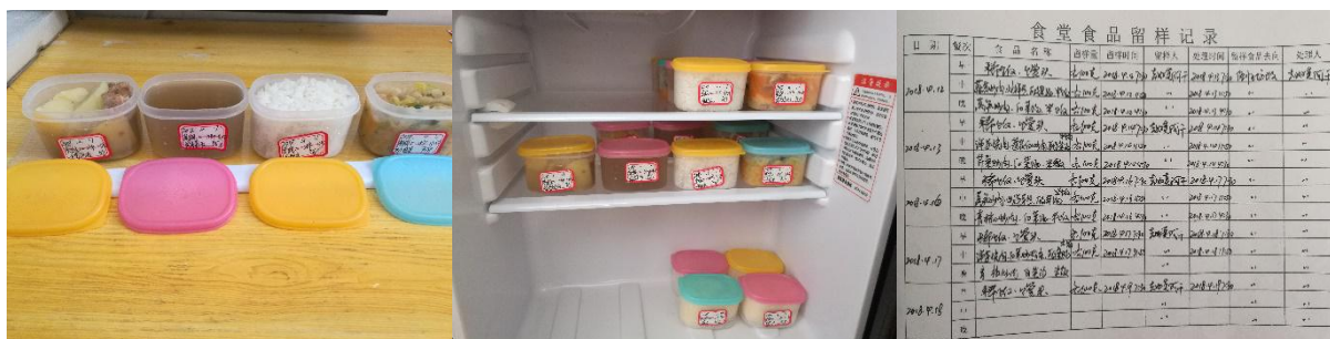
图 I -4 食品留样情况组图