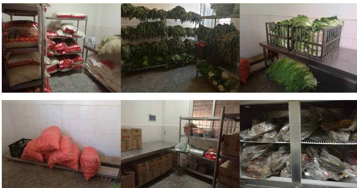
图 I-3 食材储存情况组图