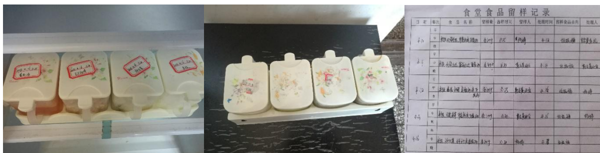
图 I-4 食品留样情况组图