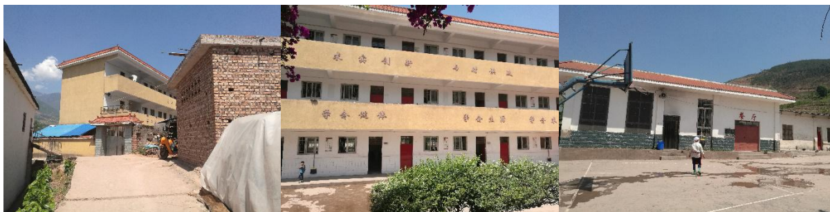
图 1 学校情况组图