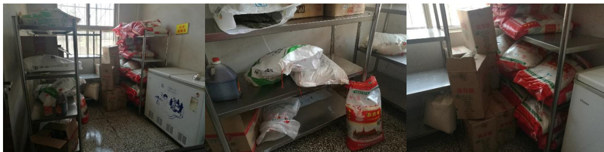
图 I-3 食材储存情况组图