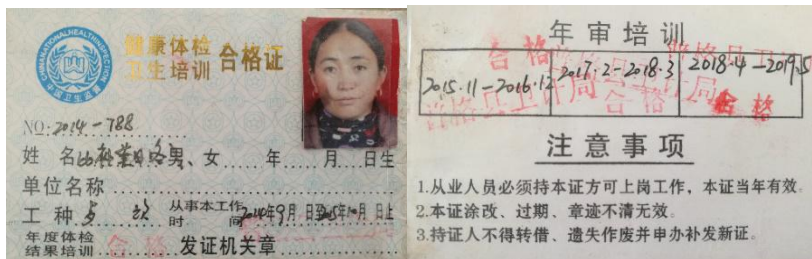
图 I-1 厨师健康证图