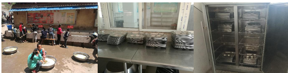
图III-3 就餐卫生情况组图