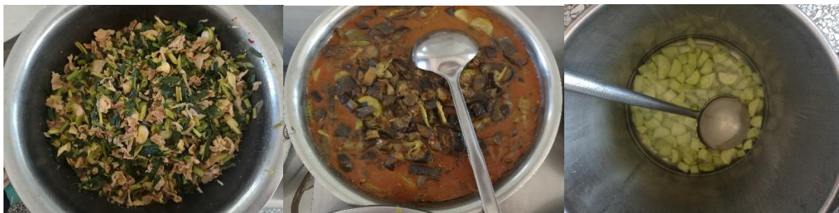
图III-1 稽核当天菜品情况组图