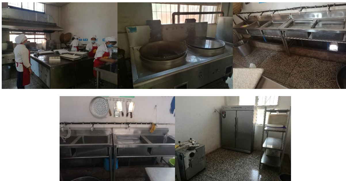
图 I-2 厨师、厨房卫生情况组图