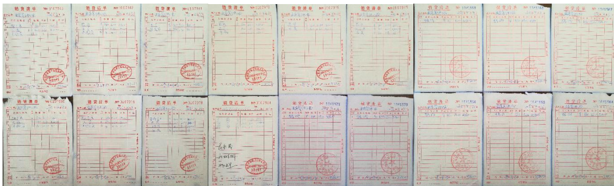
图 II-1 原始凭证组图