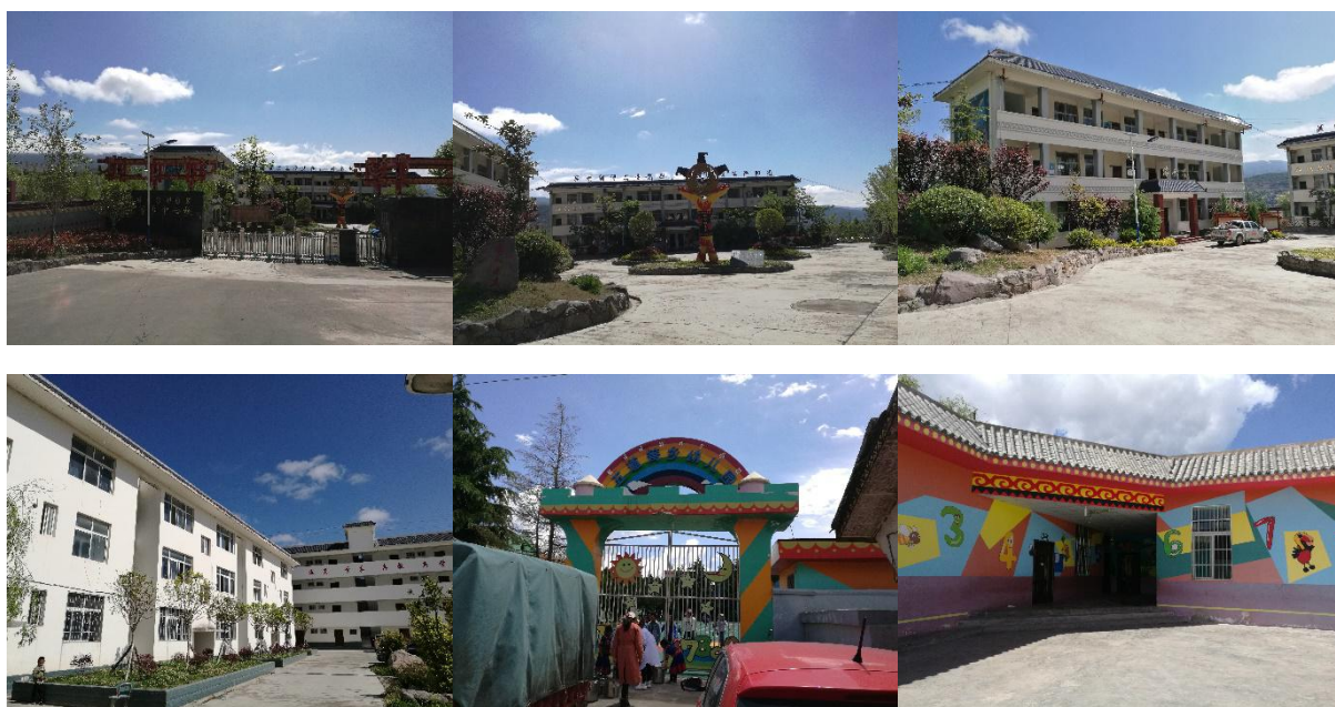
图 1 学校外观环境情况组图