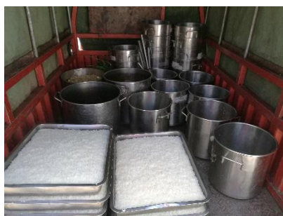
图III-4 幼儿园送餐车图