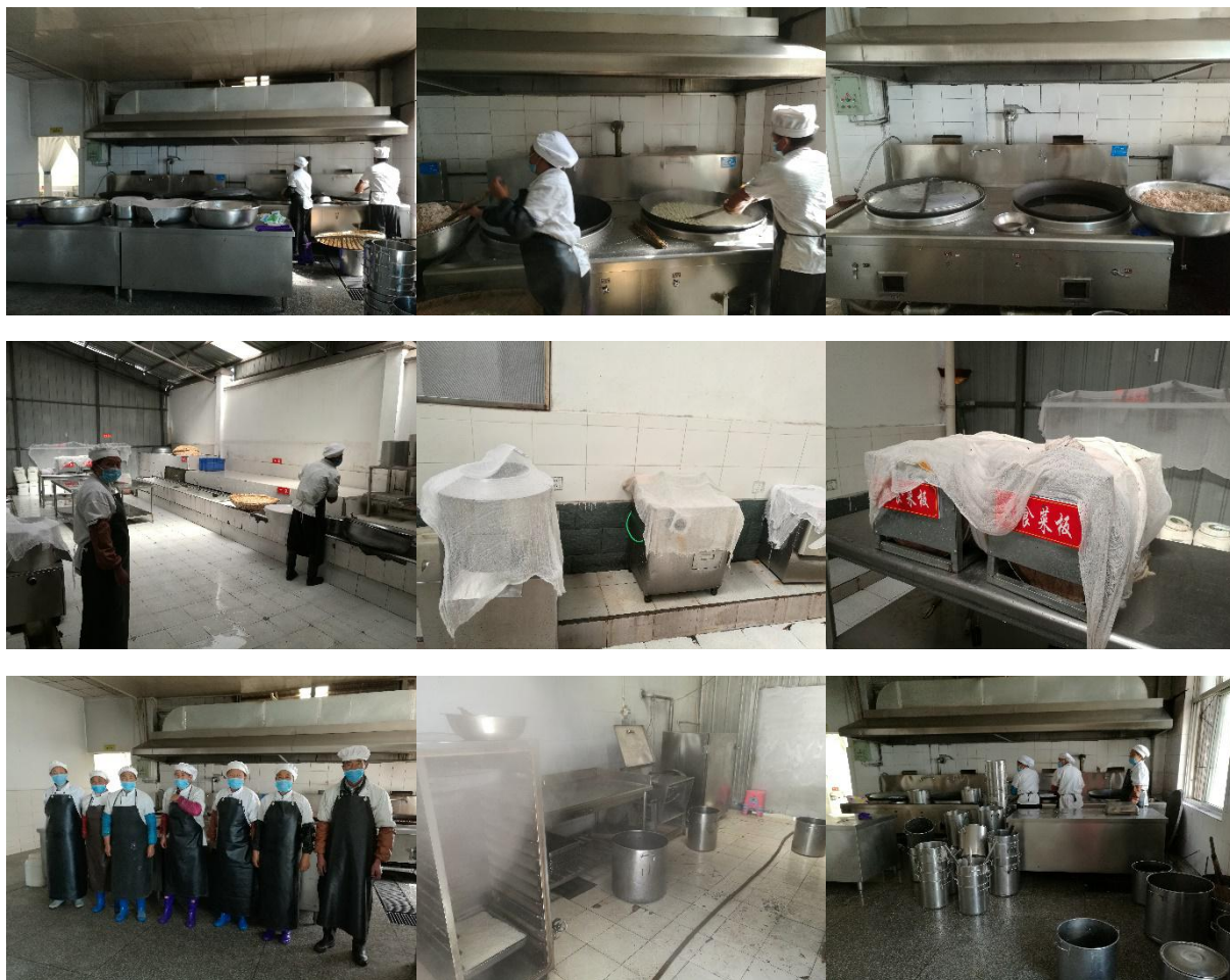
图 I-2 厨师、厨房卫生情况组图