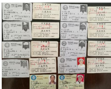
图 I -1 厨师健康证图