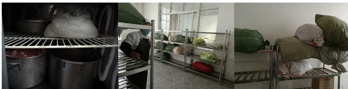
图 I -3 食材储存情况组图