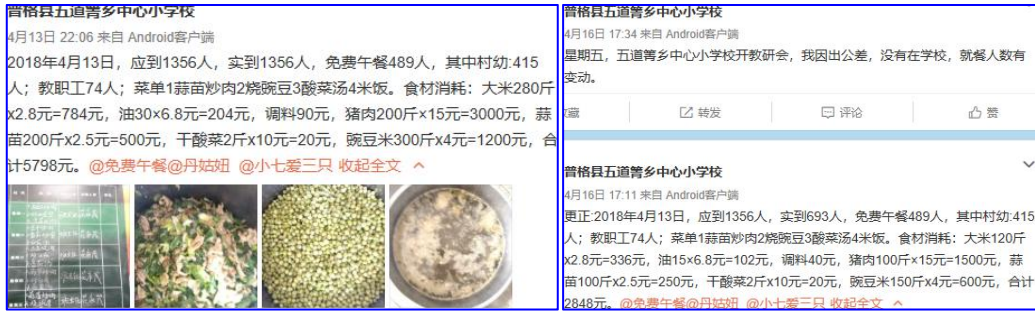
图IV-2 4月13日微博公示截图