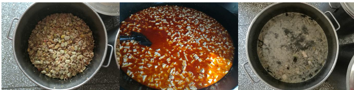
图III-1 稽核当天菜品情况组图