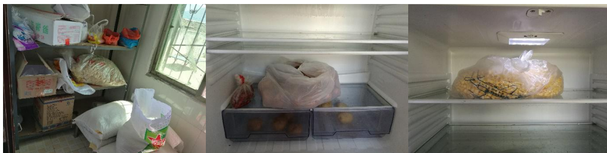
图 I-3 食材储存情况组图