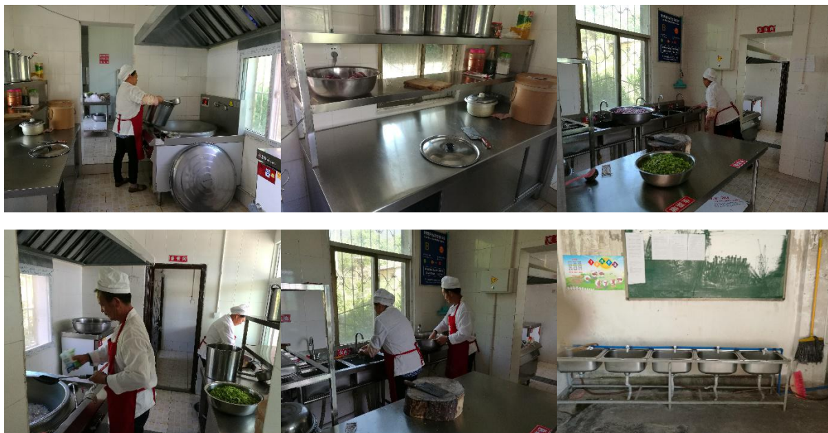
图 I-2 厨师、厨房卫生情况组图