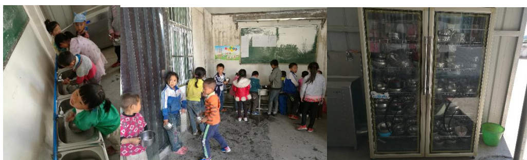
图III-3 就餐卫生情况组图