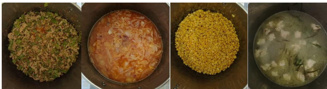
图III-1 稽核当天午餐菜品情况组图