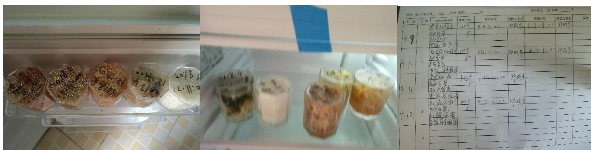
图 I-4 食品留样情况组图