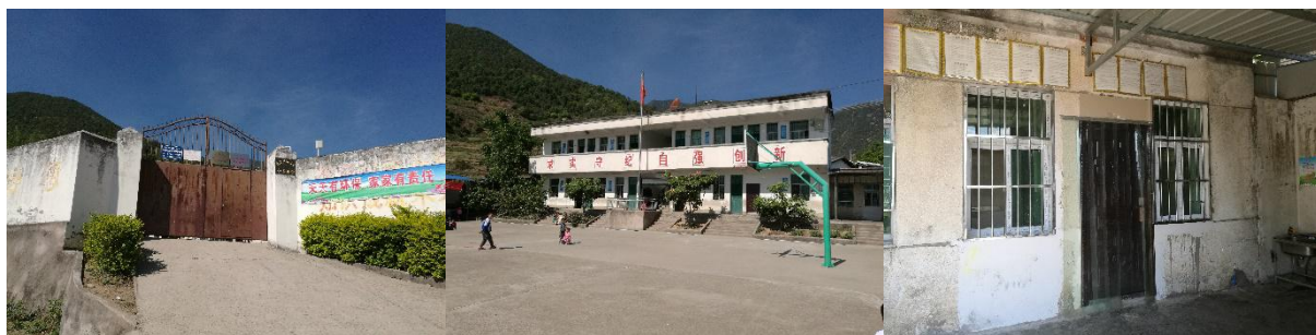
图 1 学校外观环境情况组图