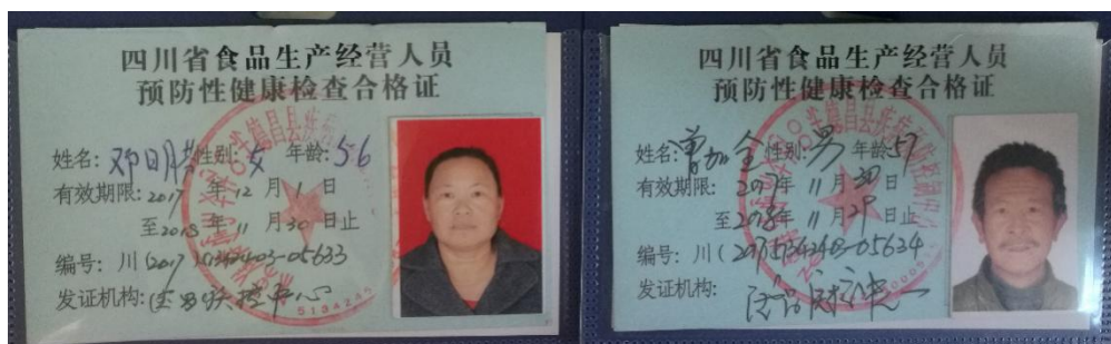
图 I -1 厨师健康证组图