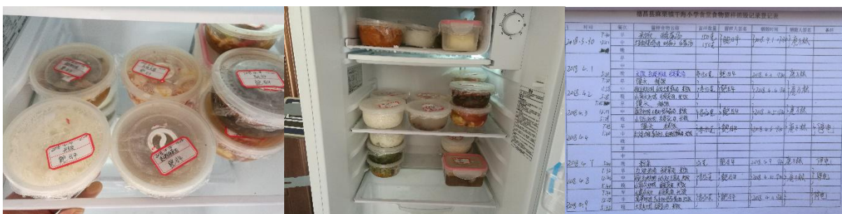
图 I-4 食品留样情况组图