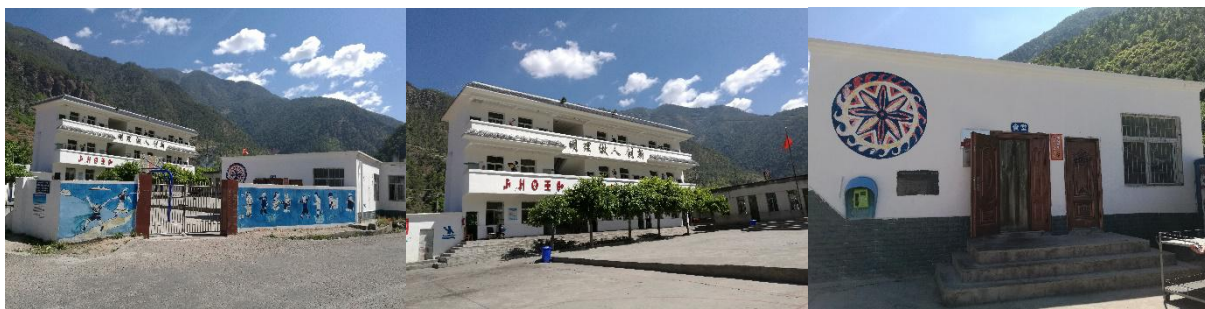
图 1 学校情况组图