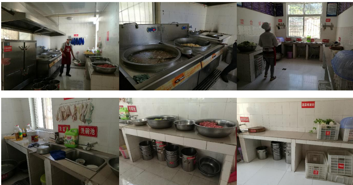
图 I-2 厨师、厨房卫生情况组图