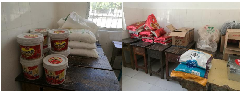
图 I-3 食材储存情况组图