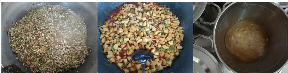
图III-1 稽核当天菜品情况组图