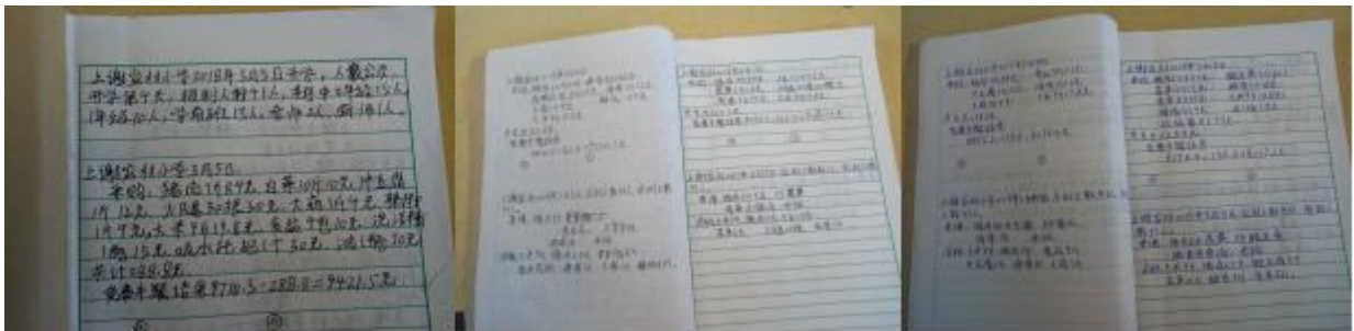
图 II-1 出入库记录组图