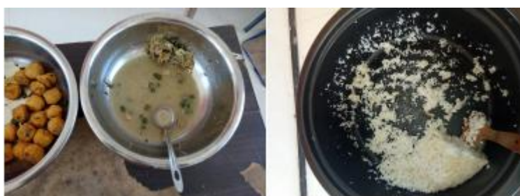
图III-4 餐后剩余情况组图