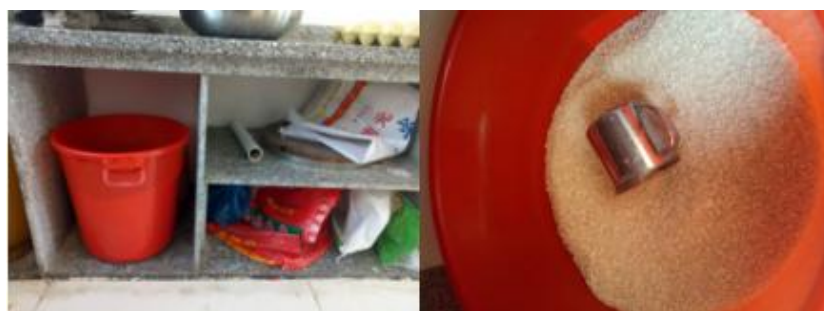
图 I -4 食材储存情况组图