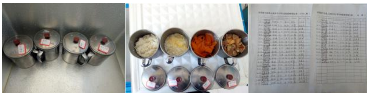
图 I -5 食品留样情况组图