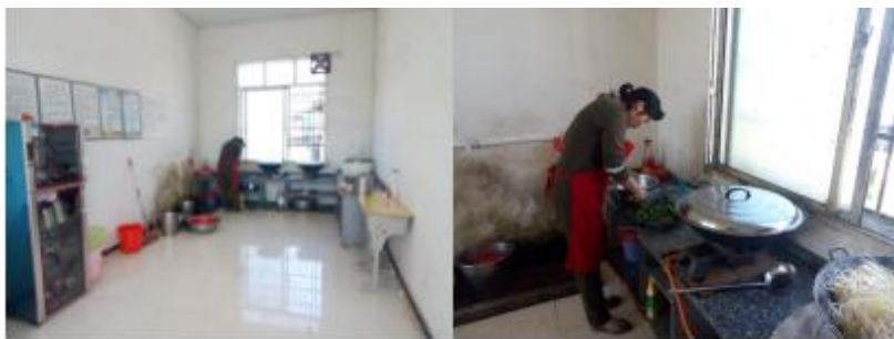
图 I -1 厨房卫生情况组图