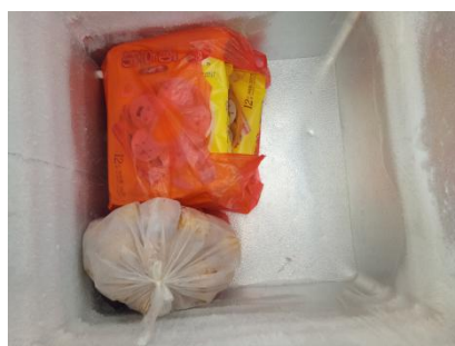
图 I -3 冰箱内部卫生情况图