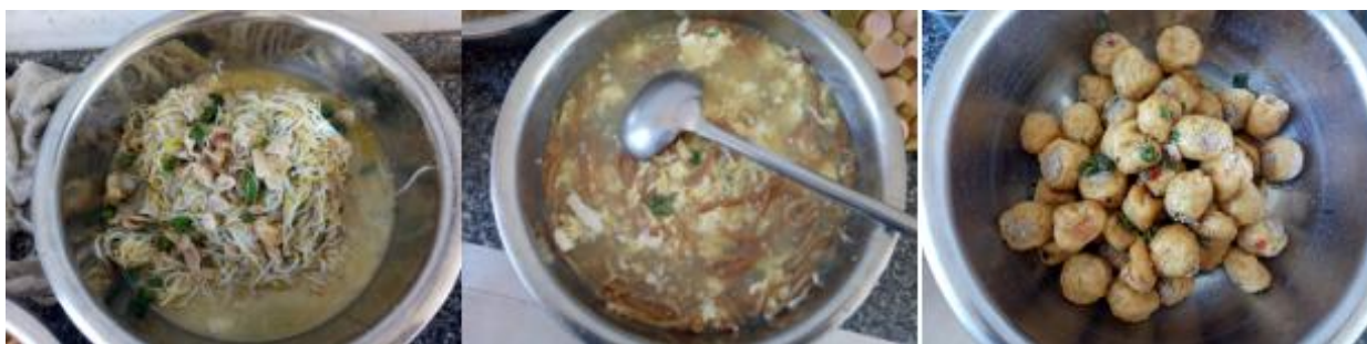
图III-1 稽核当天菜品情况组图