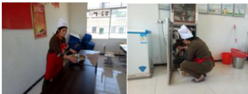
图 I -2 厨师卫生情况组图