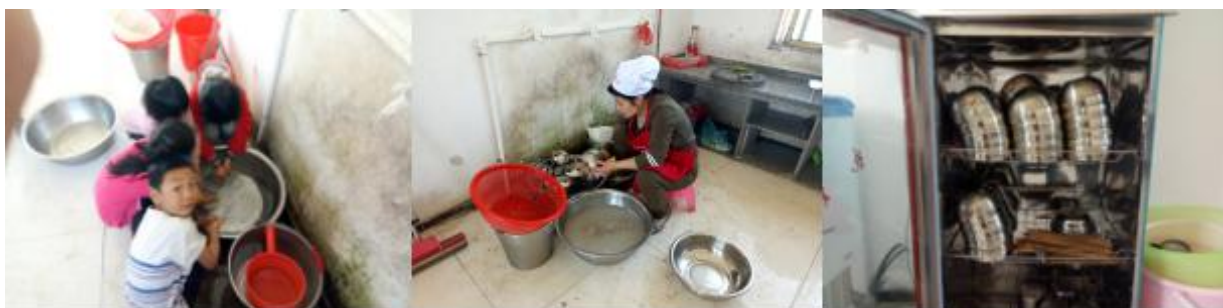
图III-3 就餐卫生情况组图