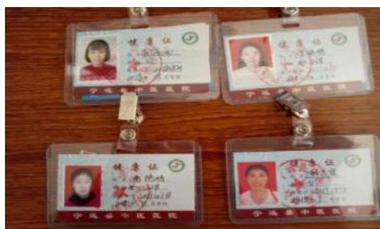
图 I -1 厨师健康证组图