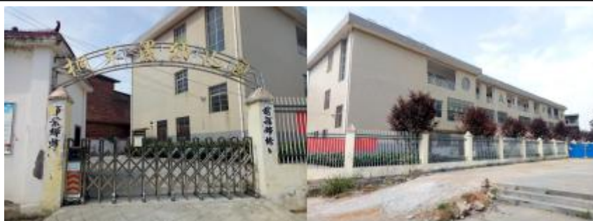
图 2 学校情况组图