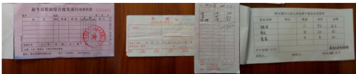
图 II-1 原始凭证组图