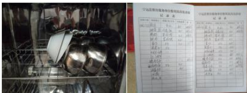
图 I -5 餐具消毒情况组图