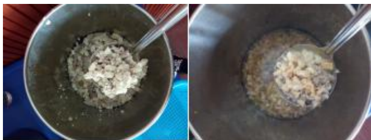
图III-1 稽核当天菜品情况组图