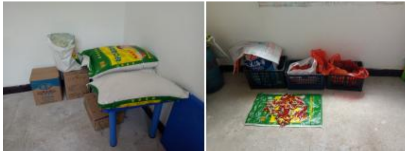
图 I -3 食材储存情况组图