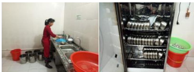
图III-3 餐后卫生情况组图