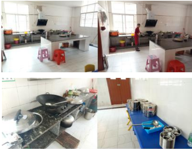
图 I -2 厨房卫生情况组图