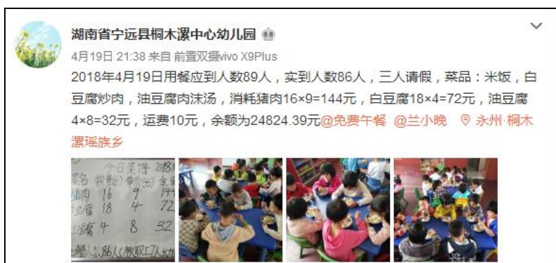
图IV-1 稽核当日学校微博截图