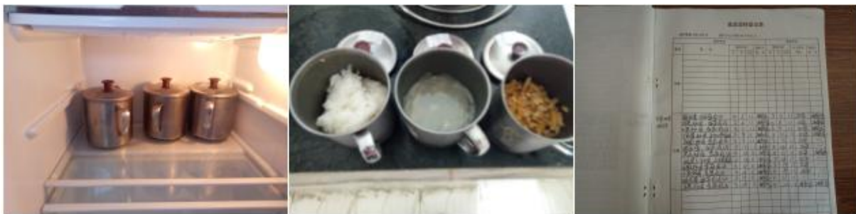
图 I -4 食品留样情况组图