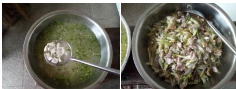
图III-1 稽核当天菜品情况组图