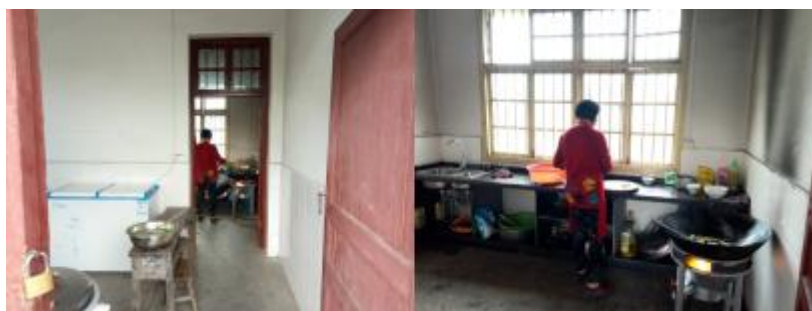
图 I -2 厨房卫生情况组图