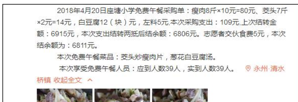
图IV-1 稽核当日学校微博截图