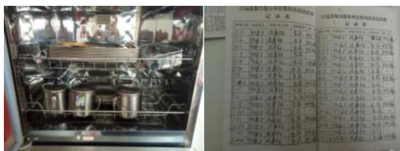
图 I -5 餐具消毒情况组图