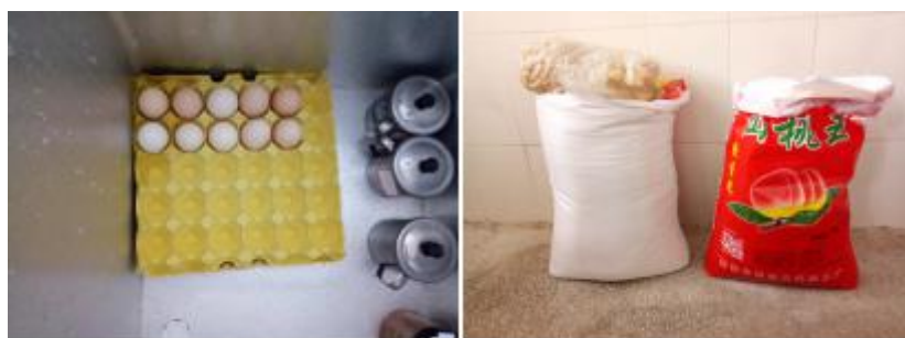
图 I -3 食材储存情况组图