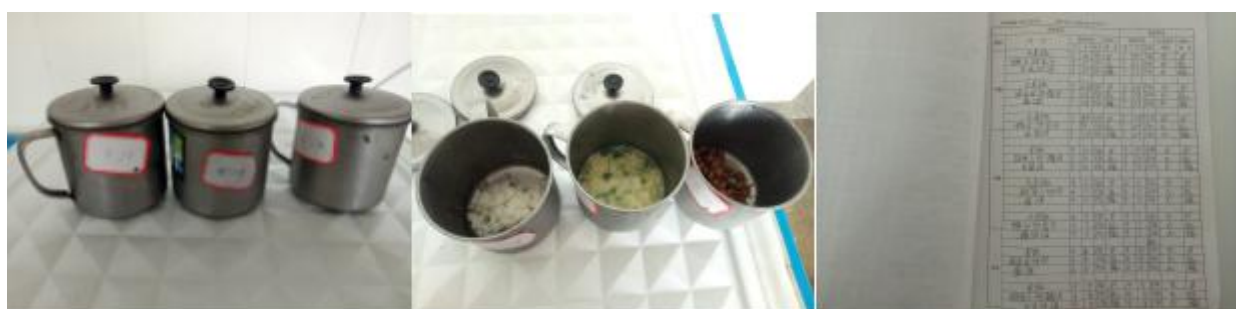
图 I -4 食品留样情况组图