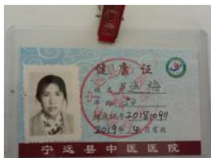
图 I-1 厨师健康证图