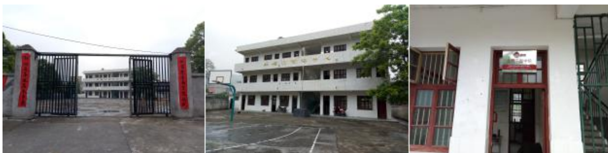
图 2 学校情况组图