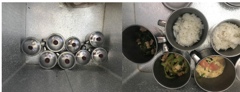
图 I-5 食品留样组图