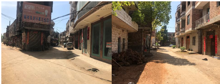
图 1 九十四村学校附近道路组图

交通说明：前往九十四村学校可在宁远县汽车总站后面的舜陵汽车站乘坐前往下坠乡方向的客车抵达下坠乡后徒步大约 200 到达九十四村学校。自宁远县城至下坠乡客车较多，全程硬化路面，交通方便；九十四村学校地处下坠集市郊区，距离下坠街道仅 200 米，徒步 5 分钟即到。