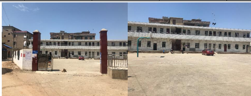
图 2 学校大门及校园环境组图