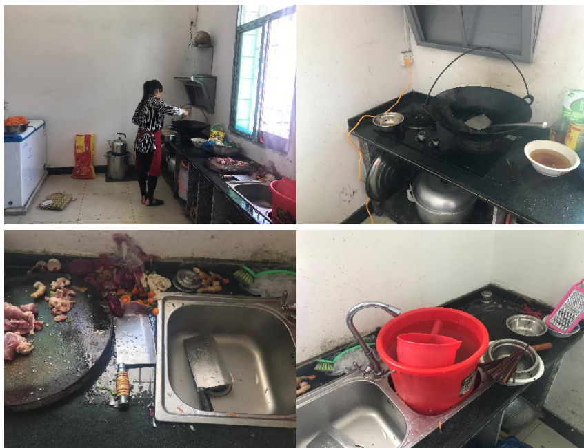
图 I-2 厨房卫生情况组图