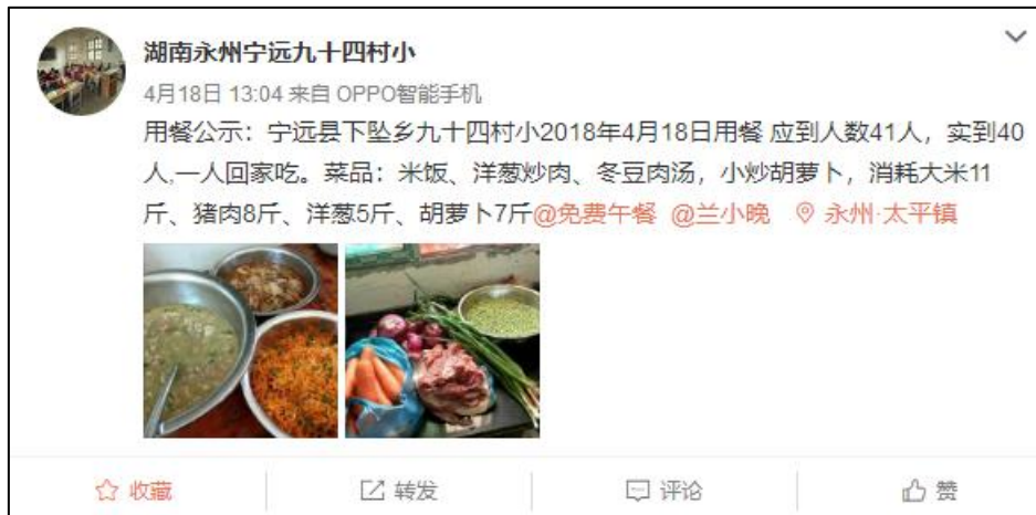
图IV-1 稽核当日学校微博截图