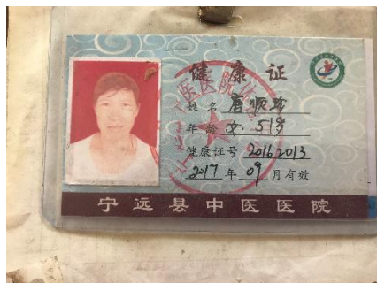
图 I-1 厨师健康证图 (已过期)