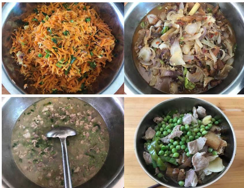
图Ⅲ-1 稽核当日菜品情况组图