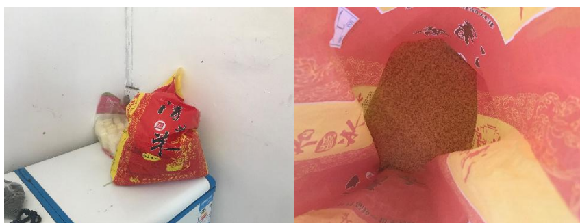
图 I-4 食材储存情况组图