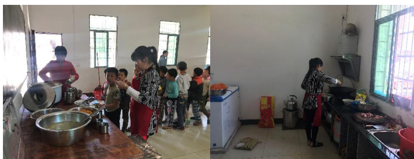
图 I-3 厨师卫生情况组图