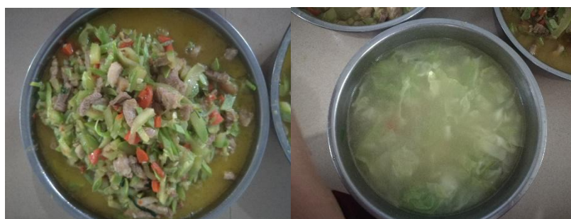
图III-1 稽核当天菜品情况组图