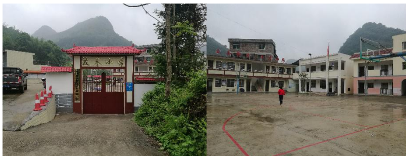
图 1 学校外观环境情况组图