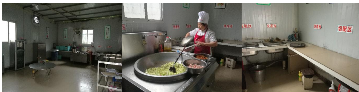
图 I -2 厨师、厨房卫生情况组图