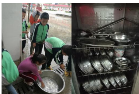
图III-3 就餐卫生情况组图