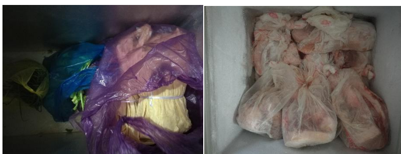
图 I -3 食材储存情况组图