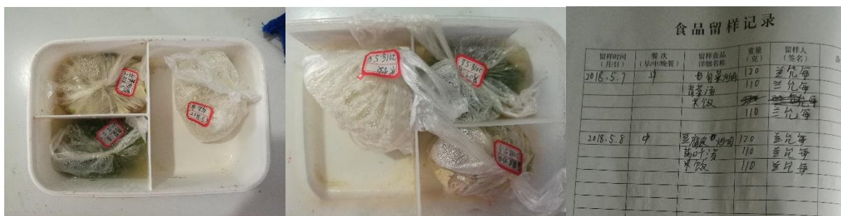
图 I -4 食品留样情况组图