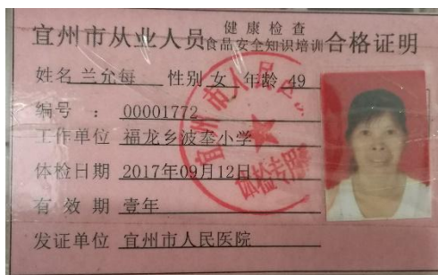
图 I -1 厨师健康证图