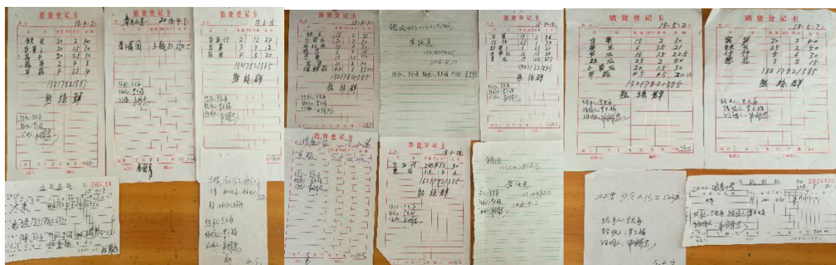
图 II-1 原始凭证组图