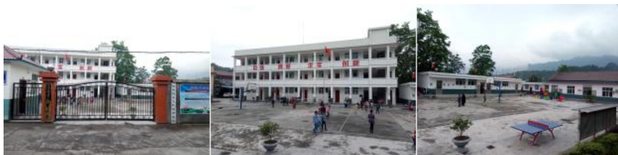
图 2 学校情况组图