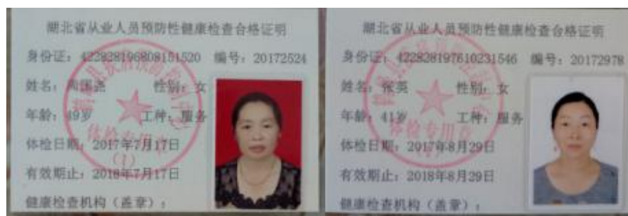
图 I-1 厨师健康证组图