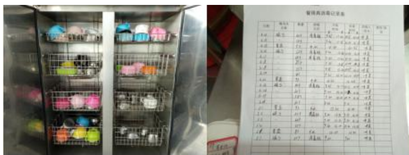
图 I -5 餐具消毒情况组图