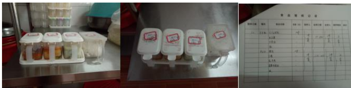
图 I -4 食品留样情况组图