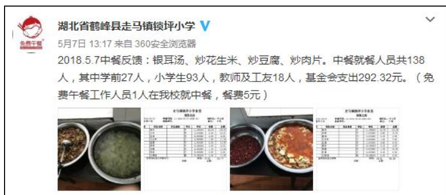
图IV-1 稽核当日学校微博截图