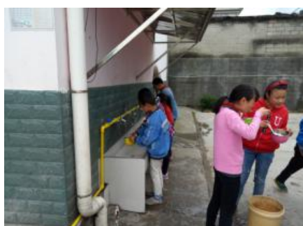
图III-3 餐后卫生情况图