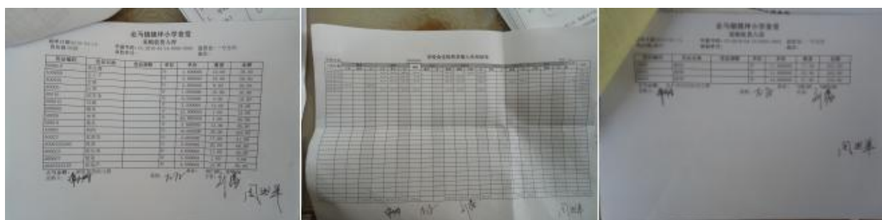
图 II-2 入库单组图