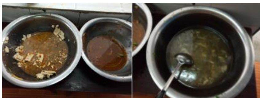
图III-4 餐后剩余情况组图