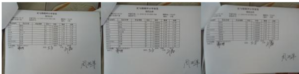
图 II-3 出库单组图