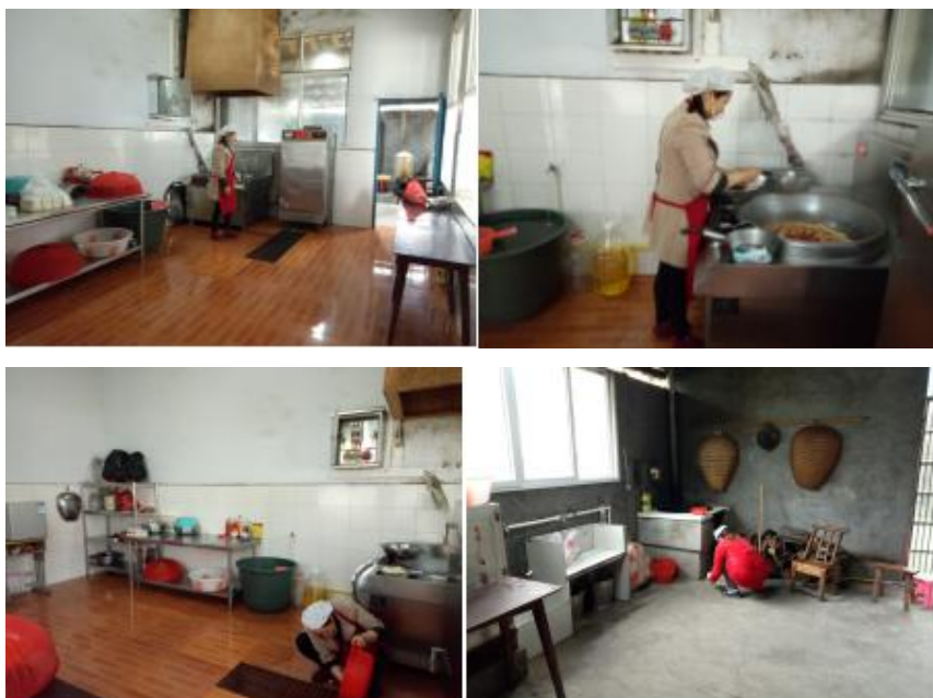
图 I -2 厨房卫生情况组图