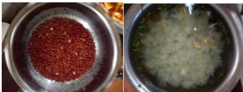
图III-1 稽核当天菜品情况组图