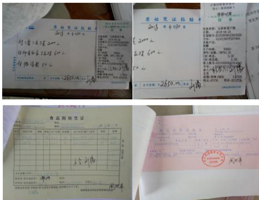
图 II-1 原始凭证组图