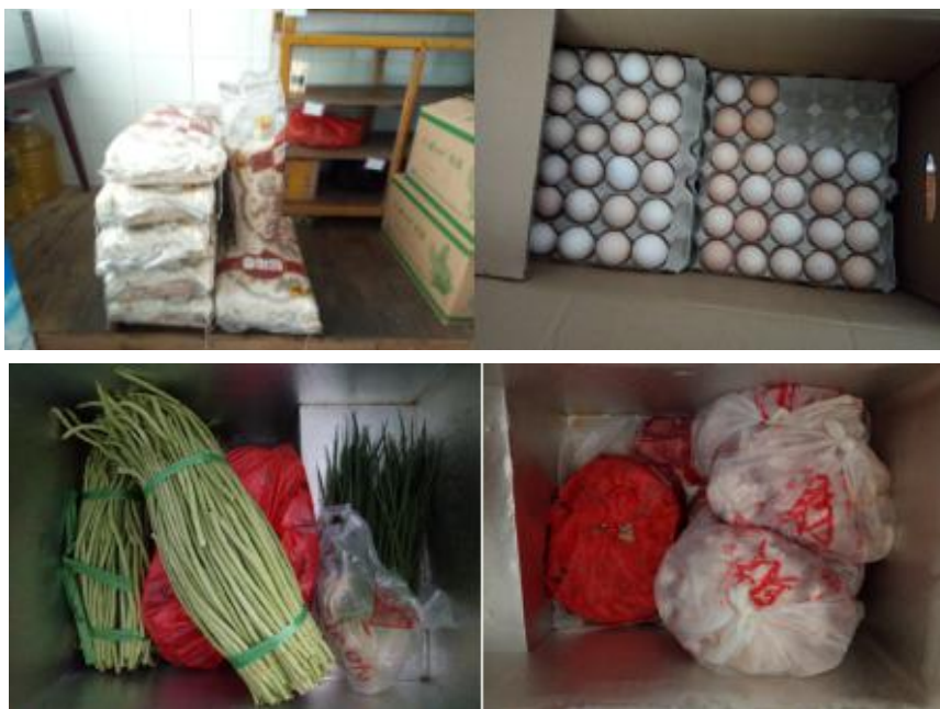
图 I -3 食材储存情况组图