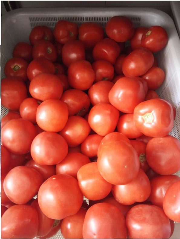
整改后的采购食材图片