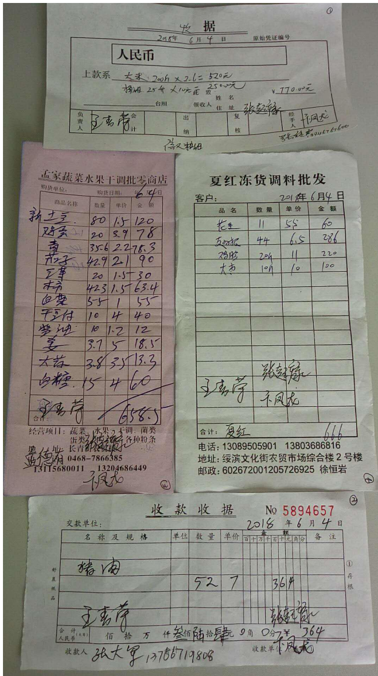
整改后的食材采购原始凭证图片