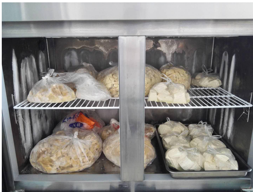
整改后的冰柜内图片