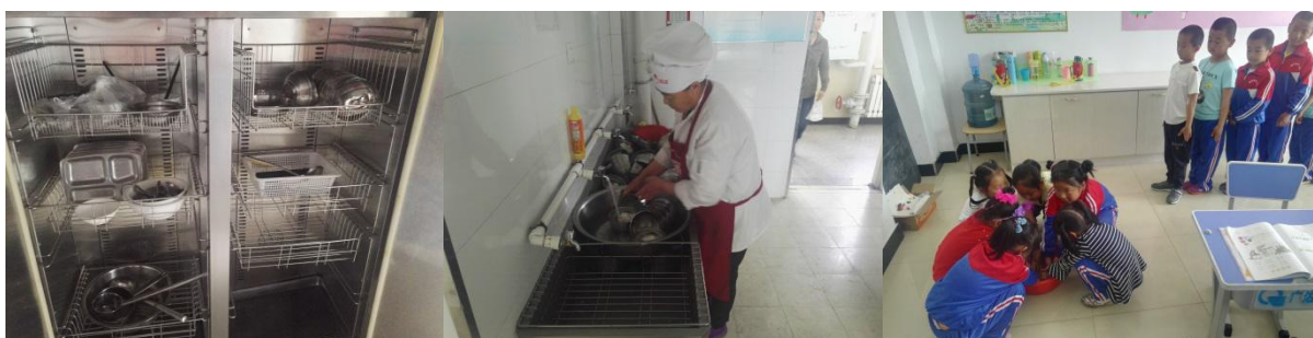
图III-3 就餐卫生情况组图