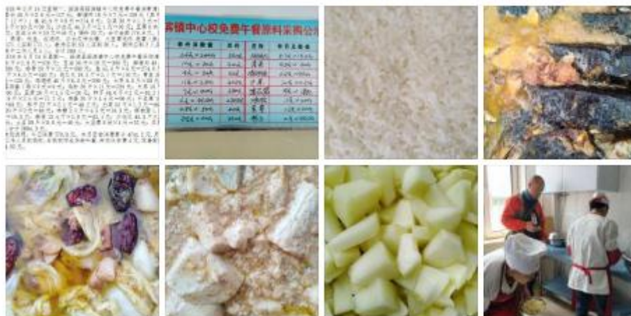
图IV-1 开餐当日微博截图