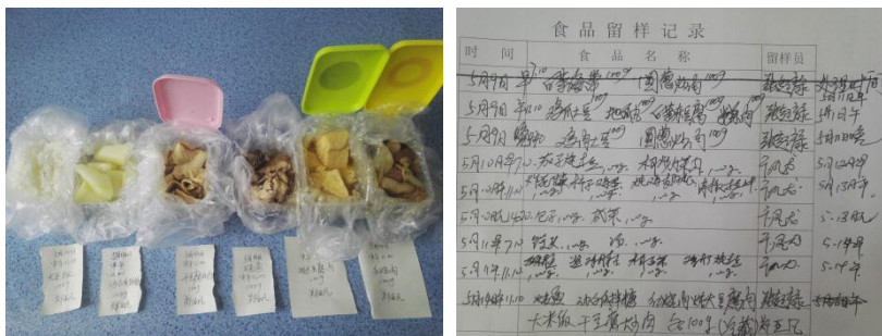
图 I -6 食品留样情况组图