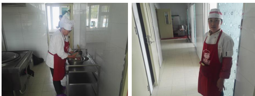
图 I -3 厨师卫生情况组图