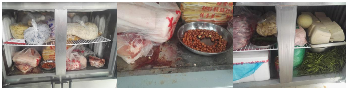
图 I -7 冰箱内部组图