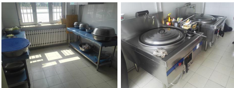
图 I -2 厨房卫生情况组图