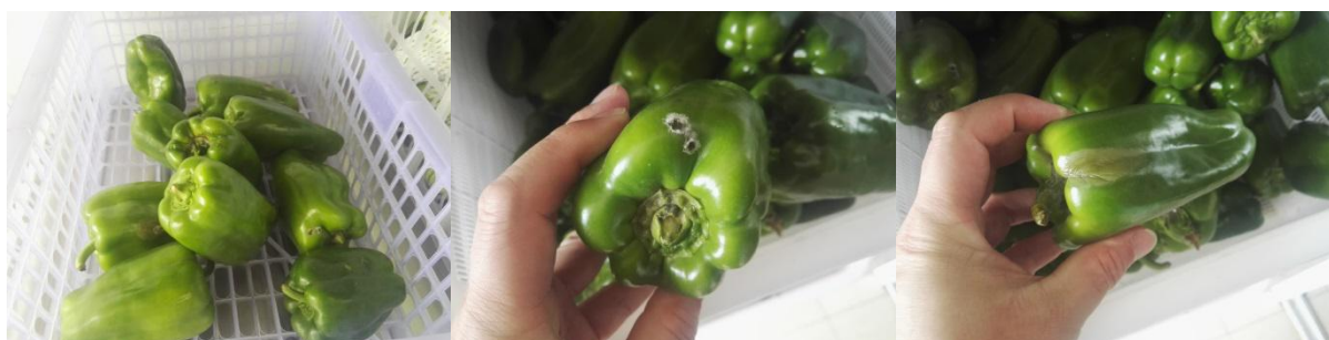
图 I -5 出现腐败的食材组图