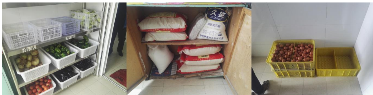
图 I -4 食材储存情况组图