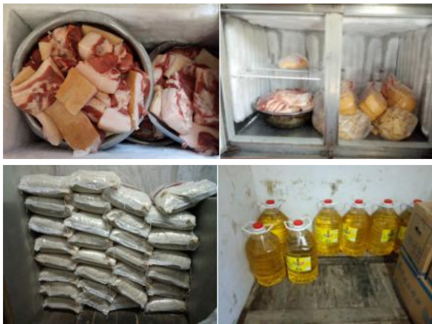
图 I - 3 食材储存情况组图