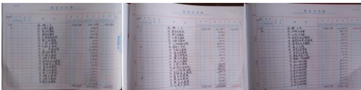
图 II-3 现金账组图