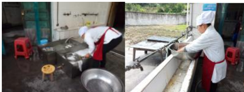
图III-3 餐后卫生情况组图