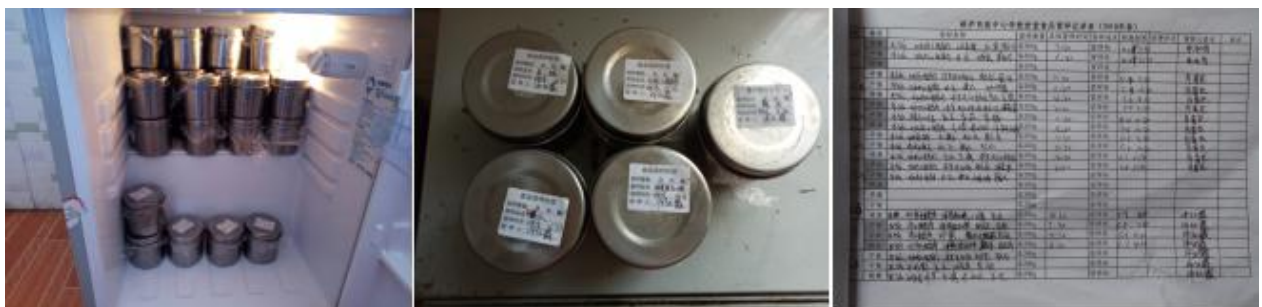
图 I - 4 食品留样情况组图