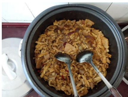
图III-5 老师加菜情况图