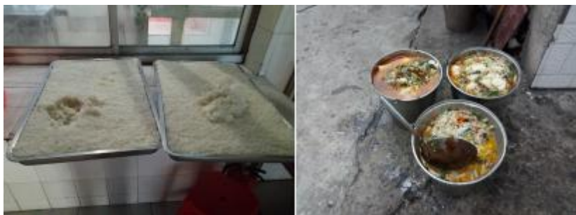
图III-4 餐后剩余及浪费情况组图