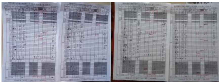
图 II-2 出入库单组图