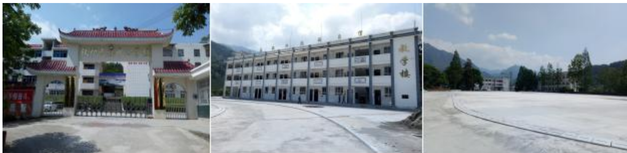
图 2 学校情况组图