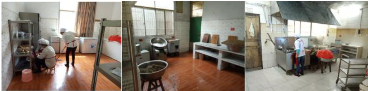
图 I - 2 厨房卫生情况组图