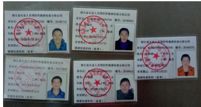
图 I - 1 厨师健康证组图