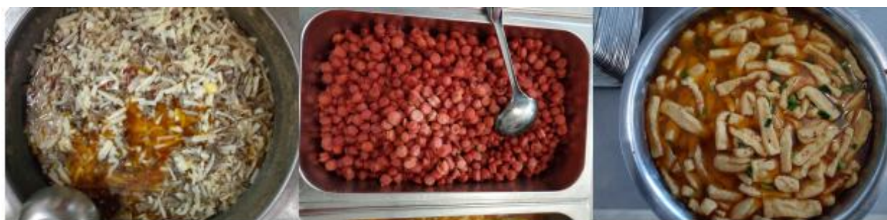
图III-1 稽核当天菜品情况组图