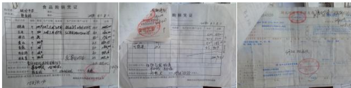
图 II-1 原始凭证组图