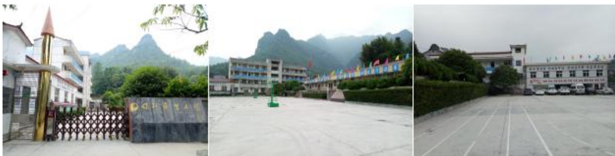
图 2 学校情况组图