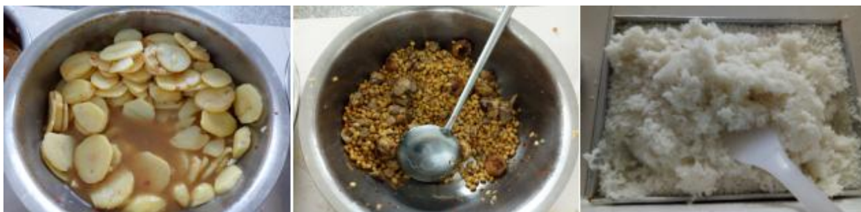
图III-4 餐后剩余情况组图