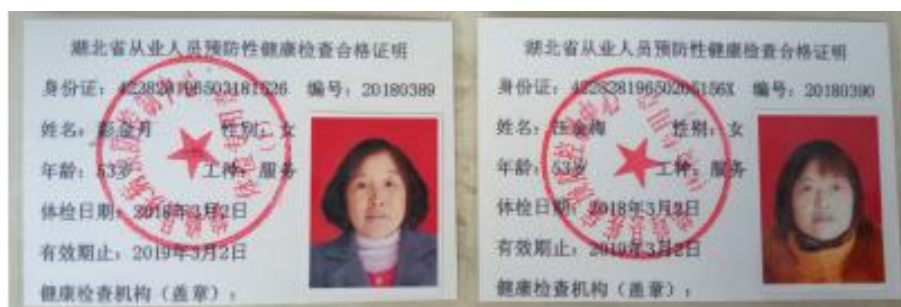
图 I -1 厨师健康证组图