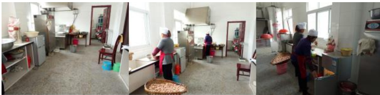
图 I -2 厨房卫生情况组图