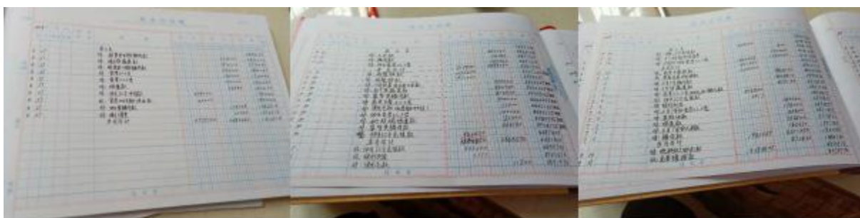
图 II-4 现金账组图