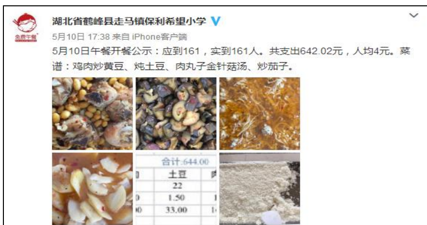
图IV-1 稽核当日学校微博截图