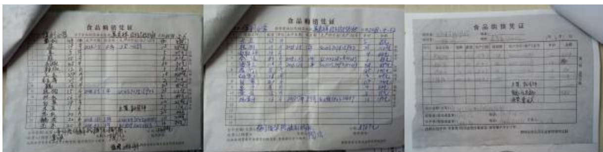
图 II-1 原始凭证组图