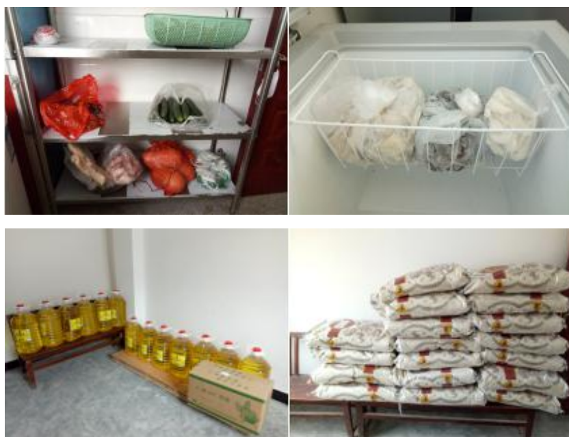
图 I -3 食材储存情况组图