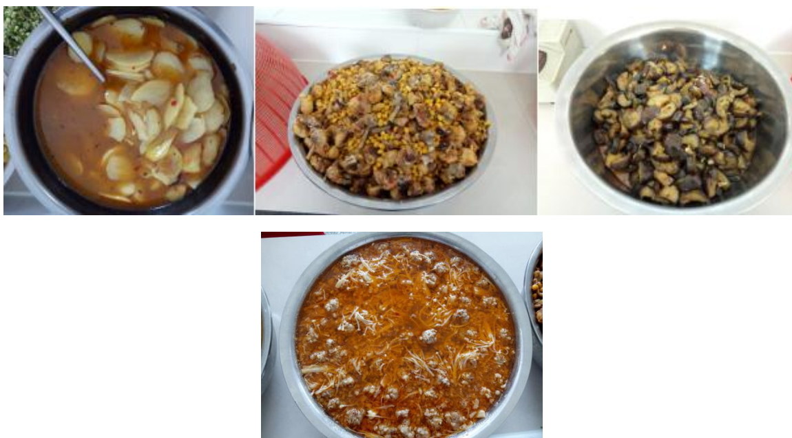
图III-1 稽核当天菜品情况组图