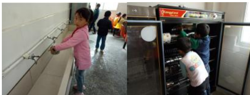
图III-3 餐后卫生情况组图