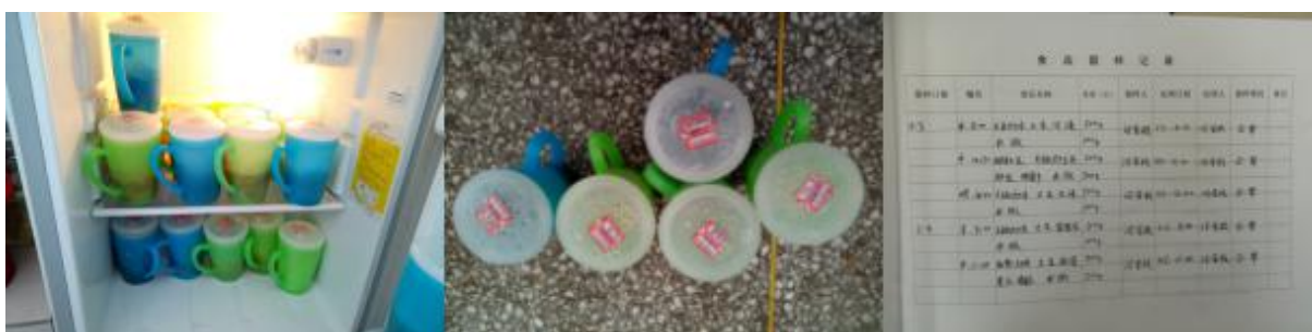
图 I -4 食品留样情况组图