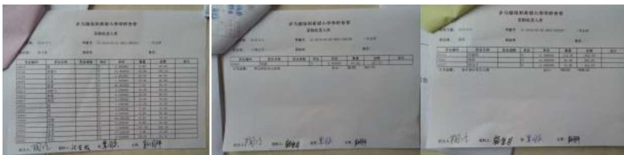
图 II-3 入库单组图