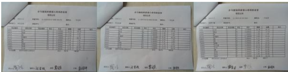
图 II-2 出库单组图