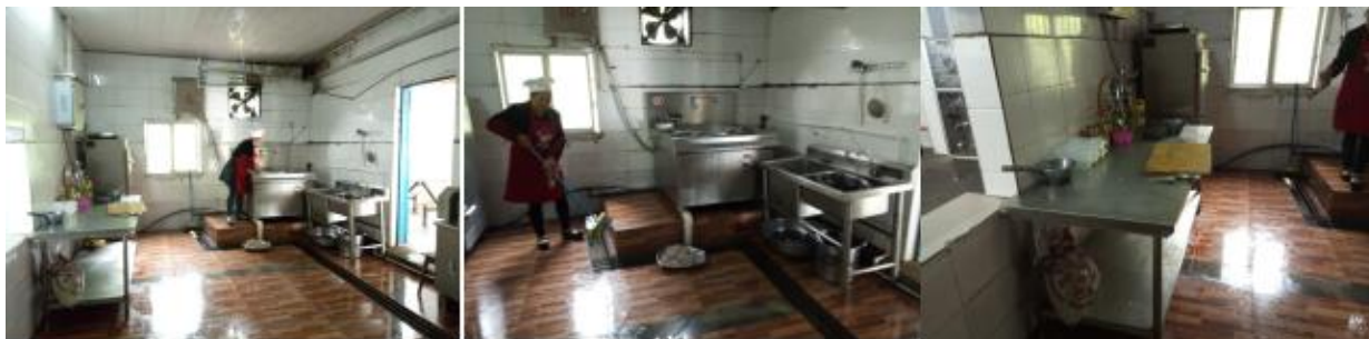
图 I -2 厨师、厨房卫生情况组图