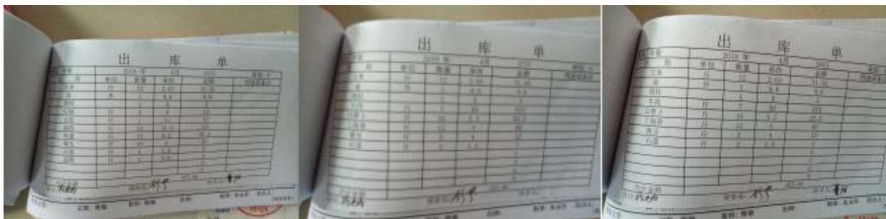
图 II-3 出库单组图