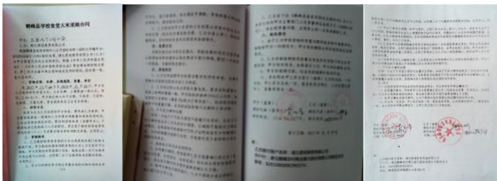
图 II-5 部分采购合同组图