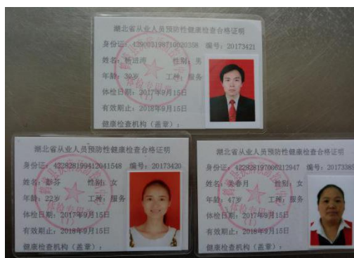
图 I -1 厨师健康证组图