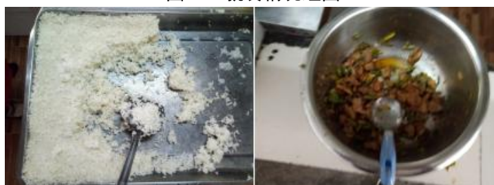
图III-3 餐后剩余情况组图