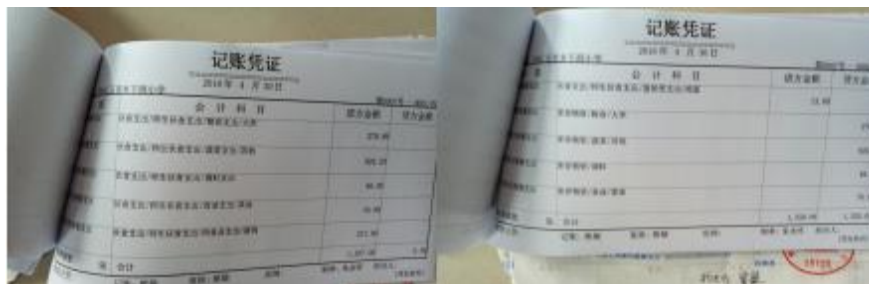
图 II-2 记账凭证组图