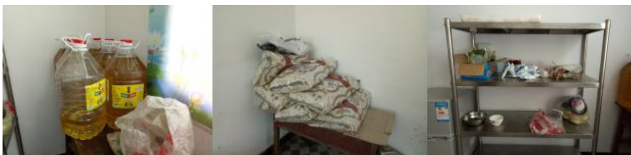
图 I -3 食材储存情况图