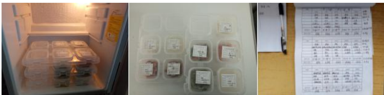
图 I -4 食品留样情况组图