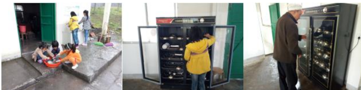
图III-3 就餐卫生情况组图