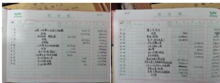
图 II-4 现金流水账组图