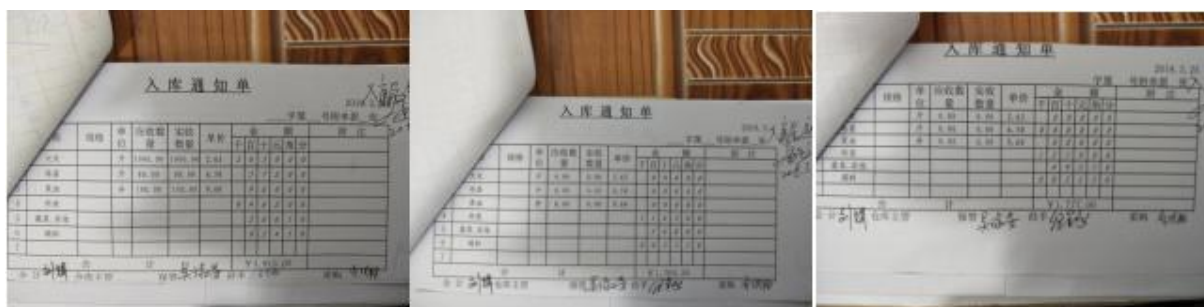
图 II-2 入库单组图