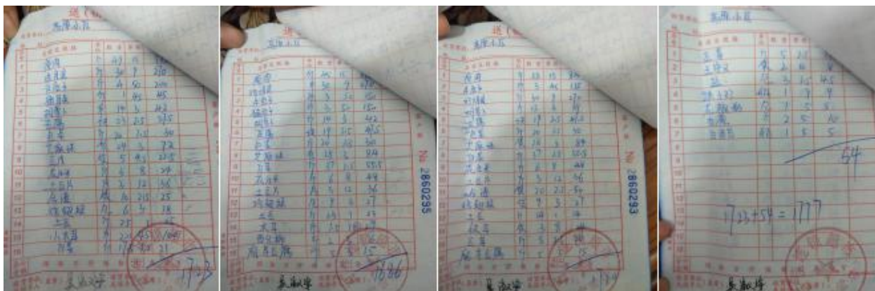
图 II-1 原始凭证组图