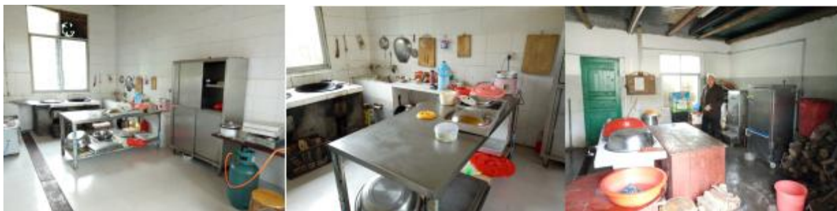
图 I -2 厨师、厨房卫生情况组图