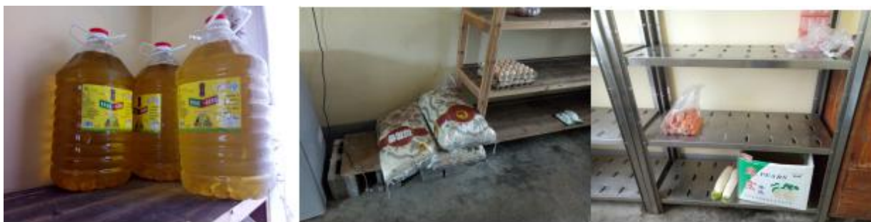
图 I -3 食材储存情况图