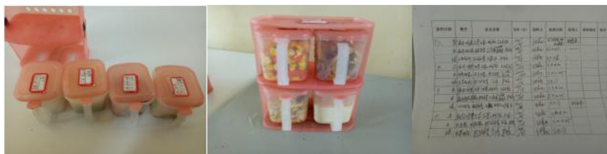
图 I -4 食品留样情况组图