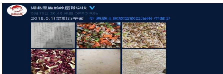
图IV-1 开餐当日微博截图

菜品、食材是否属实项扣分原因是学校微博只有图片公示，虽然有出库图片公示，但出库数据存在不准确性，同时缺少入库微博。