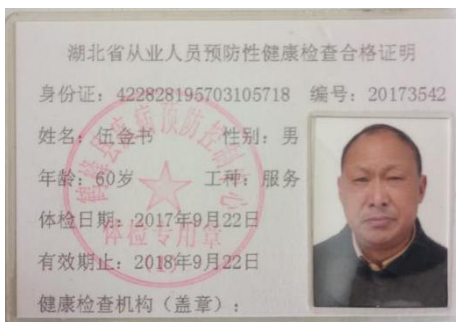
图 I -1 厨师健康证图