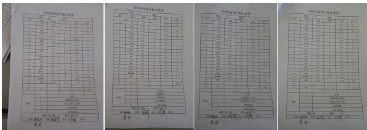
图 II-3 出库单组图