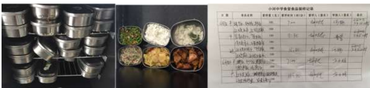
图I-4 食品留样情况组图 (留样记录记录了6月10日星期日全天开餐)