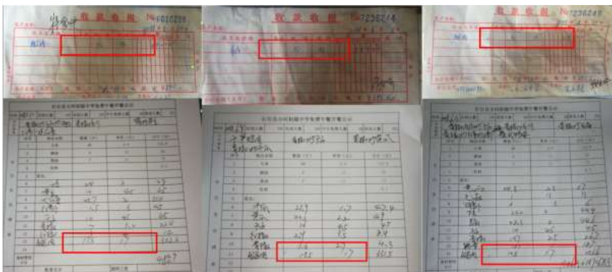
图 3 采购单与微博公示对比图

(3) 该校就餐结束剩余米饭很多,学生倾倒饭菜也比较多,构成了严重浪费,因此追加扣分 20 分。