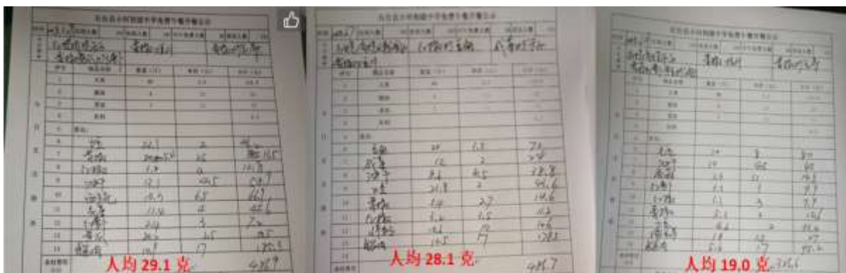
图IV-3 部分荤菜不足30克开餐微博截图