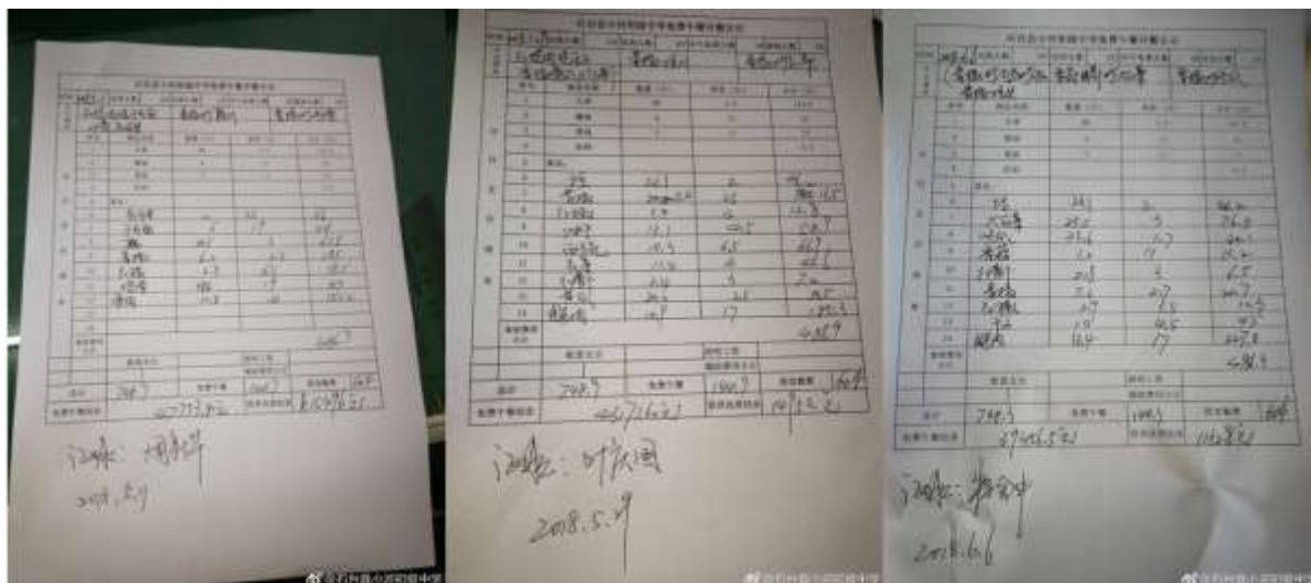
图II-2 开餐公示单组图（可在微博查阅每日开餐公示单）