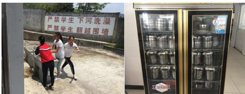
图III-3 就餐卫生情况组图（从左到右依次为餐前洗手、餐具消毒）