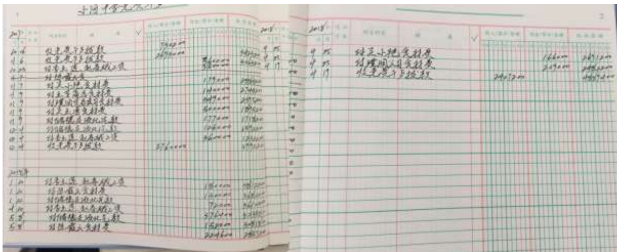
图II-3 现金流水账组图