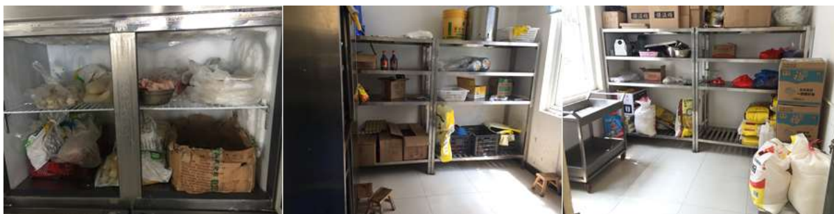
图I-3 食材储存情况组图 (结霜的冰箱)