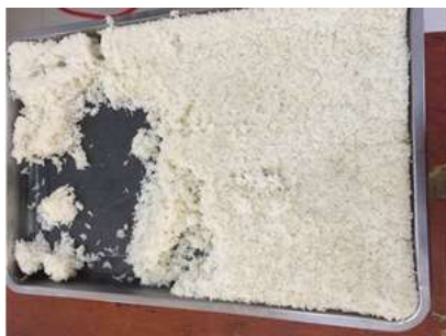
图 4 隔夜米饭图