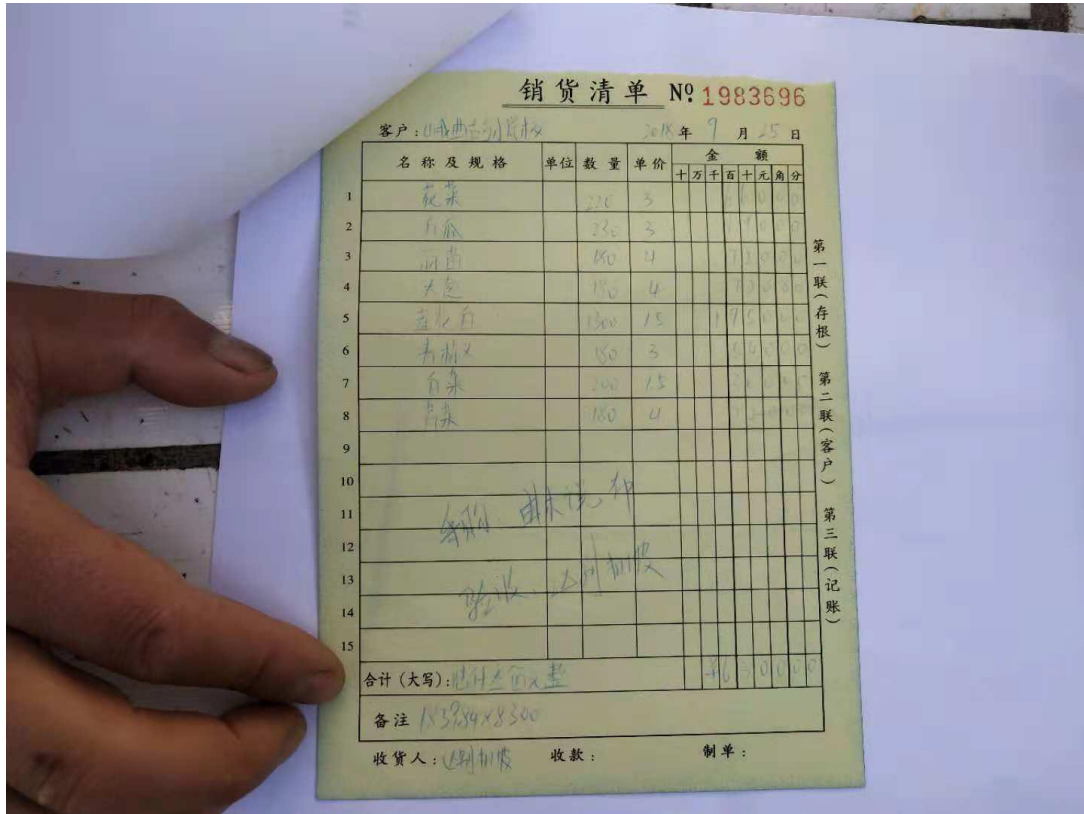
注: 9月免费午餐蔬菜采购单原始凭证。