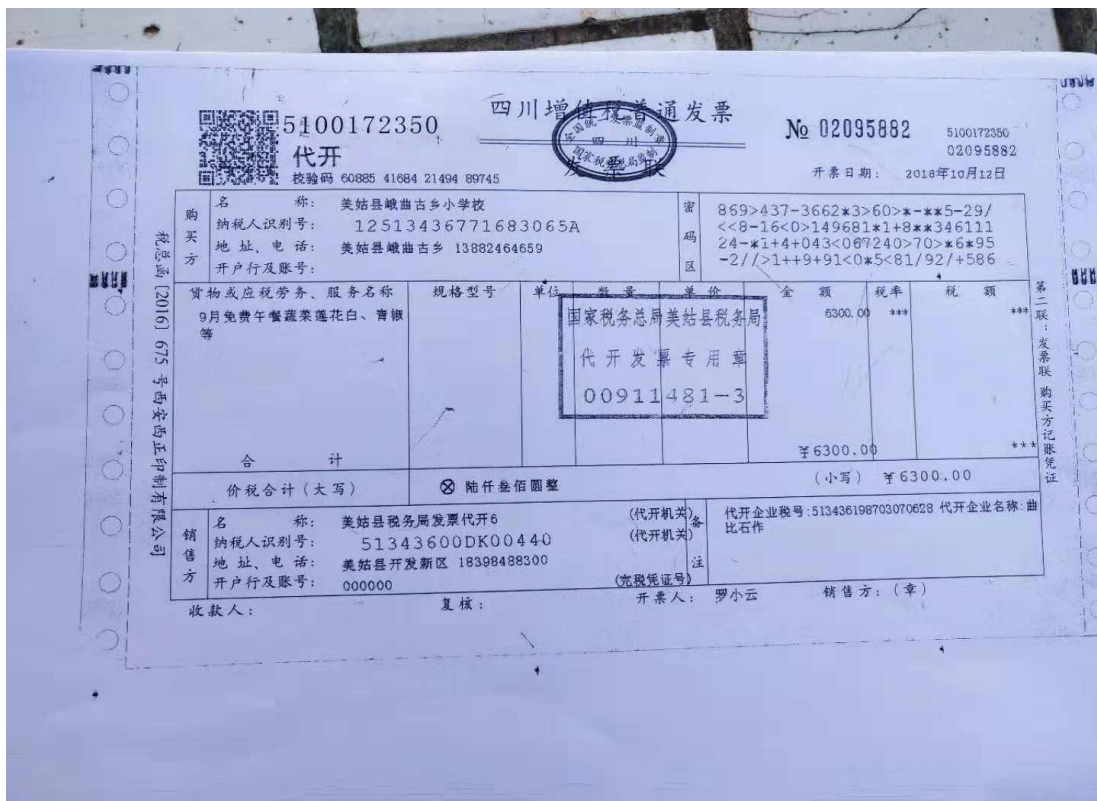
注：9月免费午餐报销凭证。