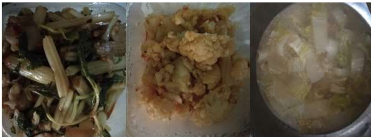
图III-1 稽核当天菜品情况组图