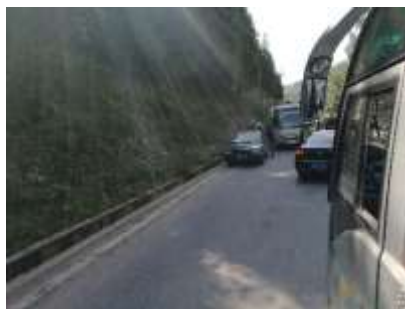
图 1 路况图

交通说明：自美姑县城前往峨曲古中心校，可在美姑县汽车站坐 8：40 洪溪方向的班车，到峨曲古中心校下车。