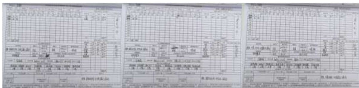
图II-2 出、入库登记组图