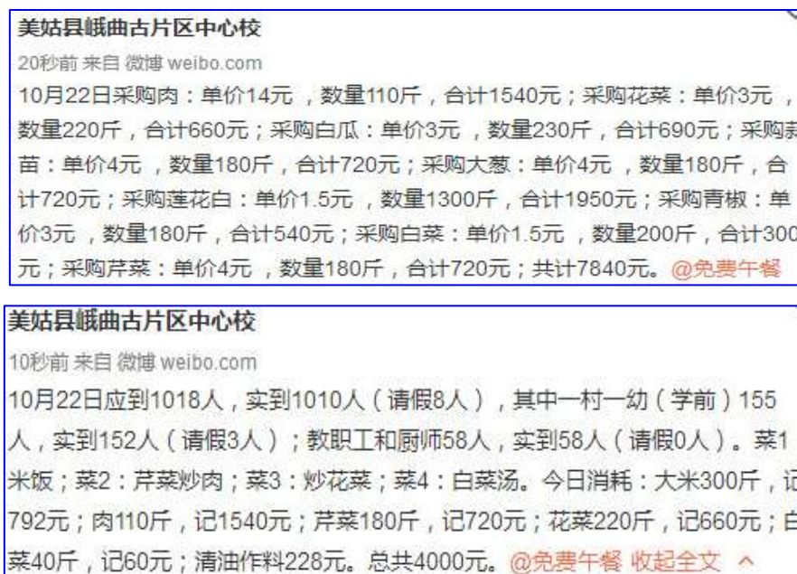
图IV-1 稽核当日微博截图