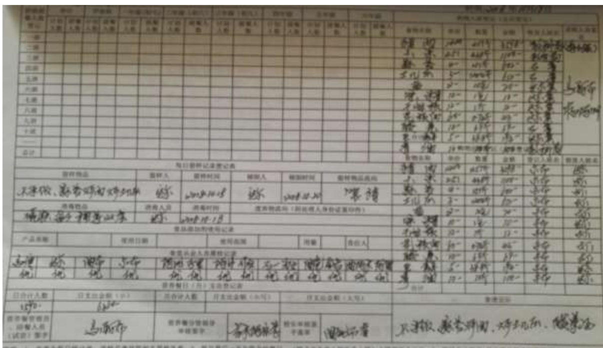
图II-2 入、出库登记情况组图