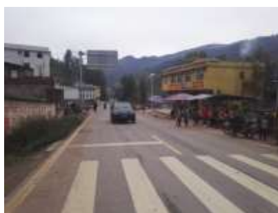
图 1 路况图

交通说明：自美姑县城前往新桥，可在县城汽车站乘坐前往雷波、昭觉、西昌方向的班车，也可在小汽车站乘坐前往大桥、牛牛坝方向的班车，可直接到达学校门口。