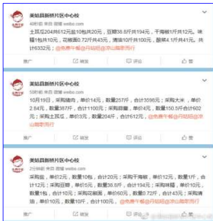
图IV-1 开餐当日微博截图