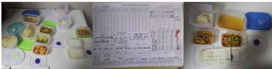
图I-4 食品留样情况组图