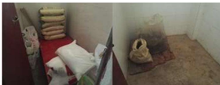
图I-3 食材储存情况组图