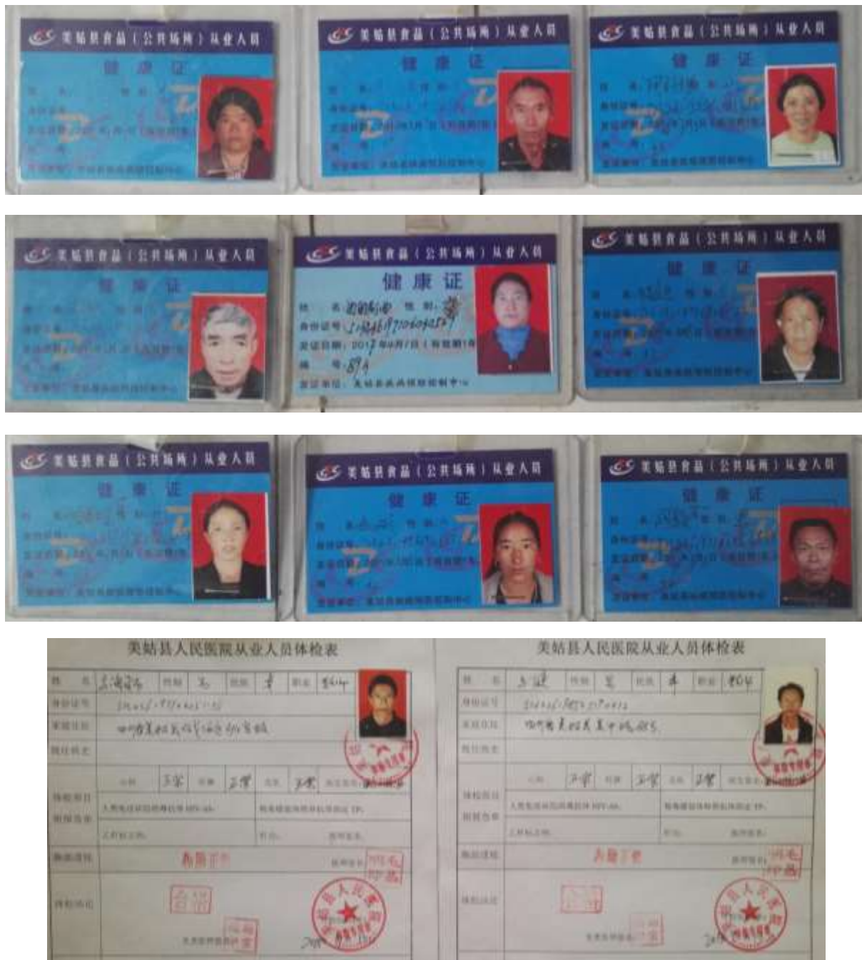
图I-1 厨师健康证组图