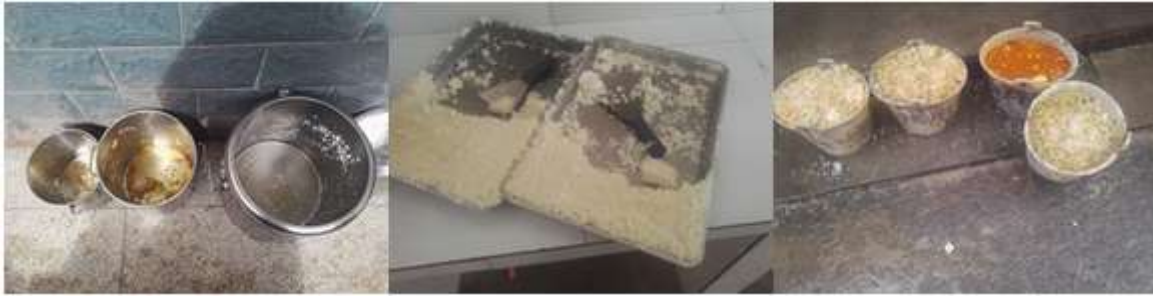
图III-4 剩菜剩饭情况组图（从左到右依次为剩菜剩饭、餐余）