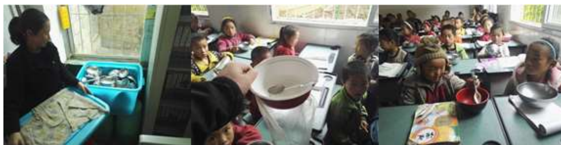
图III-3 就餐卫生情况组图（上排为餐具清洗与消毒，下排后二图为不合格餐具）