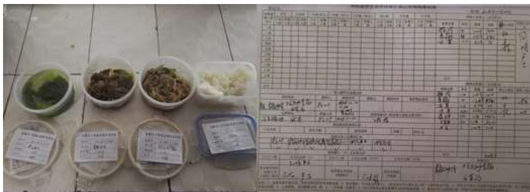
图I-4 食品留样情况组图