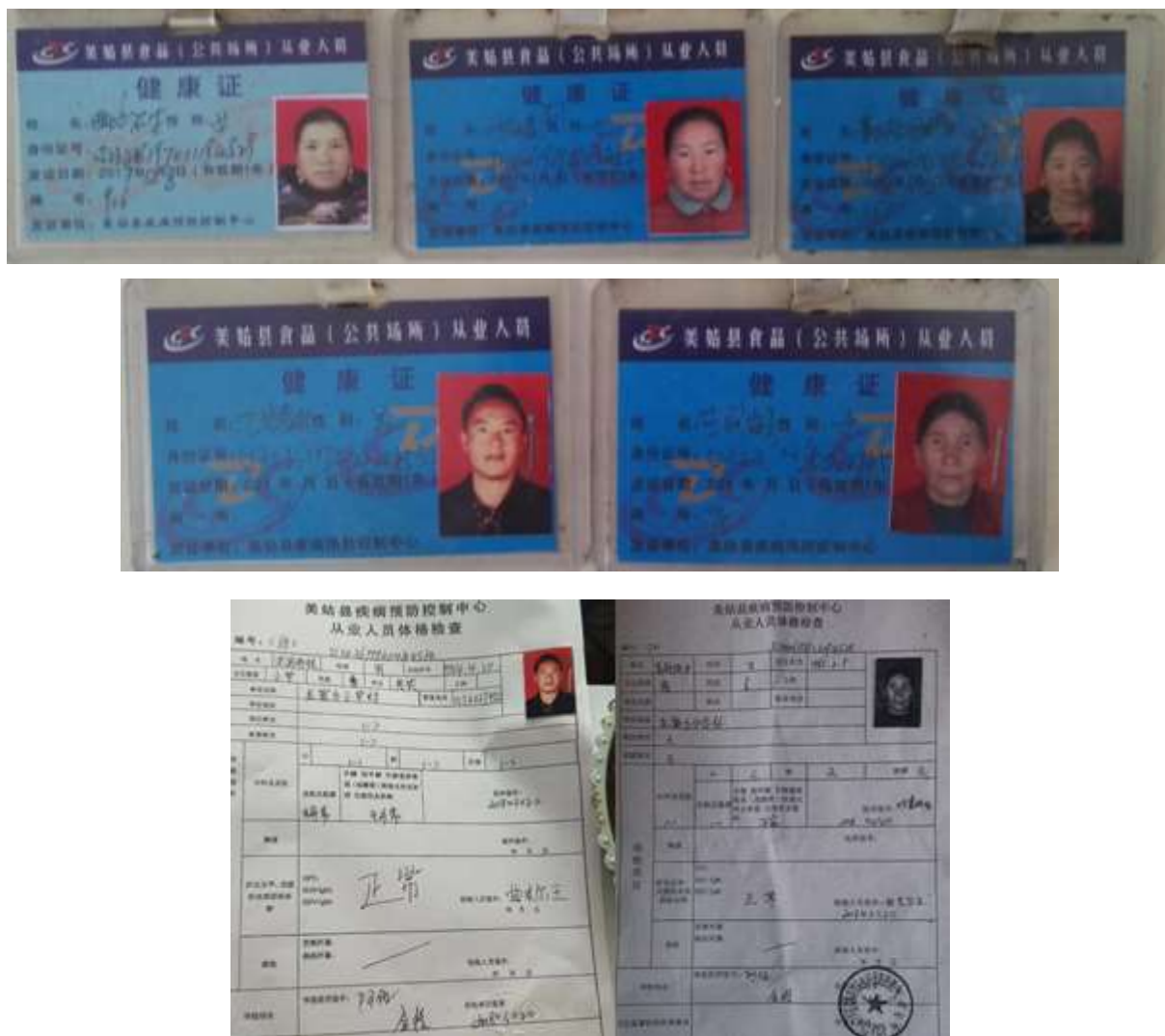
图I-1 厨师健康证组图