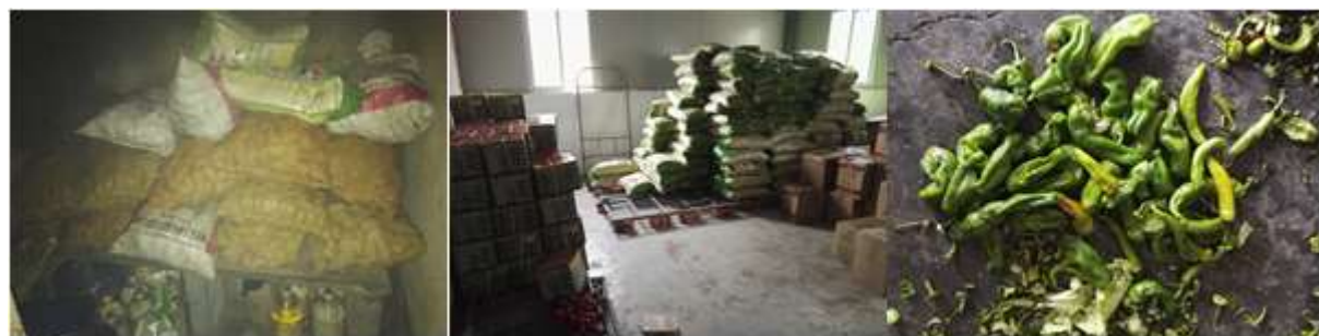
图I-3 食材储存情况组图 (第三张图为腐烂的青椒)