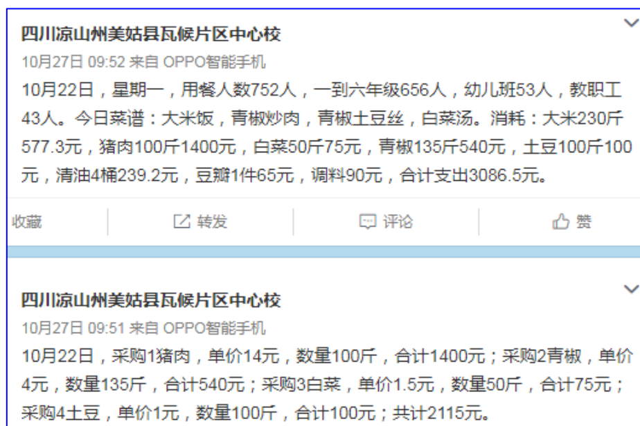
图IV-1 开餐当日微博截图