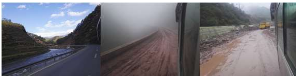
图 1 路况组图

交通说明：自美姑县城前往龙窝乡，县城汽车站平时有两趟班车，正常情况路程3个小时。因近期坏了一辆班车，加之常年修路，路况极差，造成路途时间较长且不固定。本次稽核是周末提前一天乘班车到达龙窝，周一下校，尔后下午返回县城的。