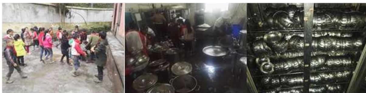
图III-3 就餐卫生情况组图（上依次为餐前洗手、餐具清洗与消毒）