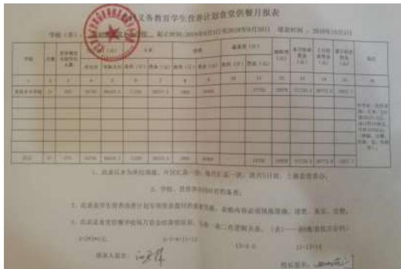
图 II-3 现金流水账组图