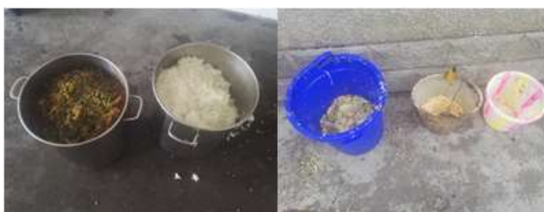
图III-4 剩菜剩饭情况组图（从左到右依次为剩菜剩饭、餐余）