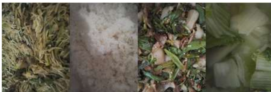
图III-1 开餐当天菜品情况组图