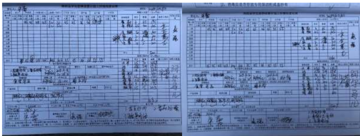
图II-3 营养改善计划工作情况登记表整体情况组图