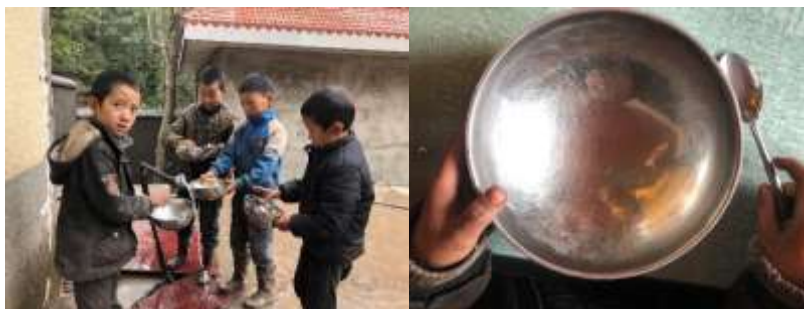
图III-3 就餐卫生情况组图（左：部分学生饭前洗碗，右：部分卫生状况极差的餐具）