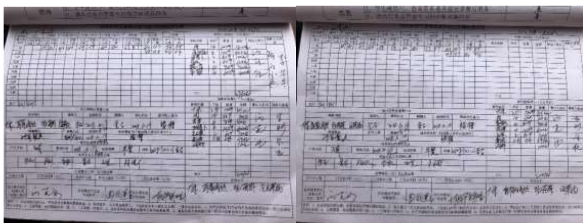
图II-3 营养餐工作情况登记表整体情况组图