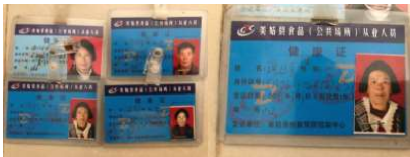
图I-1 厨师健康证组图