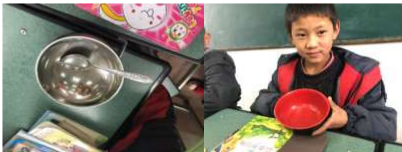
图III-3 部分学生餐具卫生状况组图