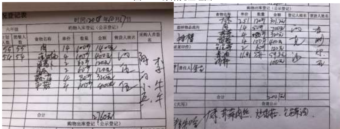
图II-2 出入库记录组图