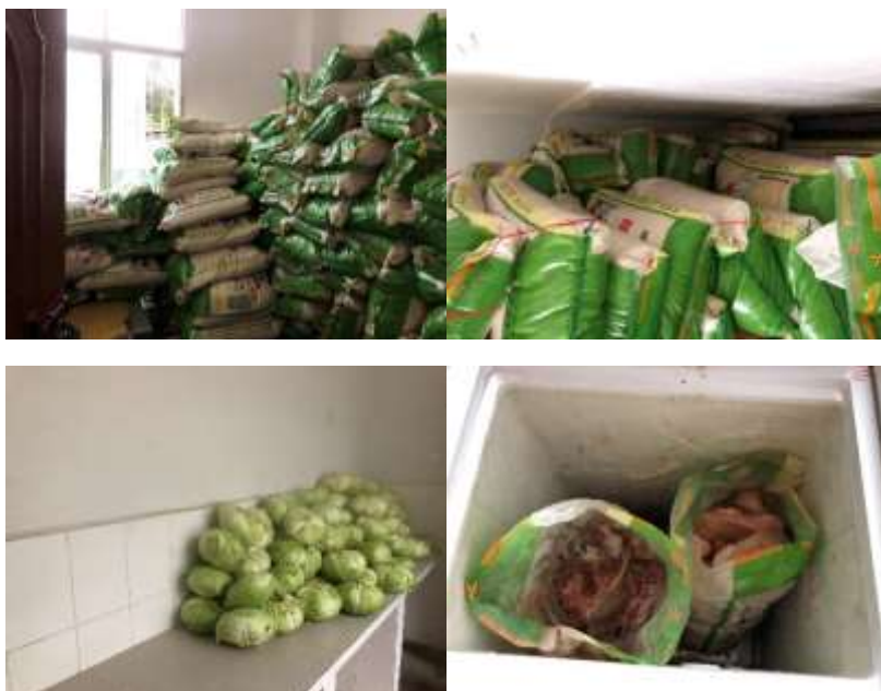
图I-3 食材储存情况组图