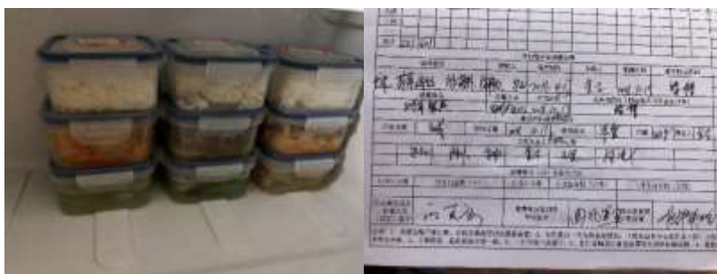
图I-4 食品留样情况组图