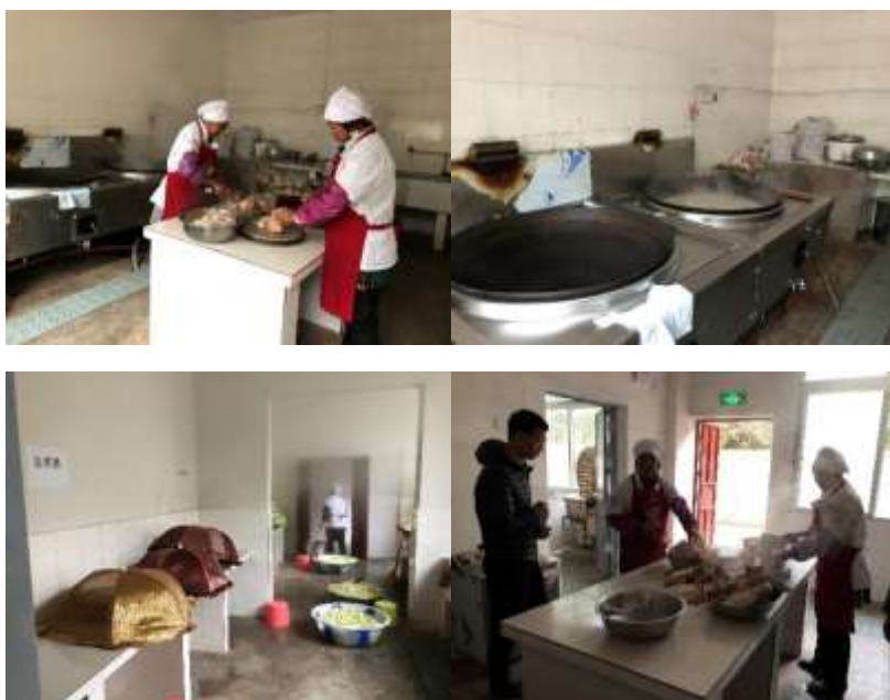
图I-2 厨师、厨房卫生情况组图