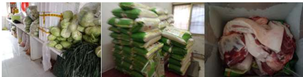
图I-3 食材储存情况组图（结霜的冰箱）