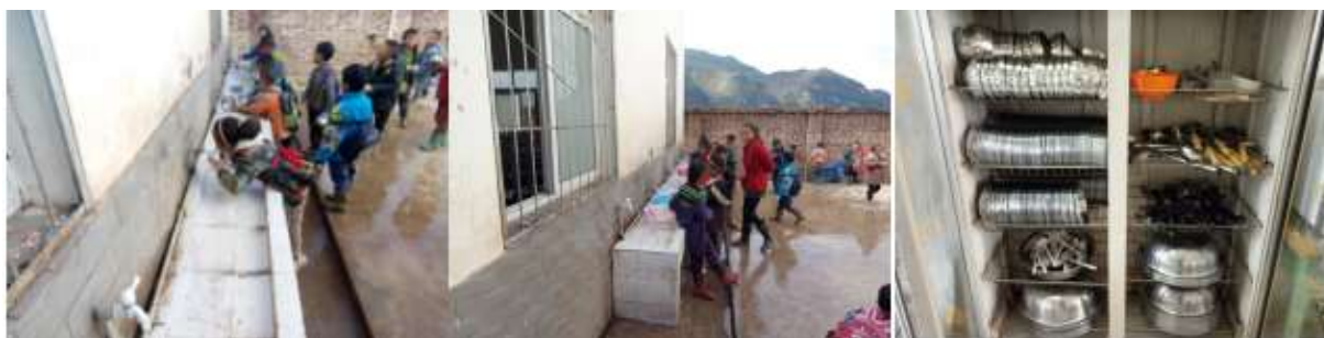
图III-3 就餐卫生情况组图（餐具清洗和餐具消毒图片）