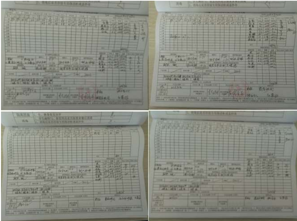
图II-2 学校开餐记录台账组图（出入库登记、留样消毒等记录）