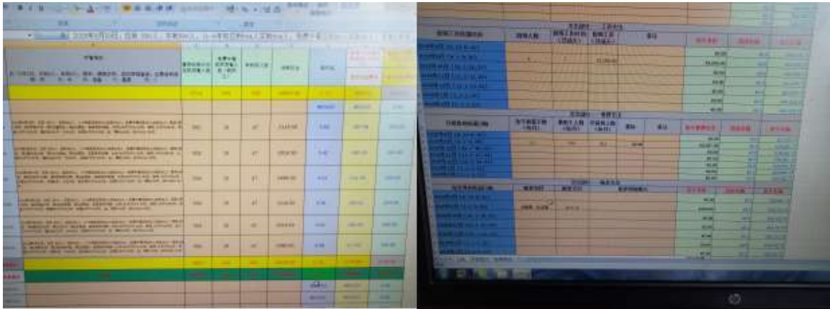
图II-3 现金融水账组图