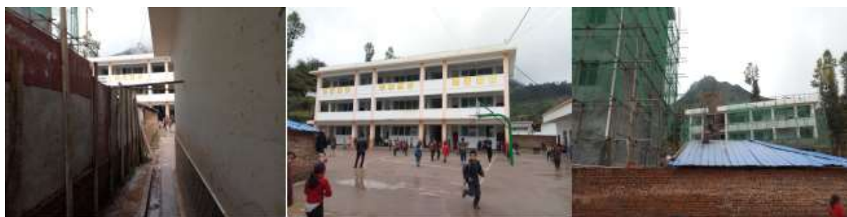
图 3 学校情况组图