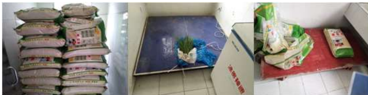
图I-3 食材储存情况组图