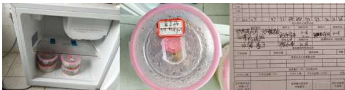
图I-4 食品留样情况组图