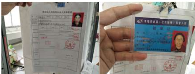
图I-1 厨师体检合格证及健康证组图