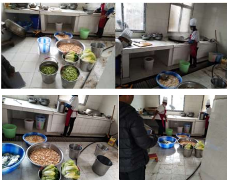
图I-2 厨师、厨房卫生情况组图