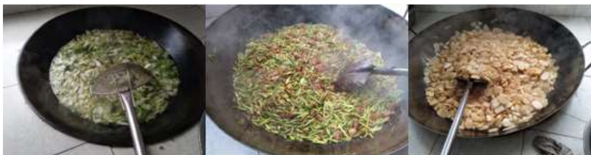
图III-1 稽核当天菜品情况组图