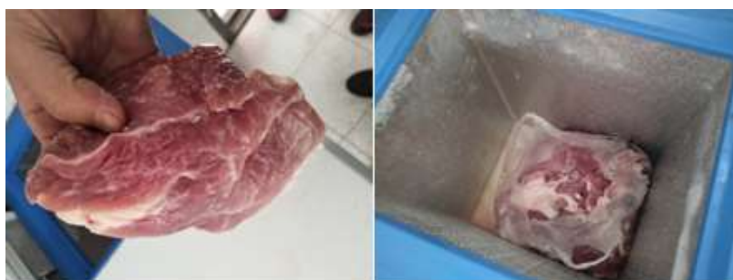
图 3 有异味食品图

稽核现场发现冰箱内储存有一大袋肉约 30 斤，有明显异味，存在食品安全隐患，因此追加扣分 20 分。